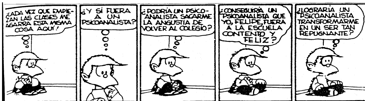
Tira cómica 2