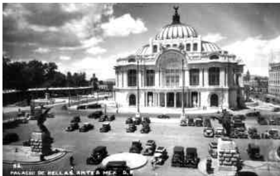
Lámina 7. Dos postales: Chac Mool, Museo de Antropología y Palacio de Bellas Artes, México, D. F.