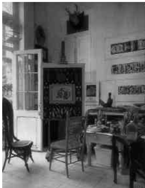
Lámina 5. Dos postales: Mural de Rufino Tamayo, México, Sanborn's y Estudio de Amelia Peláez, La Habana.