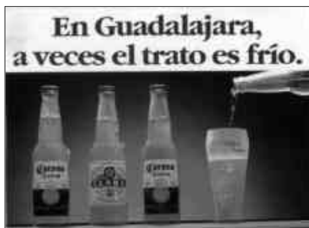
Lámina 4. Comercial de Corona , en: Revista Vuelo , Mexicana de Aviación, México, enero de 1995.