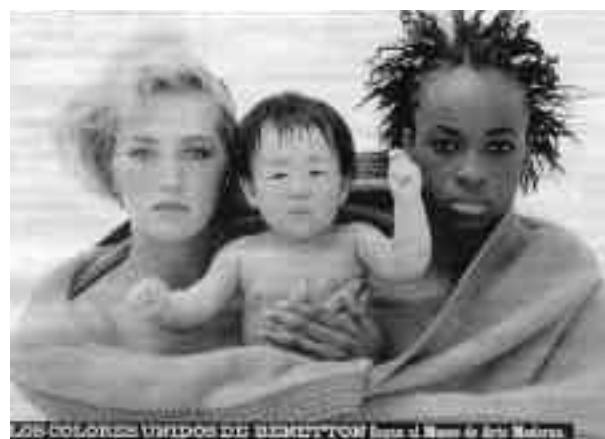
Lámina 3. "Los colores unidos de Benetton".