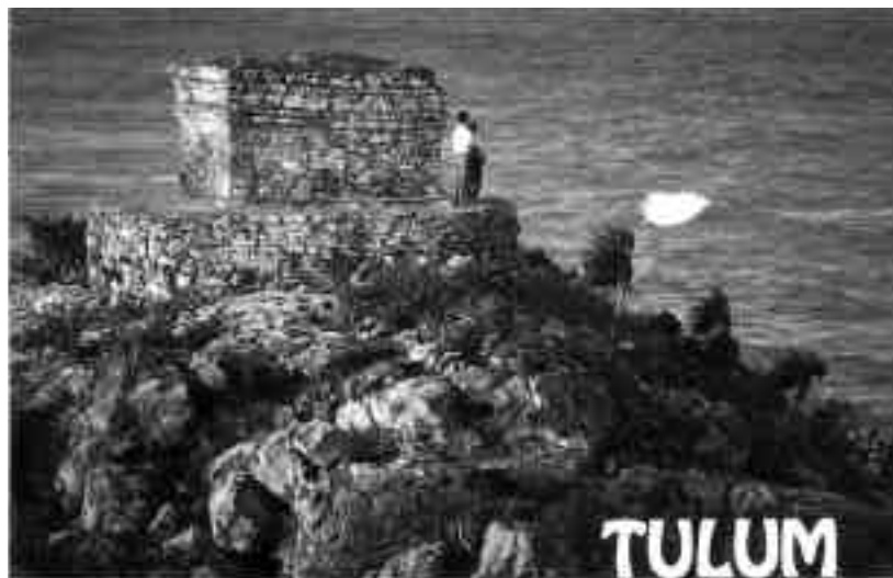
Lámina 6. Dos postales: "Cabeza de Venado" Santa María del Tule, Oaxaca, y Tulum, Quintana Roo.