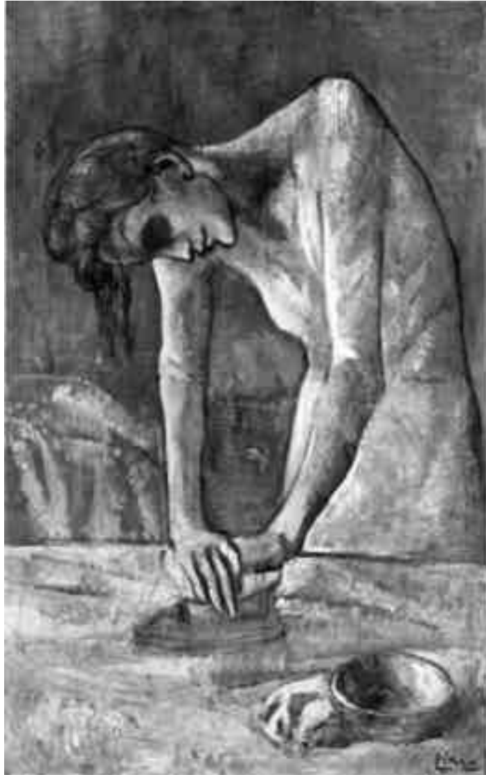
Lámina 10. Picasso, Pablo, "Mujer planchando", París, 1904.