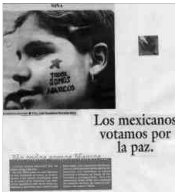
Lámina 2. Composición de textos de La Jornada y Tele-Guía , México, febrero de 1995.