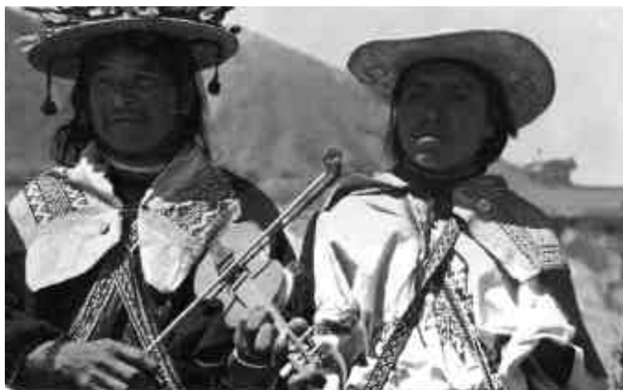
Lámina 8. Dos postales: Niños chamulas de los Altos de Chiapas e indígenas de la Sierra del Nayar, Nayarit, México.