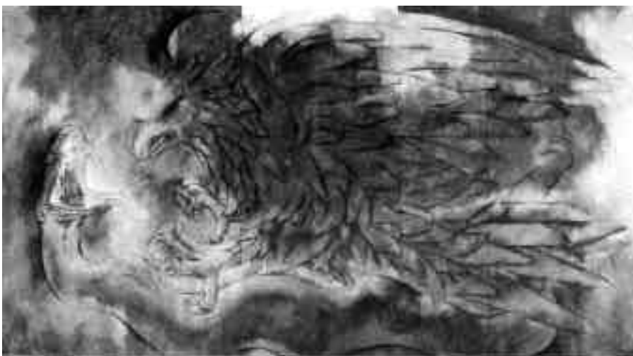
Lámina 9. Dos postales de murales de Fernando Castro Pacheco en el Palacio de Gobierno, Mérida, Yucatán, México.