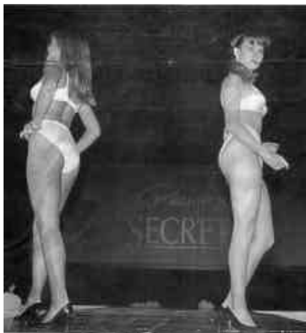
Lámina 1. Sección Sociales, Reforma , México, viernes 17 de marzo de 1995.