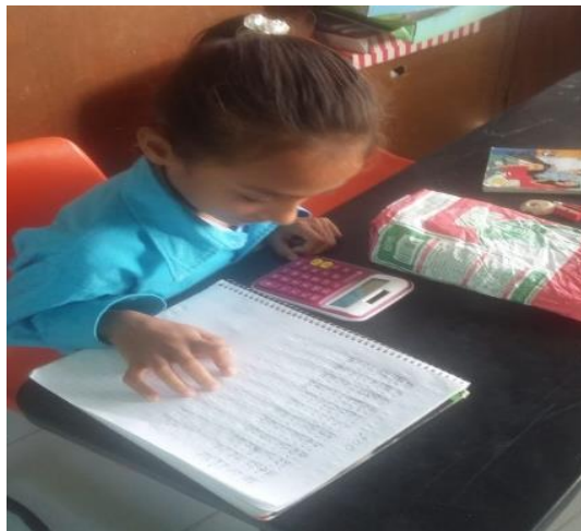
Padres de familia y alumnos.