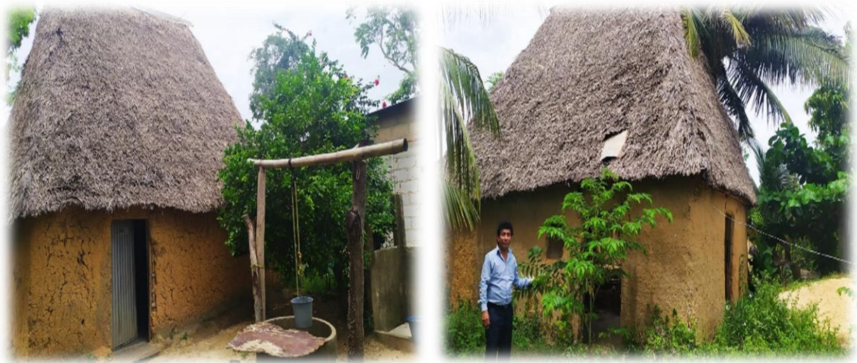
Viviendas construidas con ayuda mutua de los habitantes de la localidad.

El tequio es un tipo de trabajo igual como la faena, es decir, en esta comunidad lo realizan las personas como un trabajo colectivo, este tipo de trabajo proviene de las costumbres indígenas que existen en nuestro país y que en la actualidad aún se continúa con esta tradición en algunas localidades que no han perdido sus tradiciones y costumbres, las generaciones modernas han estado perdiendo de manera gradual este trabajo tan importante que es en beneficio de todos los habitantes de un pueblo, por ello, es importante el conocimiento de estos saberes ancestrales que han tenido gran impacto en épocas pasadas. No obstante, en algunas regiones de nuestro país continúa un gran arraigo en relación a estos trabajos no remunerados que muchas personas conocen poco sobre este tema.