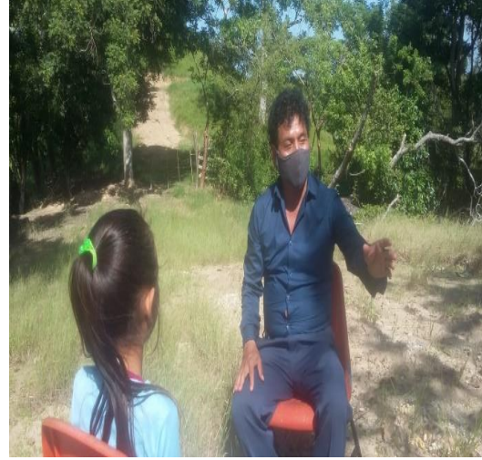
Visita a los alumnos en tiempos de pandemia. COVID-19