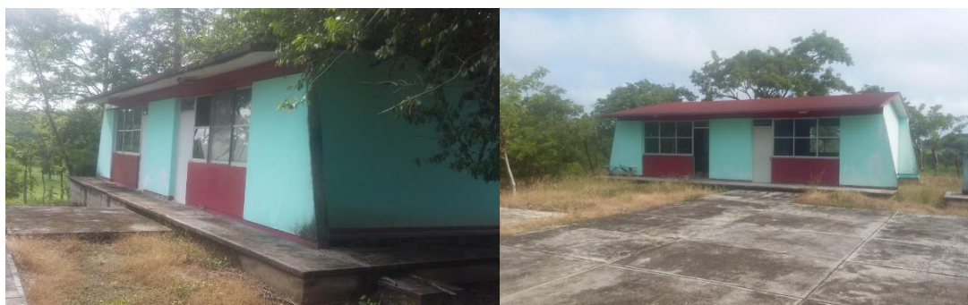
Infraestructura de la Escuela primaria Nicolás Bravo

a que los ejidatarios que la tienen en posesión solo aportan la cantidad de ocho mil pesos anuales, por ello, se obtienen muchas pérdidas económicas, muy a pesar de que los padres de familia insisten en que se respete el convenio de que aporten el cincuenta por ciento de las ganancias de la parcela escolar, sin embargo, los ejidatarios hacen caso omiso a esta petición. Por tal razón, esta escuela también se sustenta con las cuotas voluntarias por parte de los padres de familia, y este dinero es gastado en la compra de algunos insumos que sirven para la limpieza de los salones y mesabancos, así como detergentes que son utilizados para el aseo de los sanitarios de niños y niñas, estas labores escolares las realizan los padres de familia en apoyo a la escuela ya que no se cuenta con personal de intendencia y los trabajos de chapeo lo realizan por faenas y así es como funciona esta institución educativa.