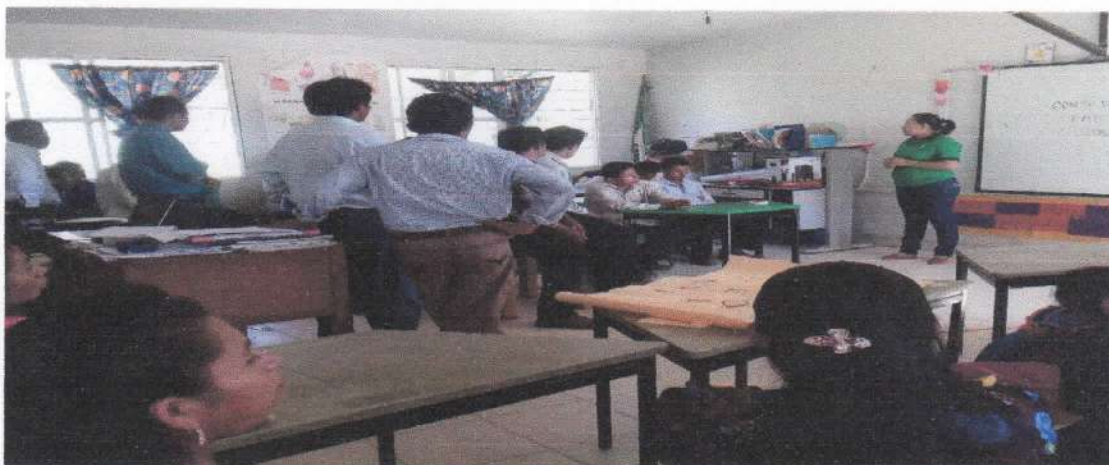
Anexo D. Problemas de lecto-escritura en alumnos del primer ciclo.