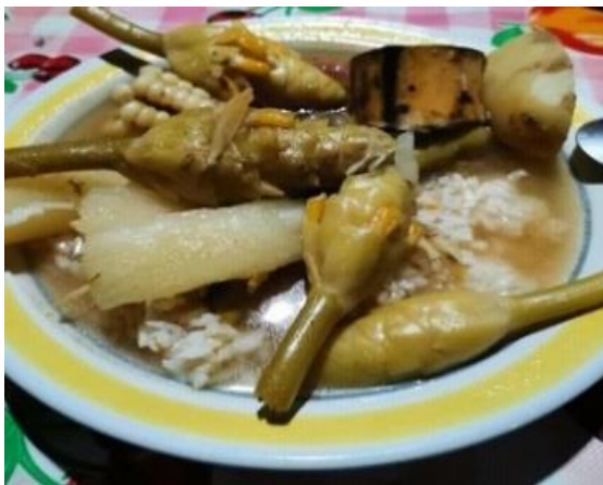
Platillo de pinolillo

Una peculiaridad de este lugar es la comida, que los adultos tienen la costumbre que por las tardes salen a pescar, tienen la creencia que, si te regalan un pescado, tienes que dar o regalarle una moneda, dicen para que la próxima que vaya a pescar tenga más suerte.