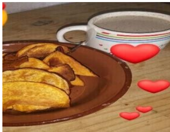
Pozol de cacao