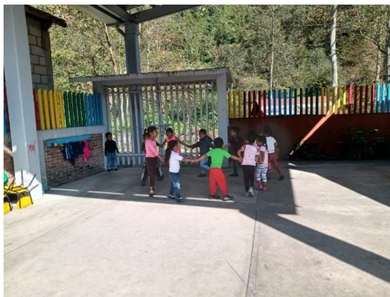
Imagen 4. Alumnos primero y segundo grado realizando actividades de integración