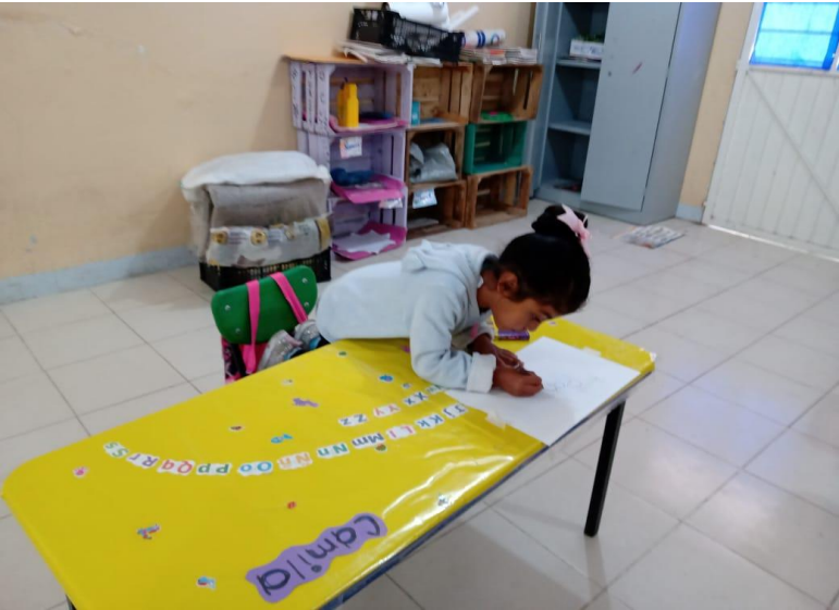
Imagen 2. Alumna de segundo grado realizando actividades.