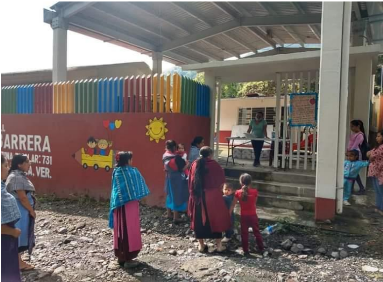
Imagen 1. Preescolar Gabino Barrera, Metlac Solano, la Perla, Ver