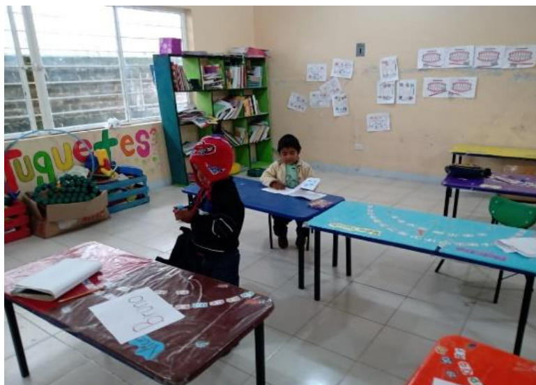
Imagen 3. Alumnos de primero y segundo grado realizando actividades de lectura