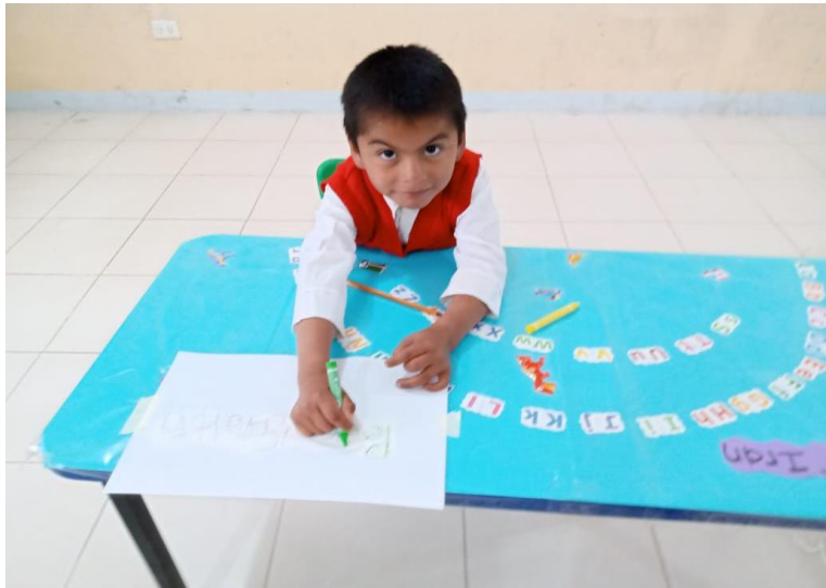
Imagen 5. Alumno realizando actividades