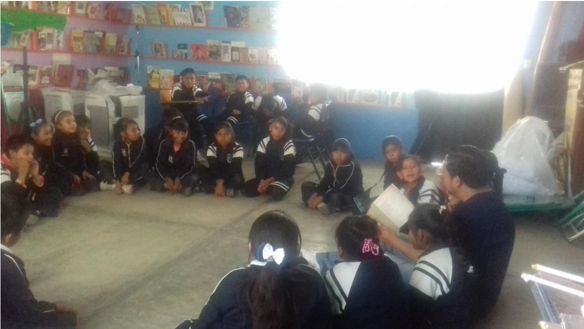
Anexo 3 Docente leyendo un cuento en la biblioteca escolar