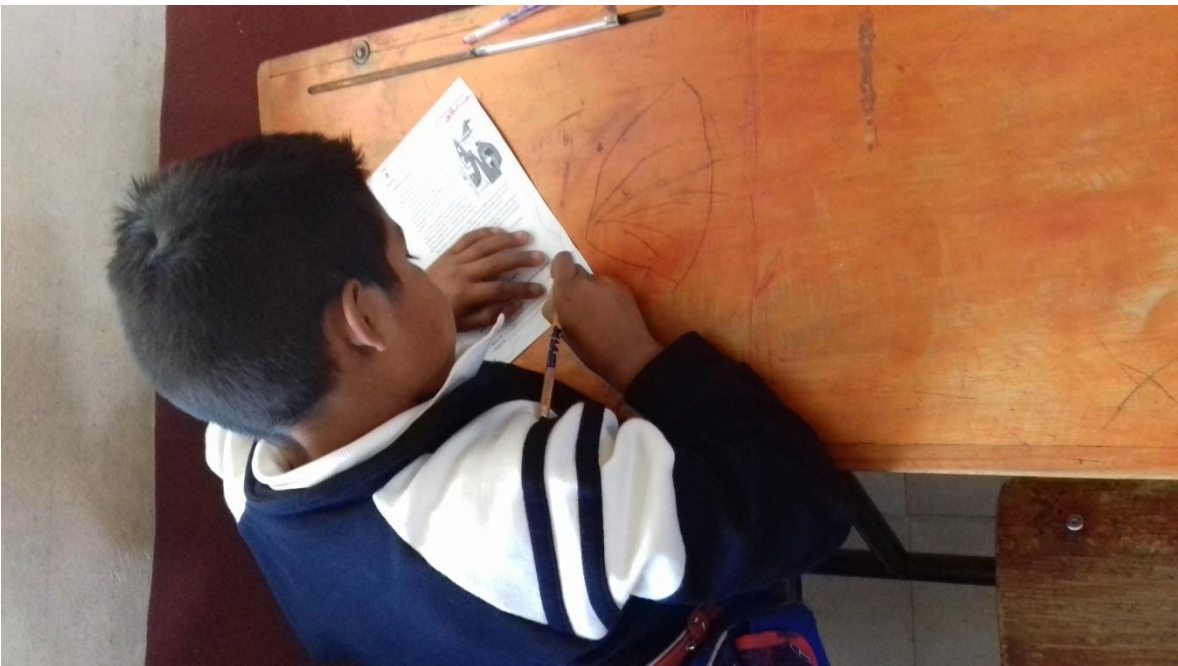
Anexo 4 Alumnos realizando las actividades