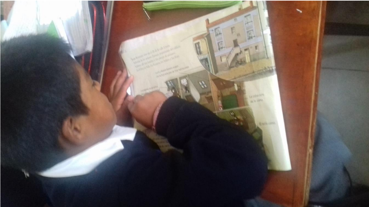
Anexo 2 Alumnos leyendo