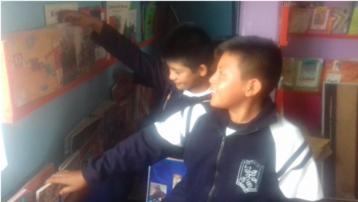
Anexo 5 Algunos libros que fueron seleccionados por los alumnos