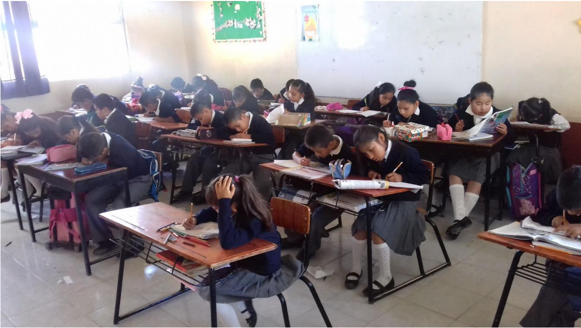
Anexo 1 Alumnos realizando las diferentes actividades