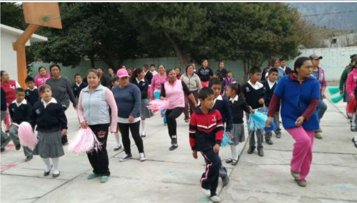
En fotografía se muestra la participación de madres de familia y alumnos de todos los grados realizando activación física antes de dar inicio a las clases.