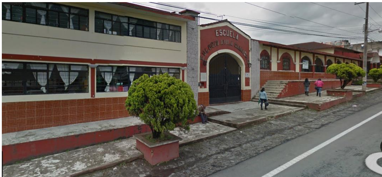
Fotografía de la escuela primaria Eulogio Ávila Camacho tomada desde la calle