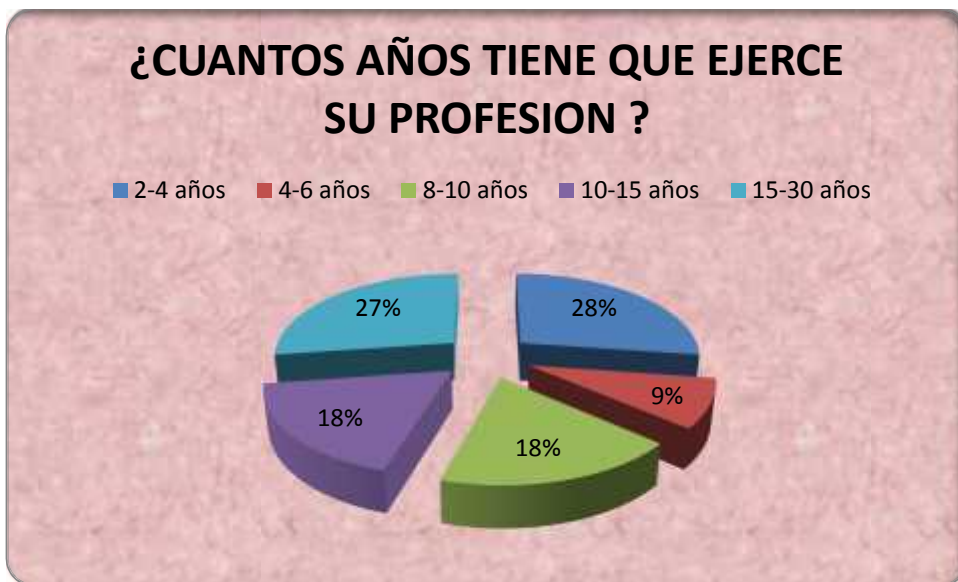
Gráfica No 2