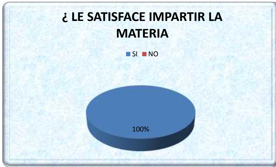
Gráfica No 3