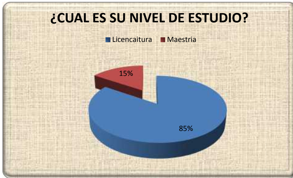
Gráfica No 1