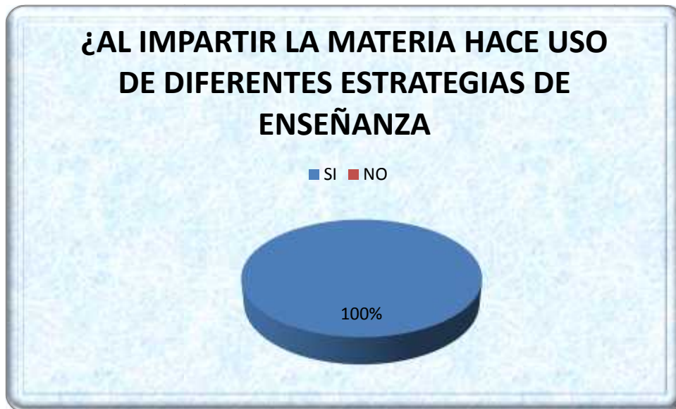
Gráfica No 4