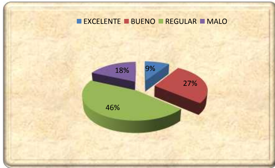
GRAFICA No 3 ¿COMO CONSIDERA QUE ES EL PROCESO DE ENSEÑANZA EN ESTOS TIEMPOS?

Al tener en concreto ya un análisis profundo de la investigación y viendo que los datos arrojaron que el mayor problema está dentro de la materia de Español porque los maestros no saben lo que es en sí una estrategia y por consiguiente solo utilizan en su labor docente de dos a tres estrategias de enseñanza para impartir cualquier contenido. Surge la necesidad de darle a este problema una solución.