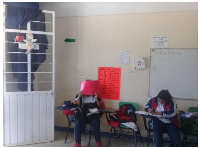
Aula de 6°- "A", infraestructura y condiciones.