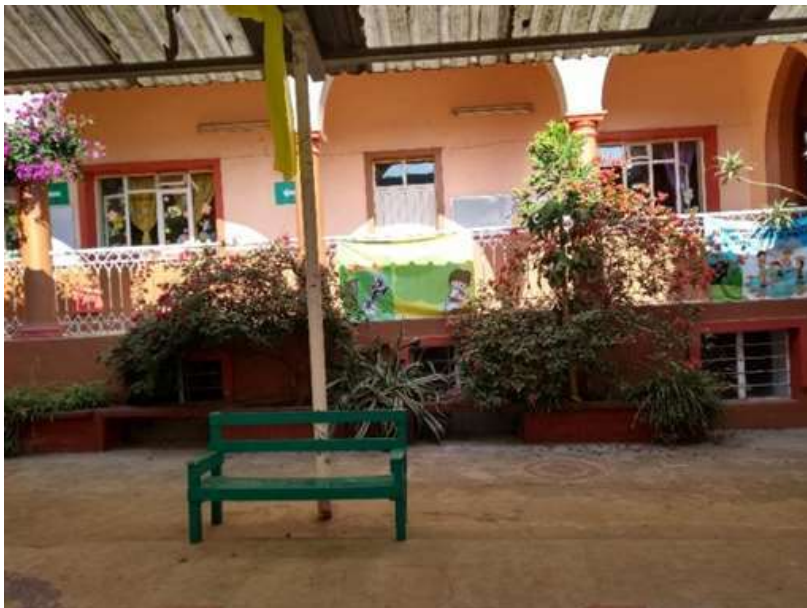
Jardín de niño “Esperanza Zambrano”.