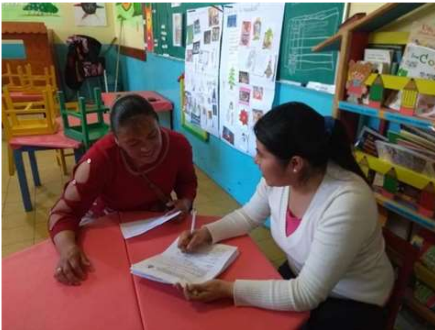
Entrevista a los padres de familia.