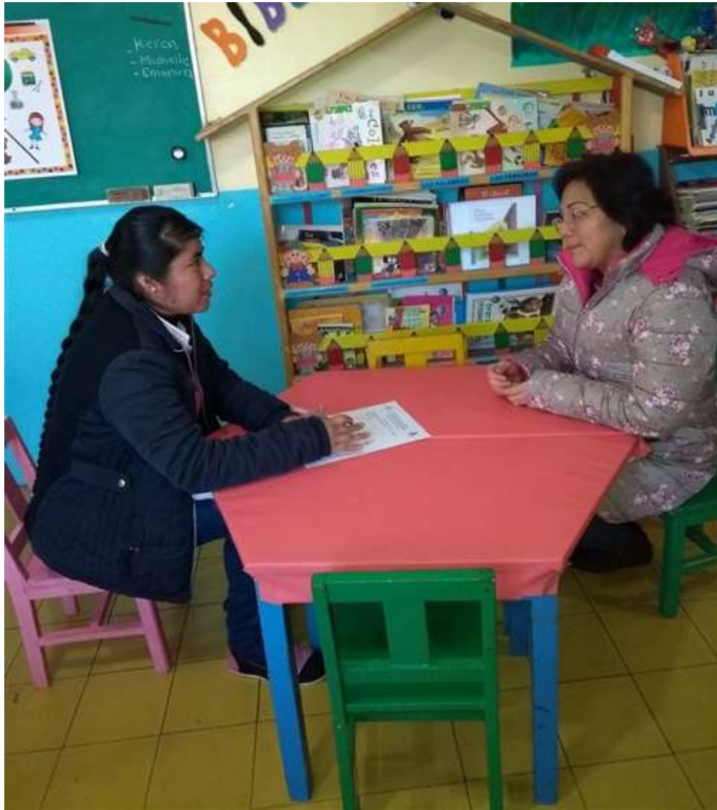
Entrevista a la maestra.