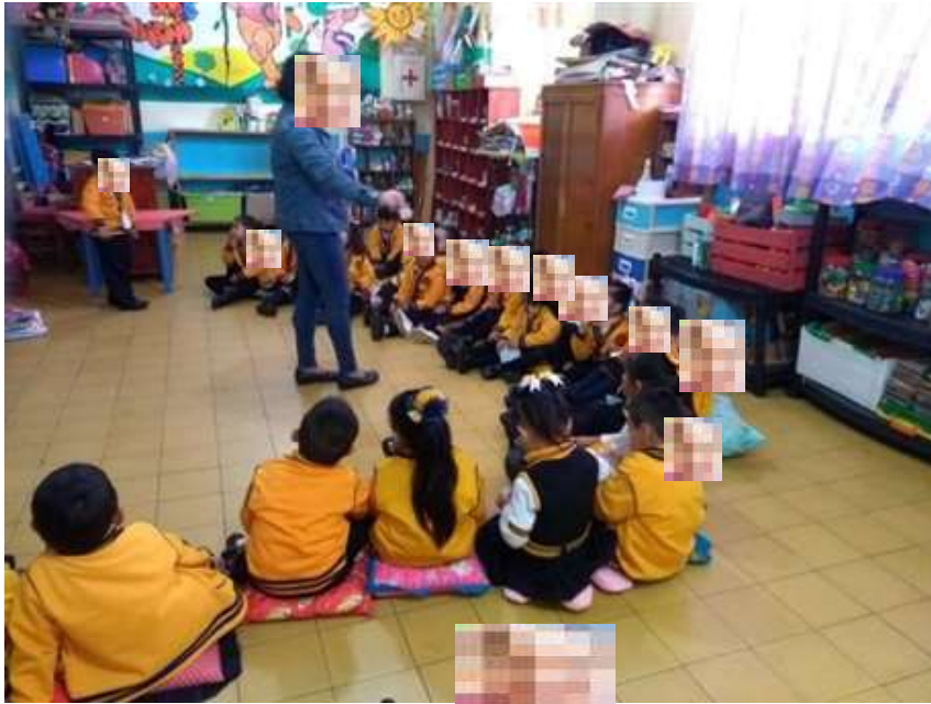
Aplicación de la guía de observación.