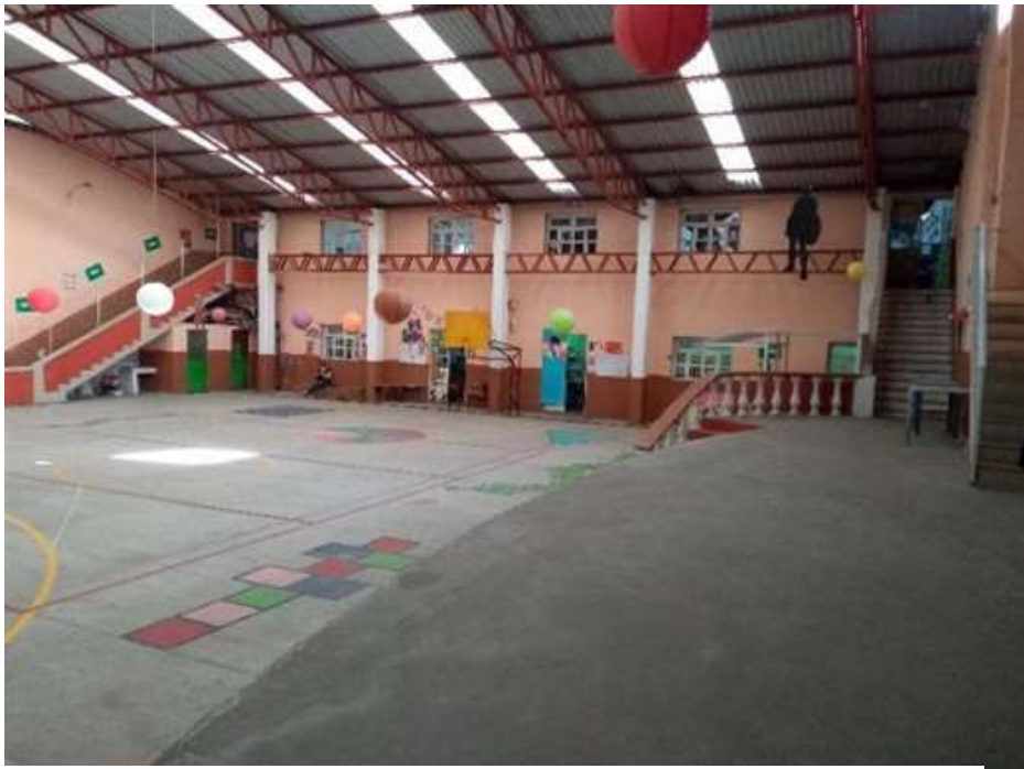
Jardín de niño “Esperanza Zambrano”.