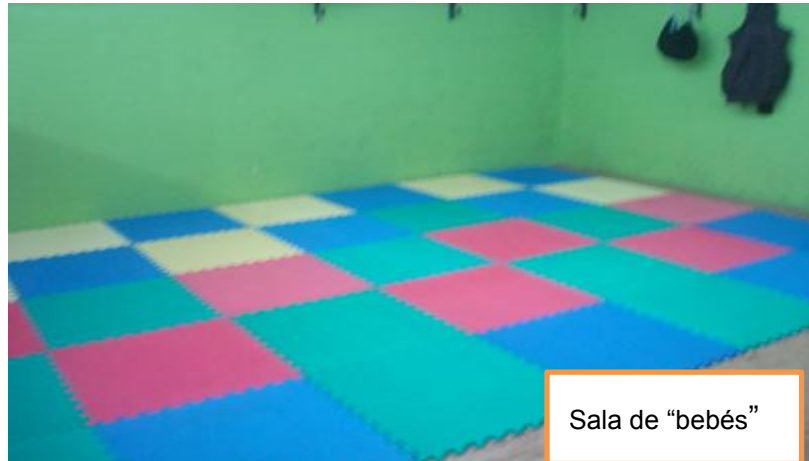
Sala de "bebés"