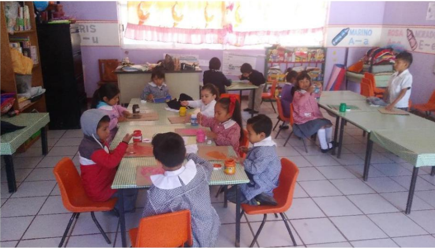
Coloreo las emociones