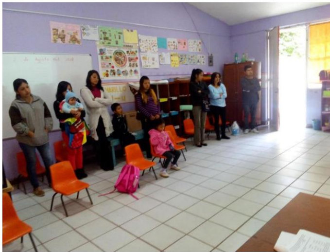
Cierre de actividades presentación a padres de familia