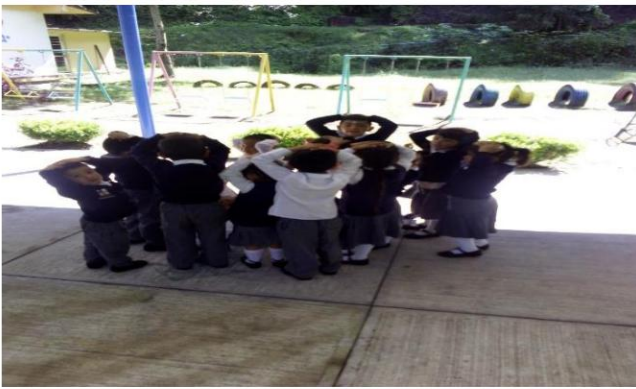
Pájaros y nidos actividad de cierre