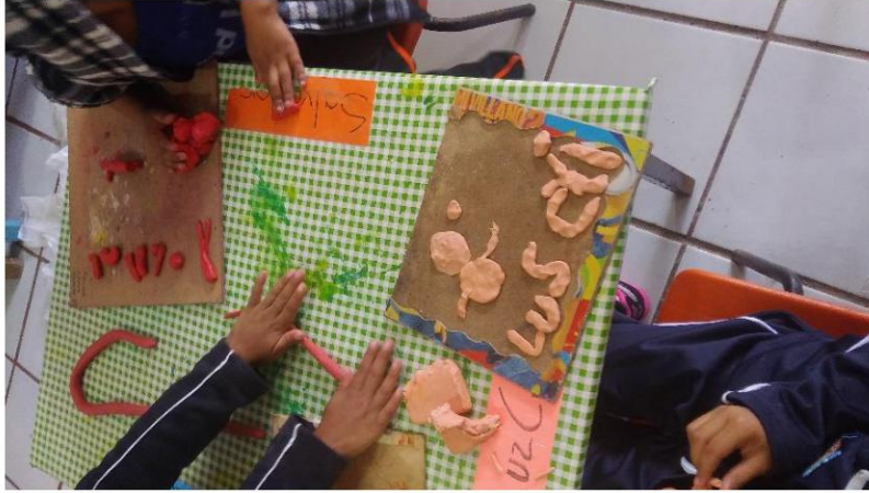
Moldeado de masita para contar cuento