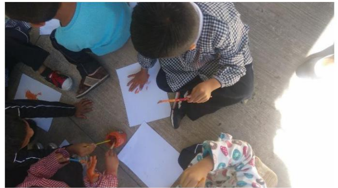
Complementara día de la mujer comparten material