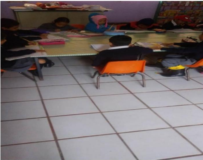
Trabajando con mi álbum