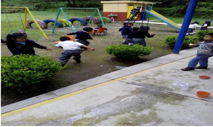
Dinámica de observación de cierre.