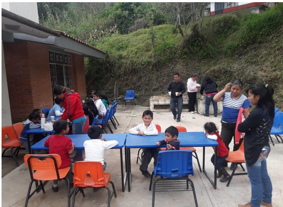
Fig. 2 Escuela Primaria "Arnulfo Báez" con clave 21KPRO570J