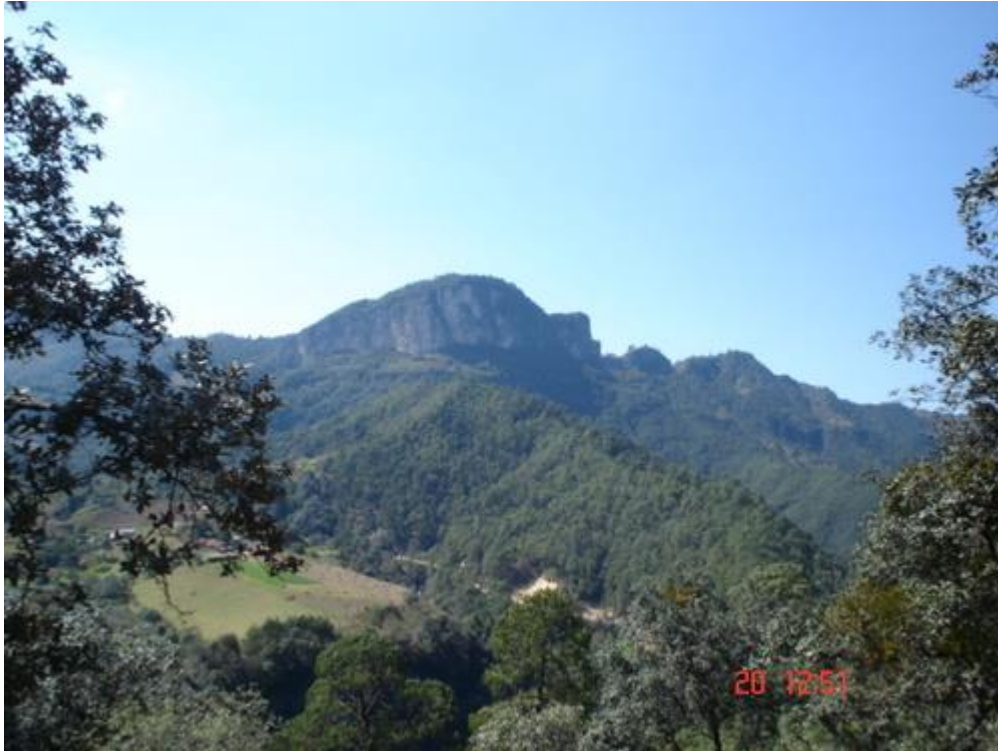
Fig. 1 La comunidad de La Cumbre está situada en el Municipio de Tlatlauquitepec (en el Estado de Puebla).