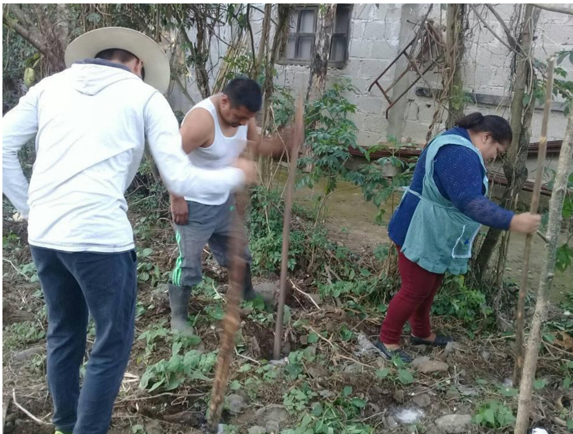
La siembra del maíz una práctica realizada por todos los habitantes de La Cumbre, para poder cubrir sus necesidades básicas.