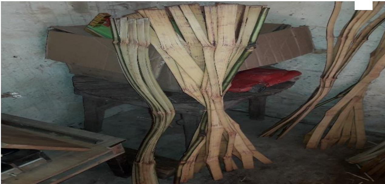
Costilla de encino o axokenke, para la base de los canastos.