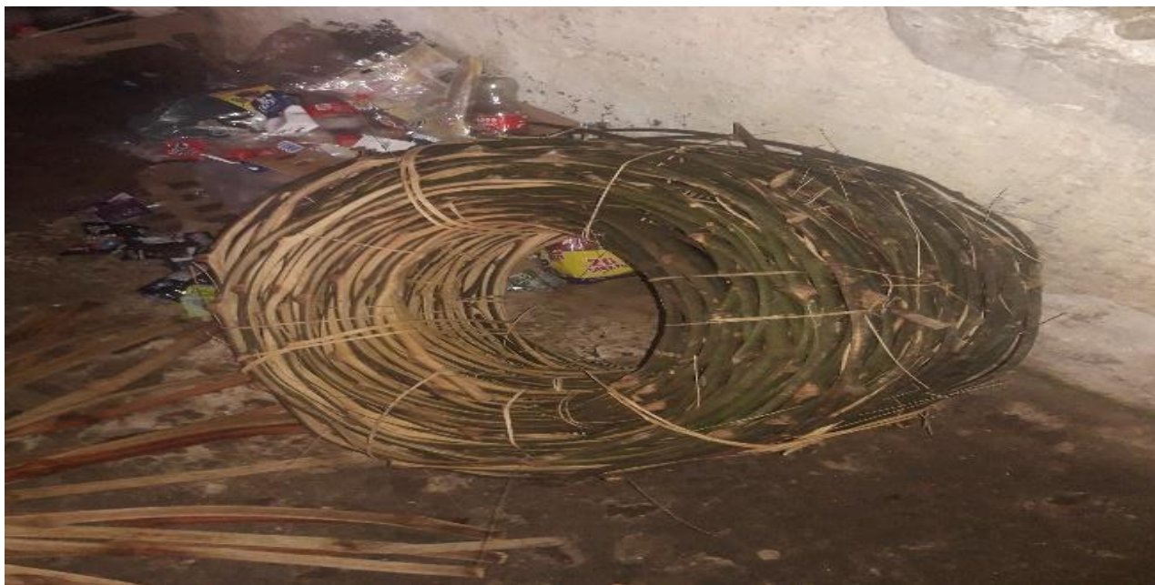
Bejuco, material recolectado de los arboles más grandes del monte conocido como lianas que serán para el fondo del canasto.