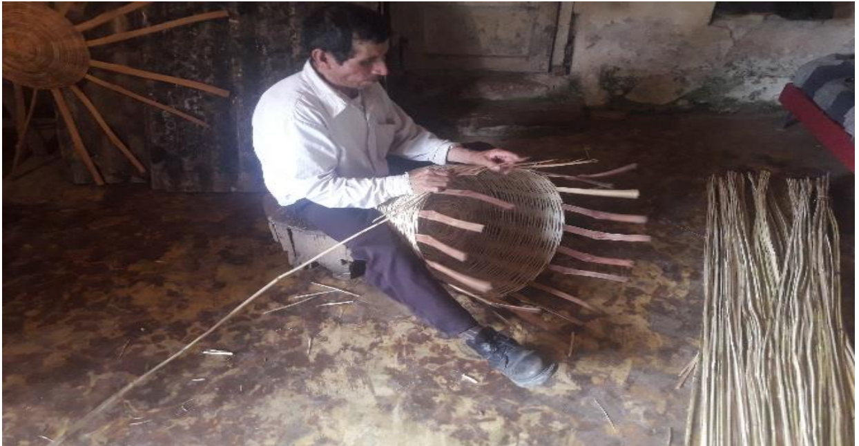
La base de los canastos, costilla y fondo para empezar a tejer las tiras de la caña y darle forma a la canasta.