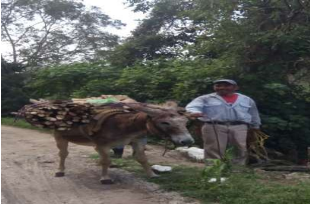
Imagen 6. El Sr. Cesar Xochihua lleva la carga de leña en su burrito. La Ceiba, Papantla.