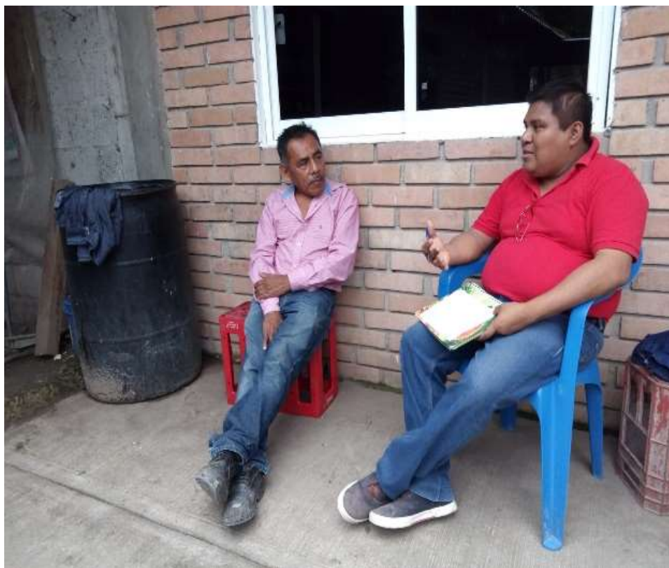
Imagen 9. Entrevista con la Sr. de 78 años de edad, Comunidad La Ceiba, Papantla.