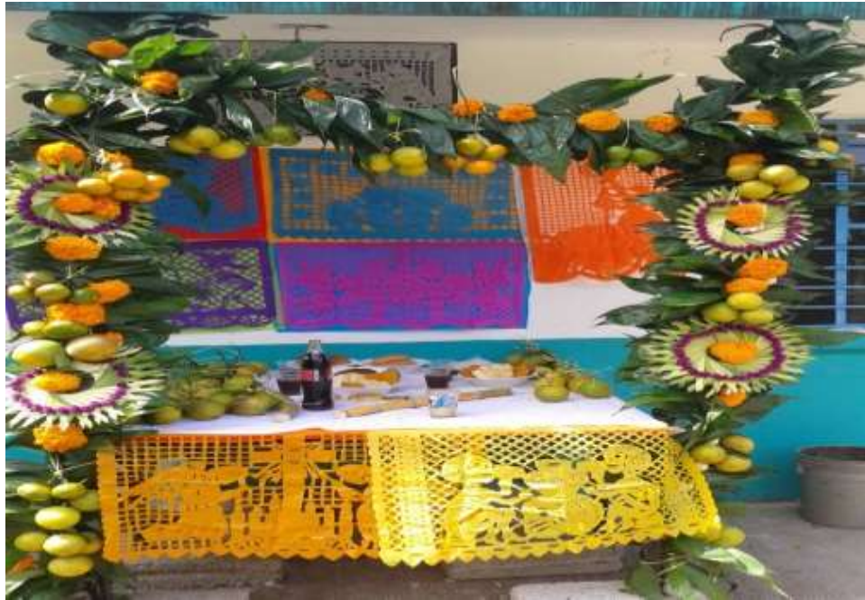
Imagen 12. Presentación final del altar elaborado por alumnos de la Escuela Primaria Indígena Francisco I. Madero.