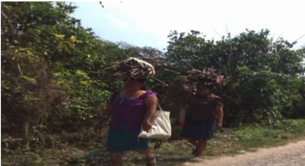
Imagen 8. Las mujeres cargando la leña en la cabeza, La Ceiba, Papantla, Veracruz.