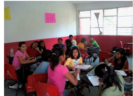
Anexo 5 mayoría niñas

Anexo 6 el sexto grado grupo "B" está integrado por 25 alumnos de los cuales 16 son niñas y 9 niños