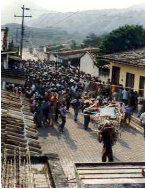
Anexo 2 fiesta titular en honor de San Juan Bautista