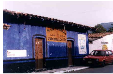
Anexo 1 Museo