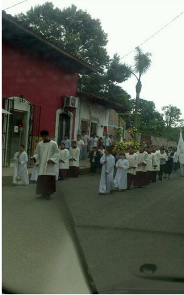
Anexo 7 pasean a la Virgen de Guadalupe por diferentes Parques por Calles y Avenida de Jalcomulco