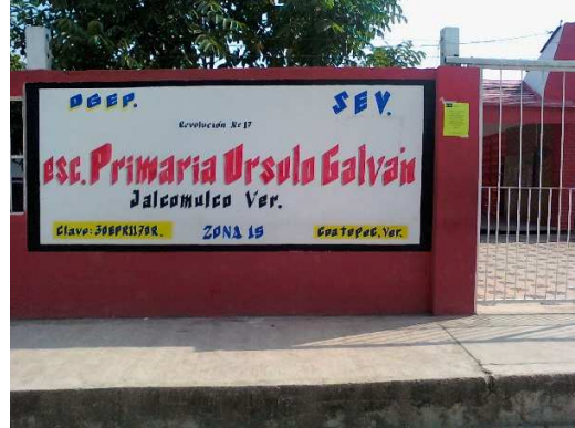
Anexo 3 Escuela Primaria Ursulo Galván se ubica en la Calle Revolución del Municipio de Jalcomulco, Estado de Veracruz

Anexo 4 Escuela tiene para los alumnos una cancha de básquetbol, suficientes áreas verdes y la estructura en general es de concreto