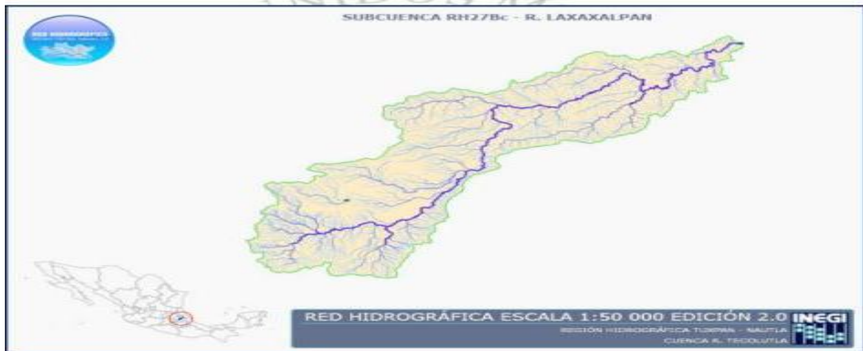
Ilustración 2: Hidrografía río Ajajalpan