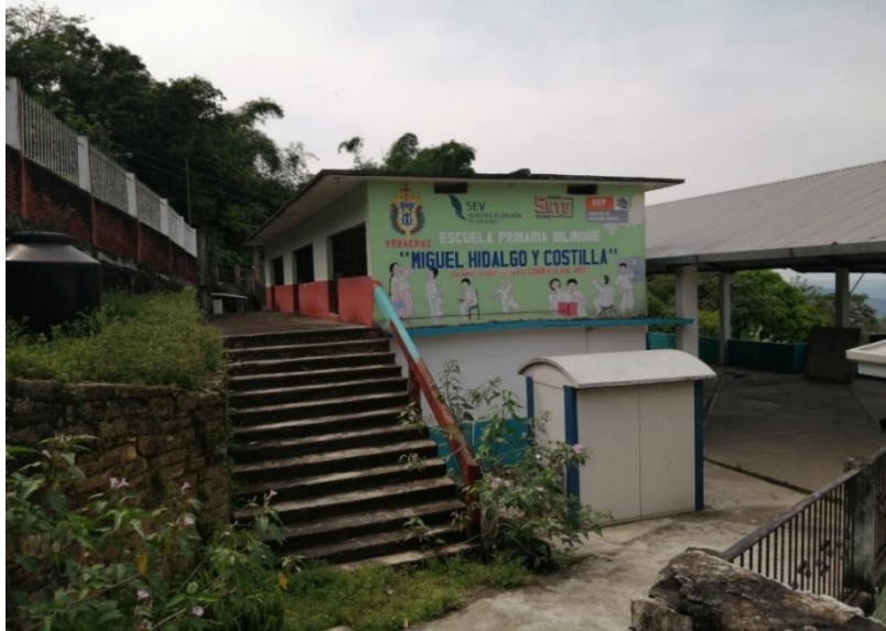
Ilustración 1: Escuela primaria Bilingüe Miguel Hidalgo y Costilla, Chumatlán, Ver.