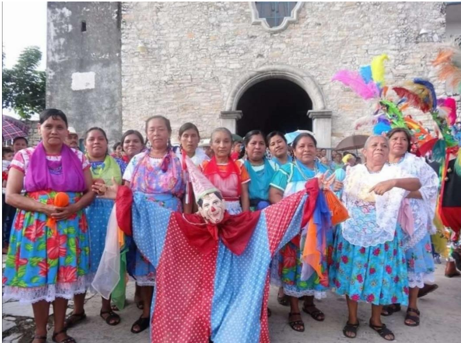
Ilustración 1: Traje típico en Chumatlán, Ver.