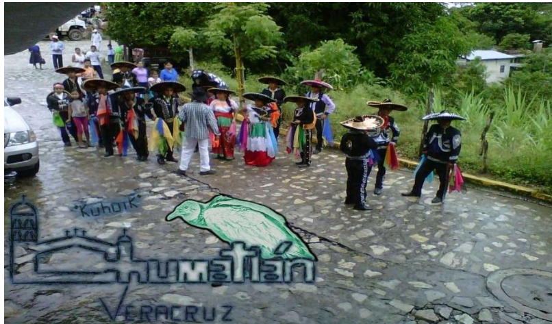
Ilustración 2: Danza de los toreadores, Chumatlán, Ver.