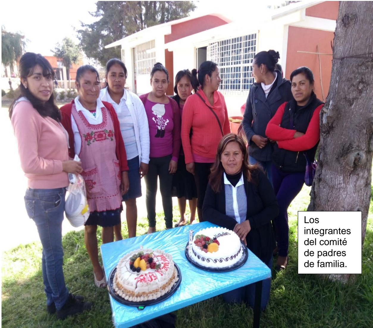
Los integrantes del comité de padres de familia.