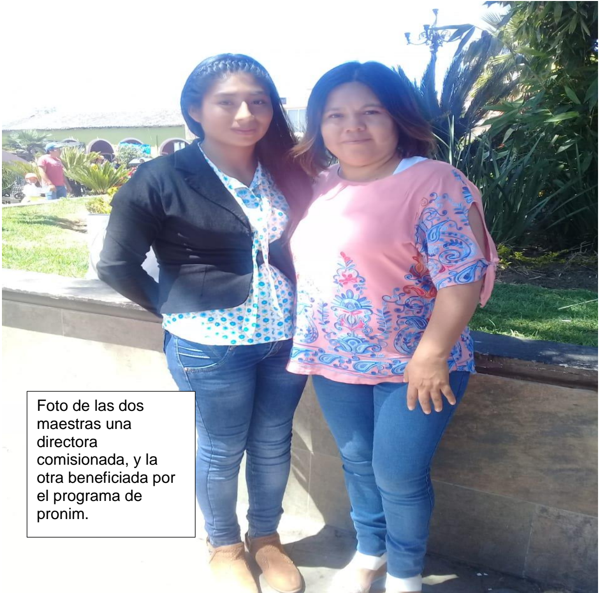
Foto de las dos maestras una directora comisionada, y la otra beneficiada por el programa de pronim.