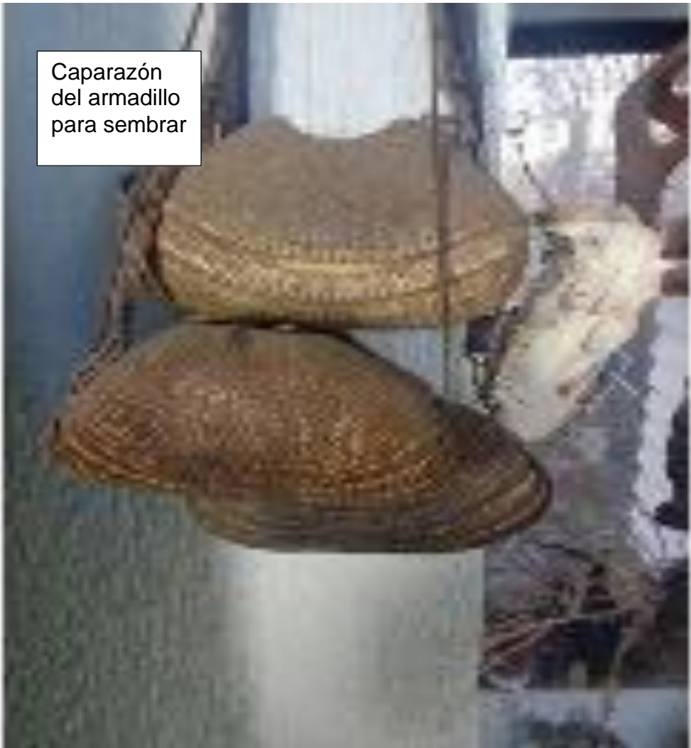
Caparazón del armadillo para sembrar