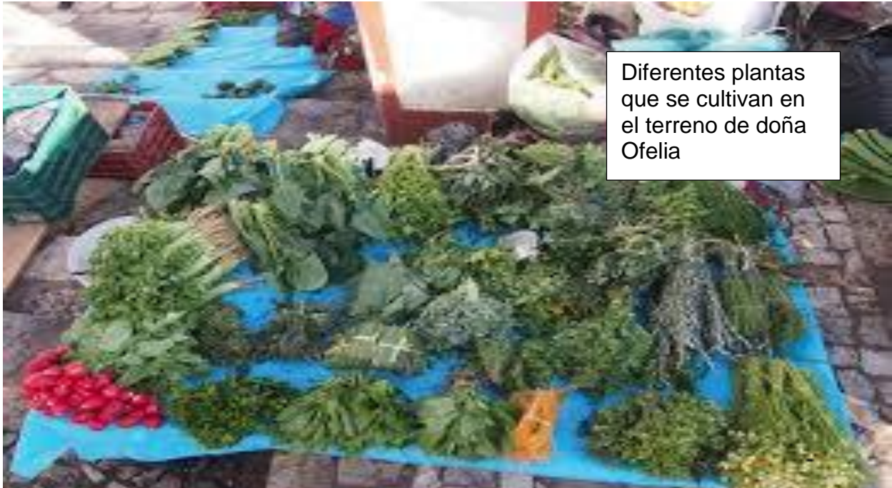
Diferentes plantas que se cultivan en el terreno de doña Ofelia