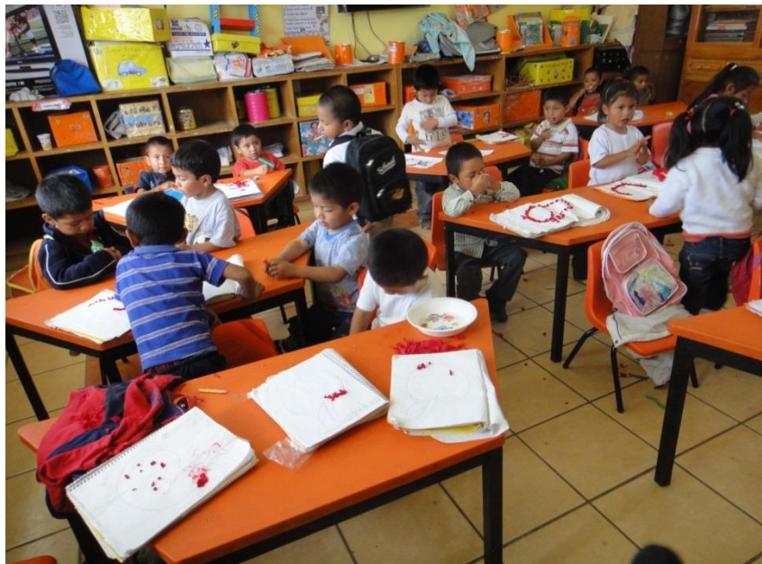
La Maestra Con Los Niños