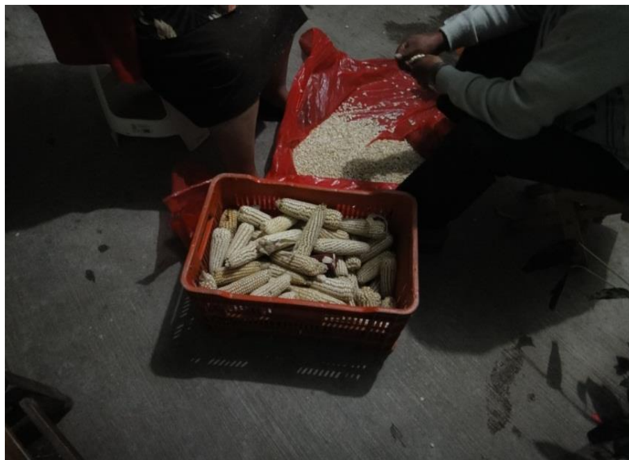
Selección De La Semilla