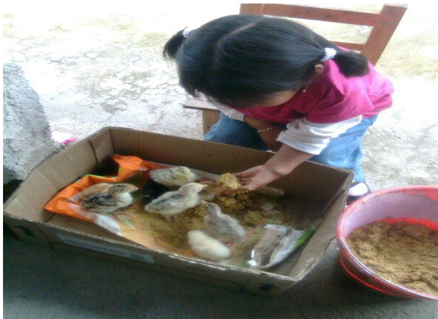
La Alimentación De Los Totolitos