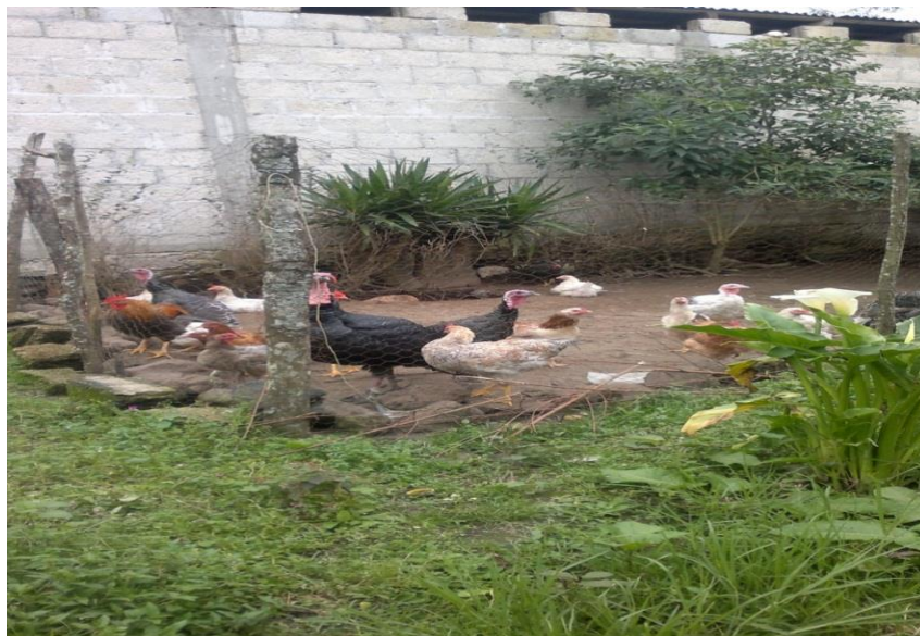
Guajolotes Y Pollos Ya En El Corral