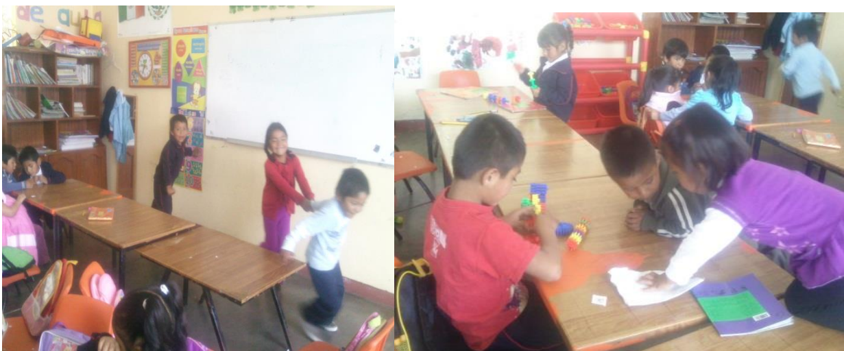
Anexo 19.- Los alumnos tienen dificultad en conteo oral cuando realizan las actividades