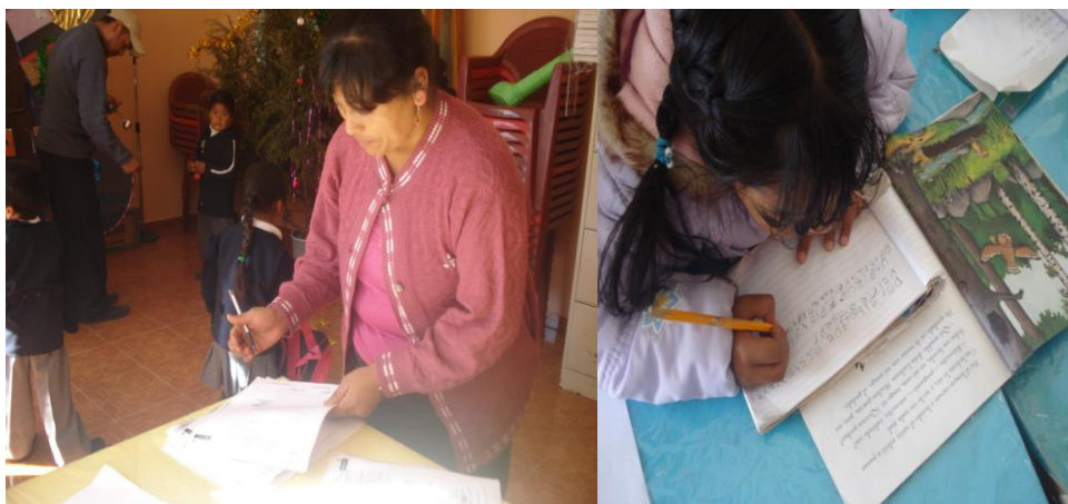
Anexo 16.- Algunos pequeños, que no se integran a las actividades