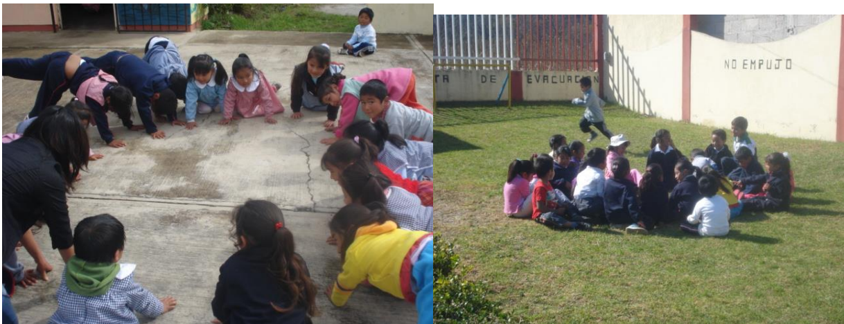
Anexo 18.- Los niños mas agresivos del salon de clases