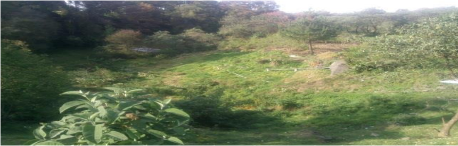
Anexo 2.- Centro Comunitario de Aprendizaje y Clínica de la Comunidad