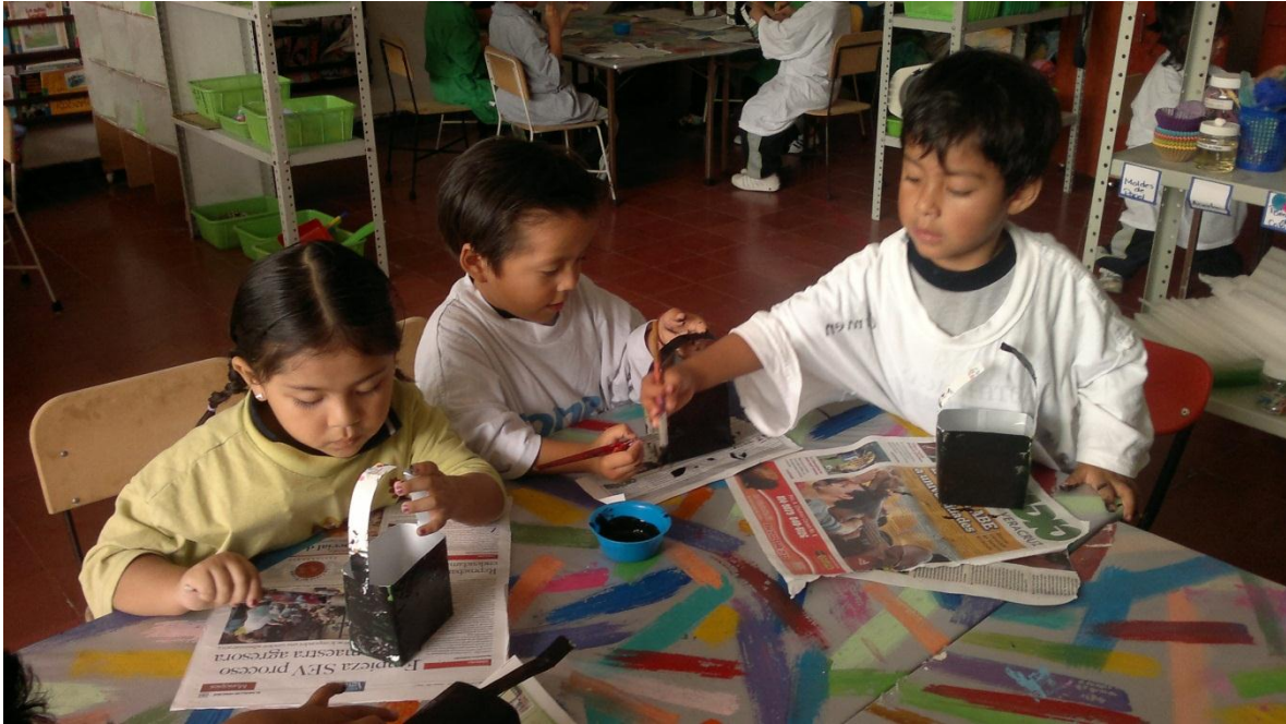
Fotografía 13 y 14 “Realización de canastitas”