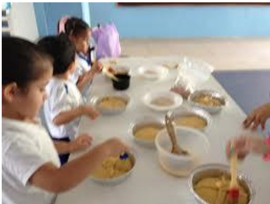
Fotografía No. 17 “Elaboracion de pan de muerto con los niños de preescolar”