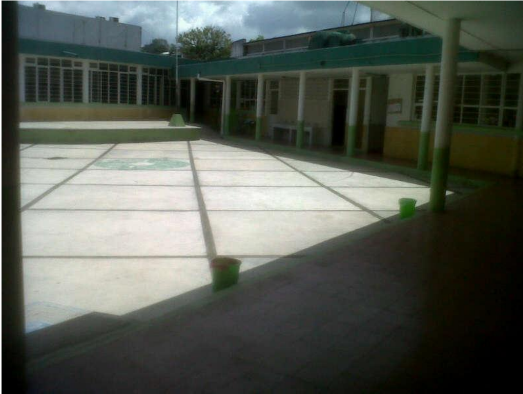
Fotografia 3 y 4 - El jardin de niños “Maria Montessori”