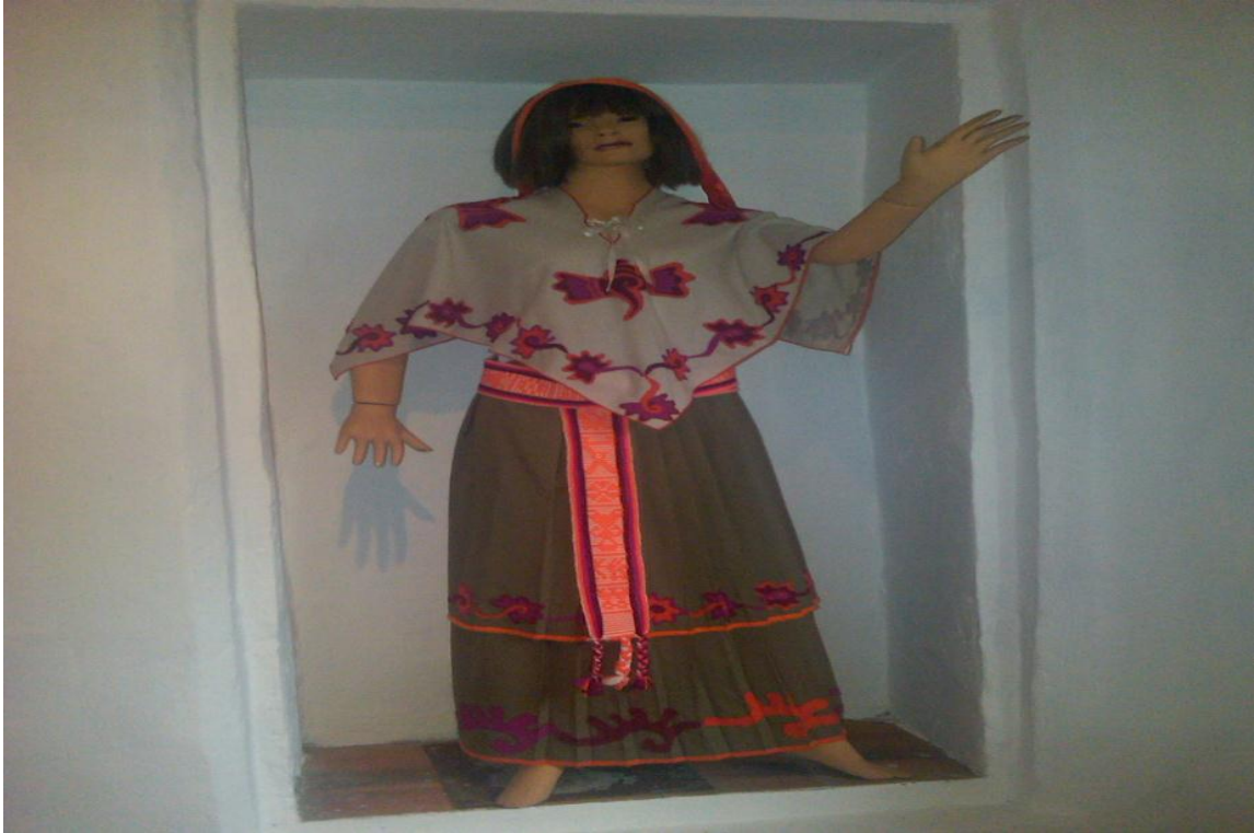
Fotografía No 2 Traje regional de Xalapa

El traje típico que se usaba en Xalapa era correspondiente a la zona centro regional de las grandes montañas. Se compone de Quexquemet de una pieza con cuello de ojal color crudo con grecas en forma de caracoles en el torno al frente, atrás y en los hombros doble falda tableada al frente, atrás y en los hombros; al frente adornada con grecas de caracoles, en las primeras líneas medianas y en las segundas grandes en colores magenta y naranja. Debajo lleva un fondo de popelina con cuello en forma de “V” adornado con encaje; ceñidor con lana con grecas de color, rojo, blanco y negro. Se peina con trenza lateral larga tejida con una cinta muy larga y angosta color magenta y blanco. Adorna su cabeza con flores de azaleas, usa aretes y collares de oro, calza zapatilla de tacón.