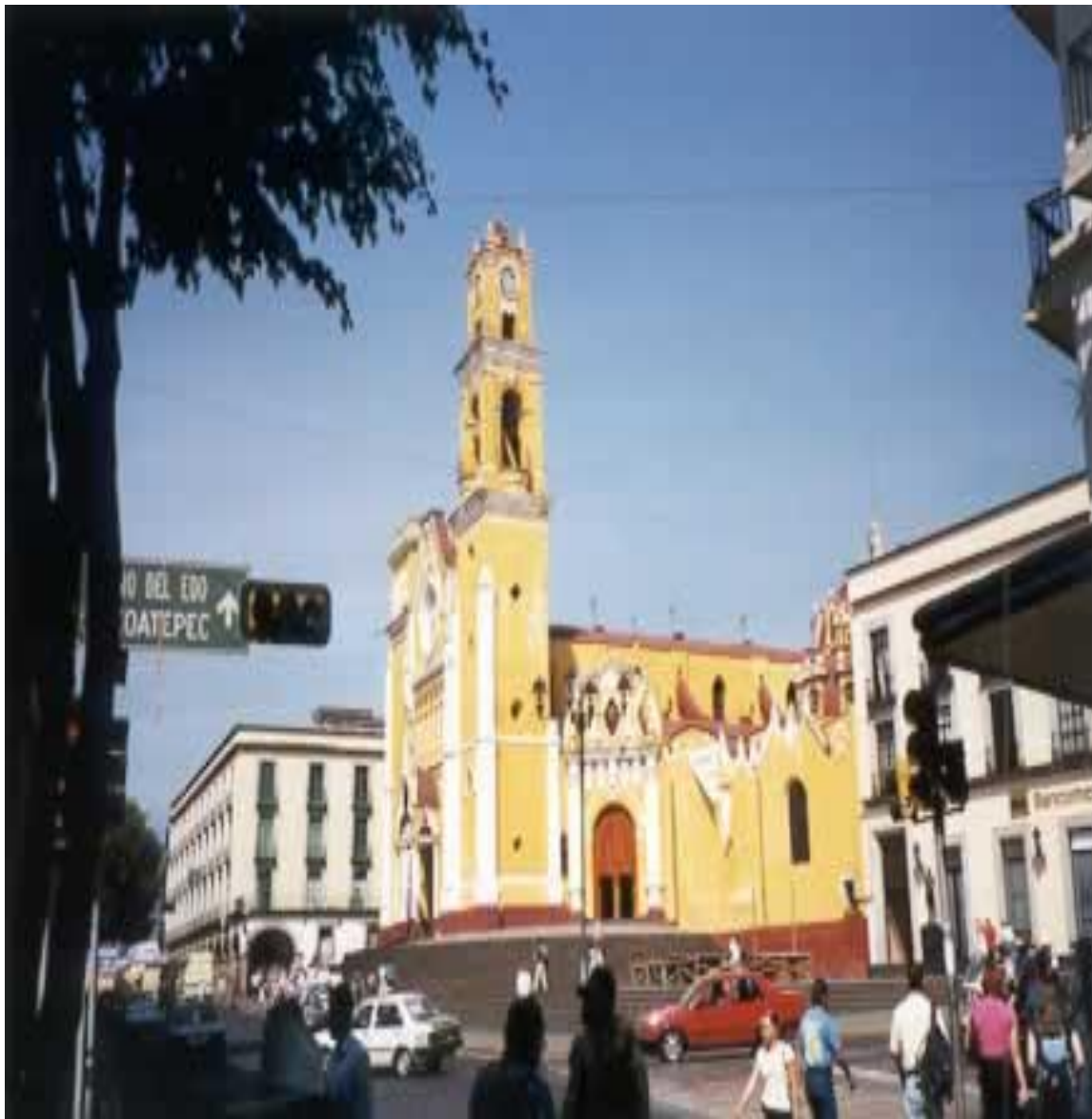
Fotografía No 1 - Catedral metropolitana de Xalapa