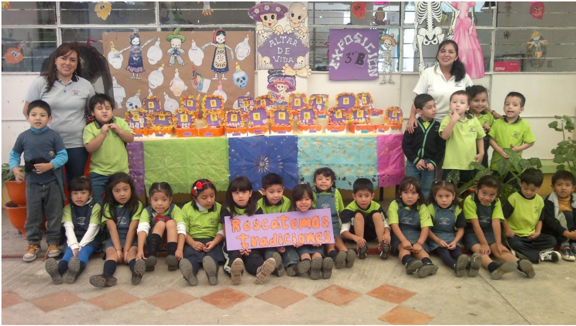
Fotografía 15 “Exposición de minialtares de muertos”