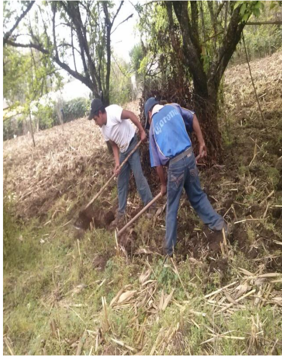
Anexo 6. Barbecho de las tierras por medio del azadón.