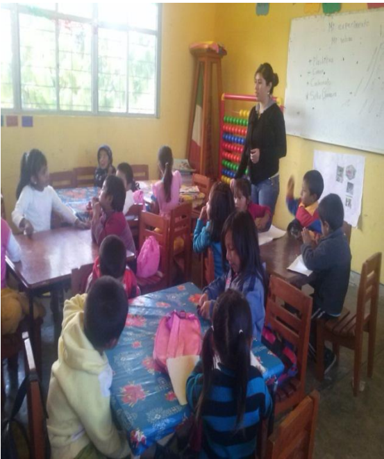
Anexo 7. Foto del grupo que está atendiendo.