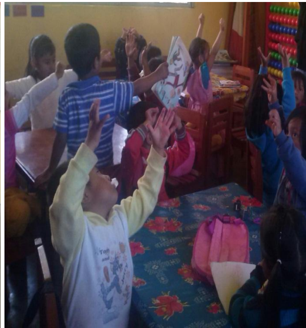
Anexo 8. Foto de como los niños no respetan reglas, no esperan su turno para opinar.