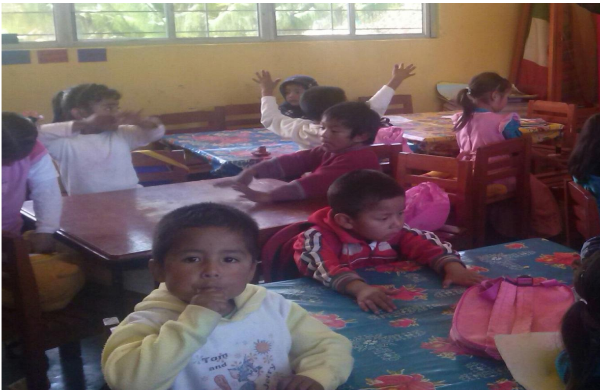
Anexo 10. Alumnos que confunden los números por grafías en la escritura.