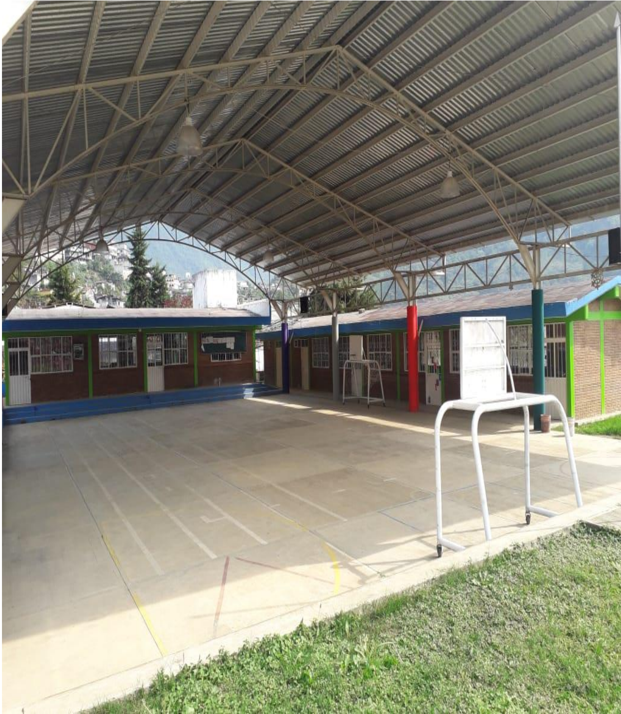
Escuela Cri- Cri