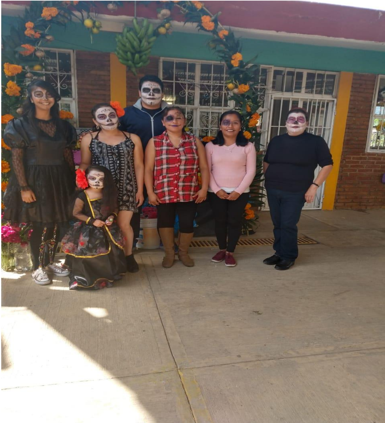
Participación de las maestras en las actividades de ofrenda.