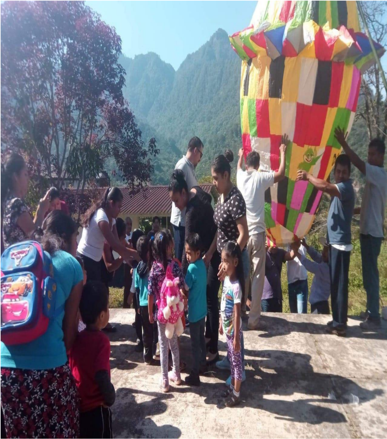
Concurso de globos preescolar.