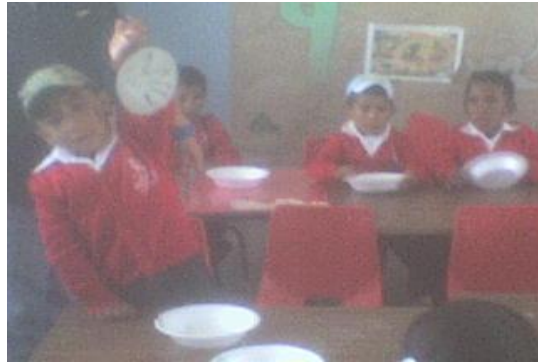
Las actividades dentro del aula