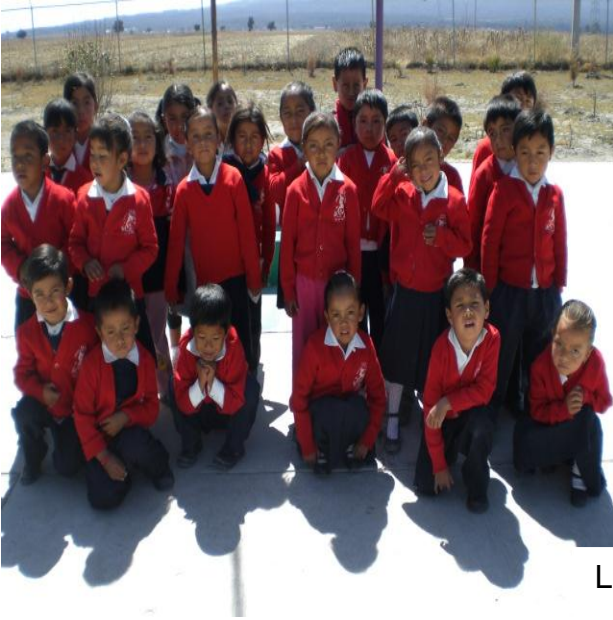
Grado 1º Grupo "A"