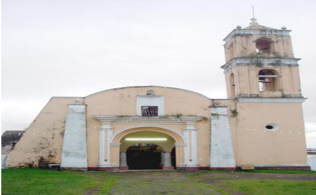
San Antonio Tlanelhuayocan, Ver.,