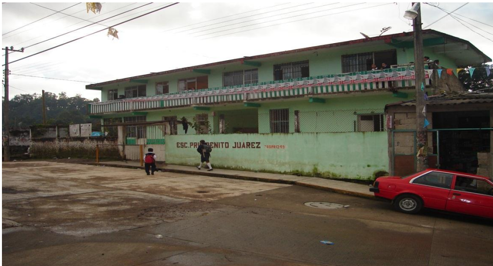
Esta imagen muestra la parte de enfrente de la escuela primaria "Benito Juárez García" en la comunidad de San Antonio Tlanelhuayocan, Veracruz.