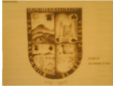
Escudo de armas de la comunidad de San Salvador el Seco Puebla