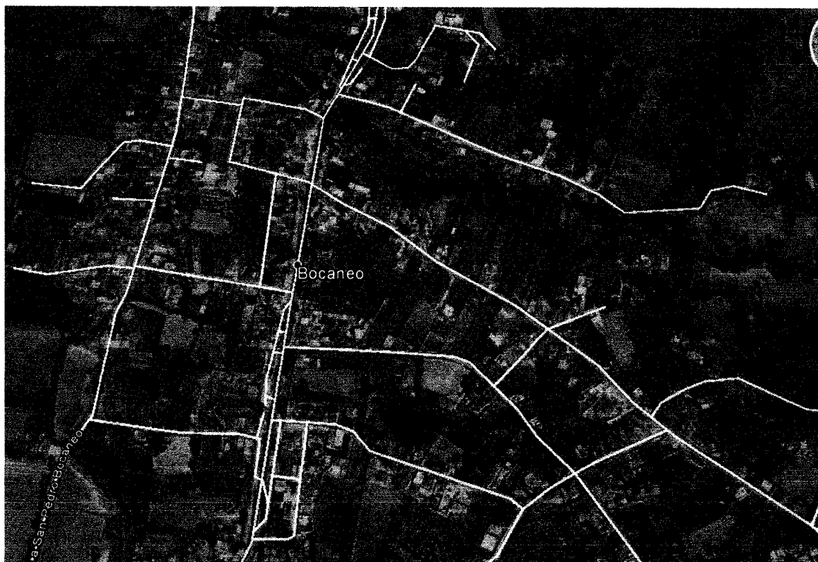
Imagen 1 croquis de la comunidad