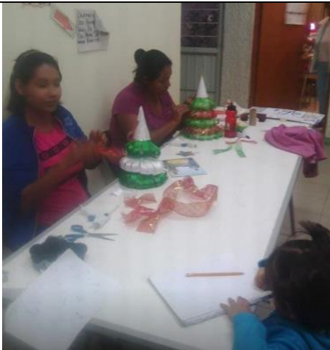
Elaboración de Manualidades