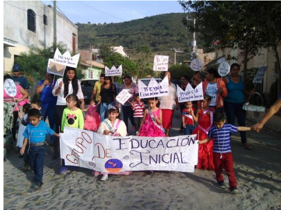
Desfile de difusión