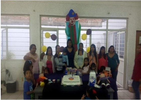
Festejo de Clausura