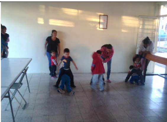
Sesión de control y equilibrio