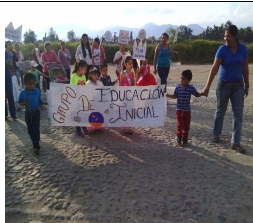
Desfile de difusión