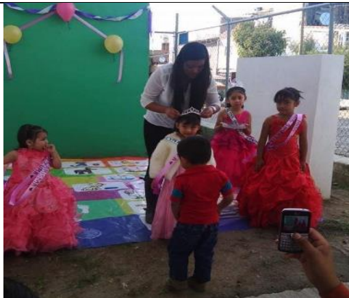
Coronación de reina inicial