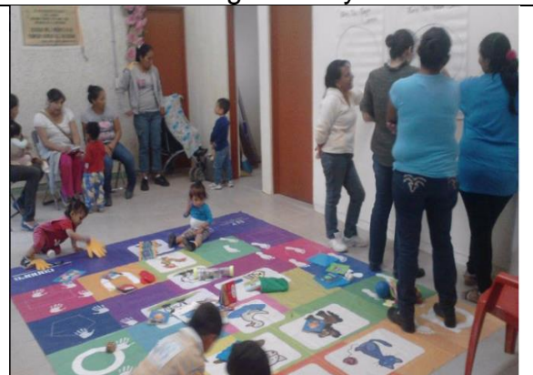
Sesión de salud y alimentación