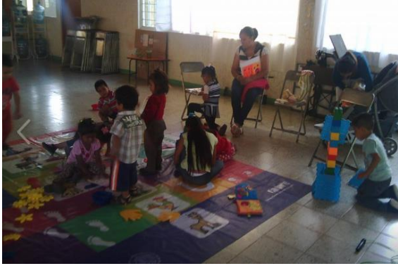
Sesión de Interaccion con otros