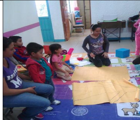
Sesión de identidad y autoestima