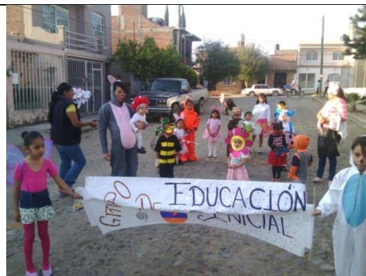
Desfile de difusión