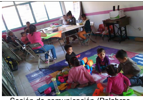
Sesión de comunicación (Palabras, oraciones y numeros)