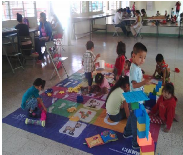
Clase de Autorregulación y autonomía