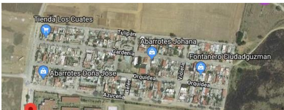
Figura 2. Croquis de la colonia san José