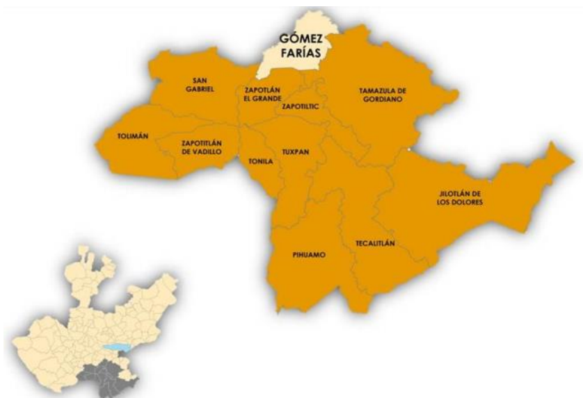
Figura 1. Localización geográfica, Gómez Farías, Jalisco