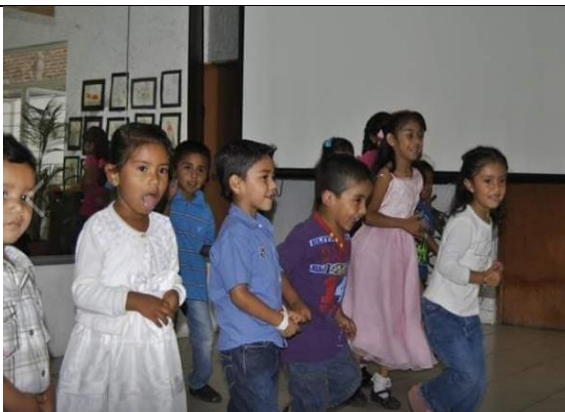
Sesión de Interacción y Autoestima