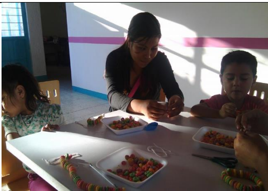
Sesión de categorizacion