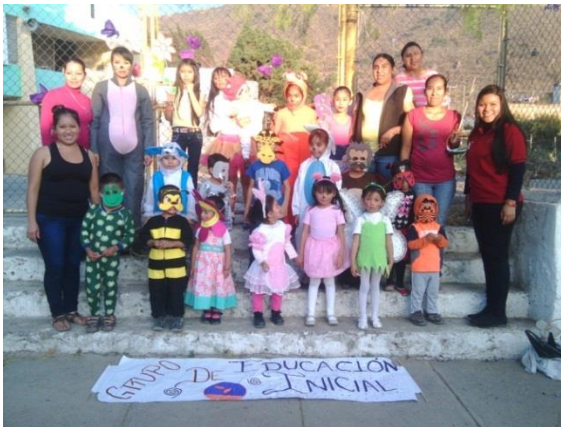
Desfile de Primavera