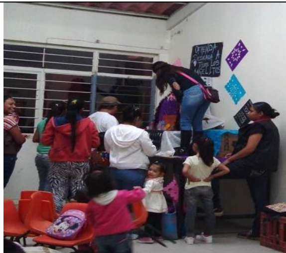
Elaboración de Ofrenda a angelitos