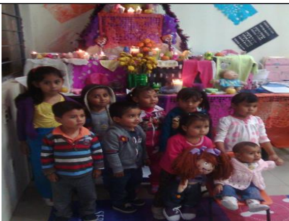
Ofrenda a los angelitos