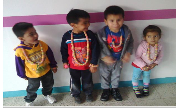
Sesion de manipulacion de objetos