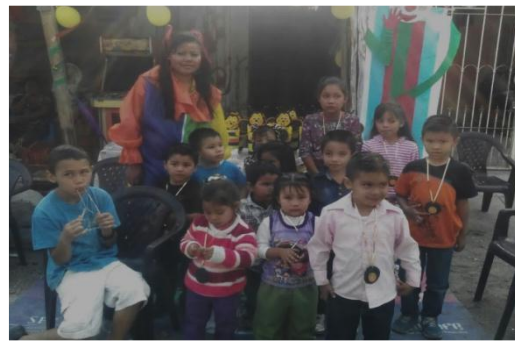
Festejo del día del Niño