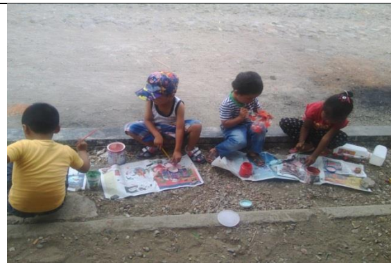
Comunicación grafica plastica