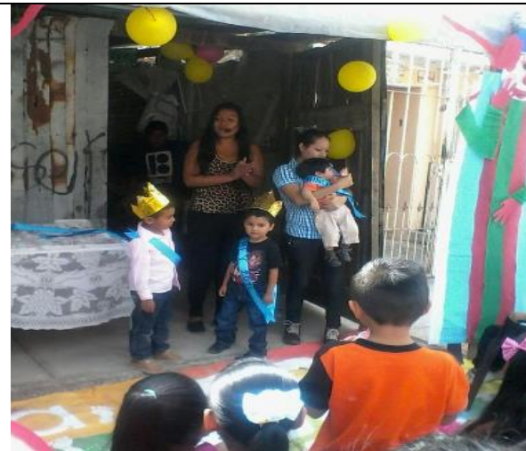
Coronación de Rey Inicial