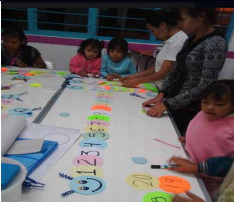
Sesión de categorizacion