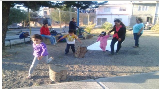
Sesión de control y equilibrio