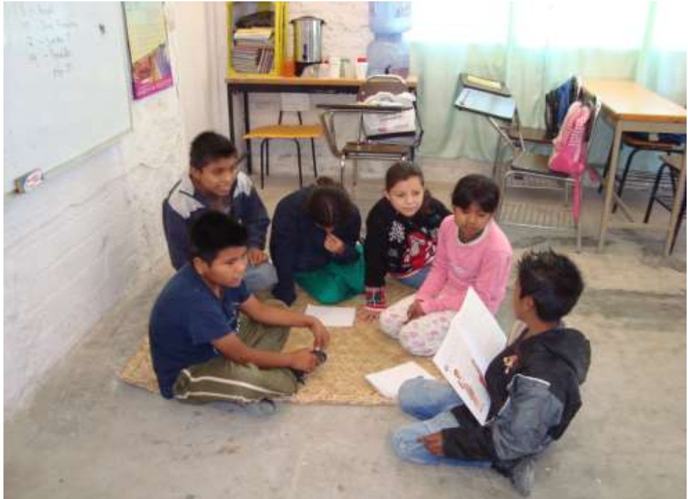
Los alumnos trabajando en equipo compartiendo sus registros de lo observado