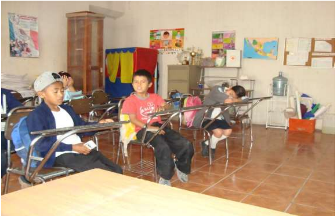
Manifestaciones de aburrimiento de algunos alumnos

Los alumnos llegan con sueño, o desgano a la escuela.