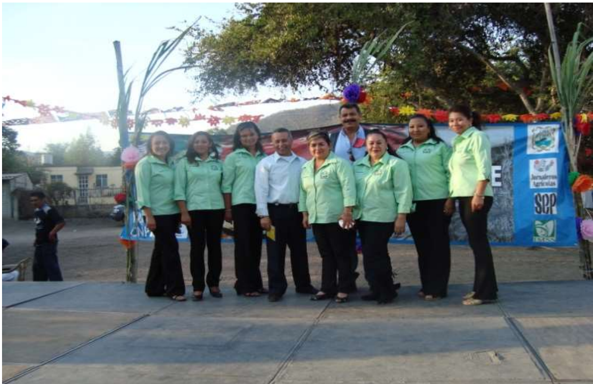
Equipo Docente del Colegio Albergue de la Exhacienda y del Albergue de Soyatlán de Afuera