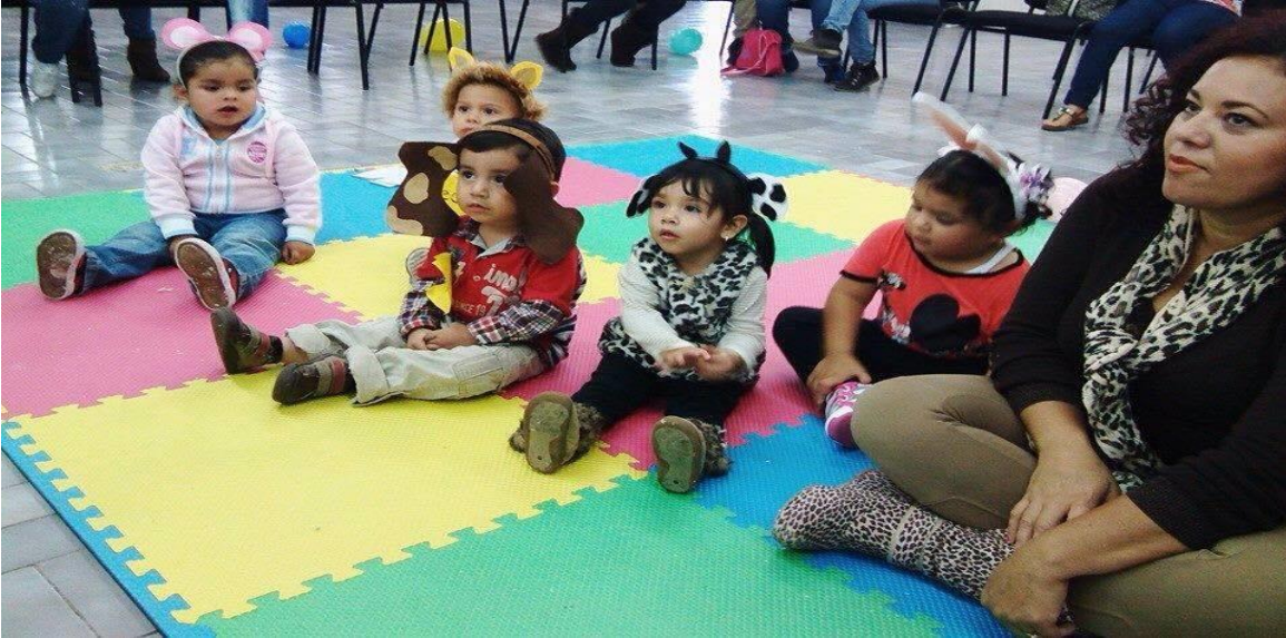
Niños del taller del Taller de Estimulación Temprana