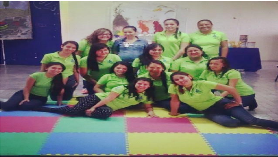
Grupo de educación inicial al finalizar el taller, con una de las participantes y compañera de grupo.