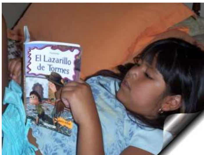
Figura 14: El placer por la lectura

Por las mañanas, llegaba muy temprano a la escuela, a las 7:30 a.m., y se tiraba en la alfombra para leer o se salía a las escalinatas del pasillo, su mamá me comentaba que lo veía cargar su libro fuera de la mochila porque le decía que iba a leer llegando a la escuela. Cabe mencionar que su lectura al ingresar a cuarto grado era muy lenta y torpe, sin embargo, ahora aunque lee un poco lento, sobre todo lo hace con más seguridad. Todo es cuestión de darle tiempo a todo y no alterar los procesos naturales de los niños ya que lo único que se logra es entorpecer su crecimiento, permitiéndole al niño disfrutar de la lectura en el lugar preferido, como lo muestra la figura 6. Para esto, hemos de coordinarnos con el consejo técnico escolar y principalmente con los padres de familia para que apoyen el proceso de sus hijos, sobre todo informar de las actitudes que ayudan y perjudican a los niños.