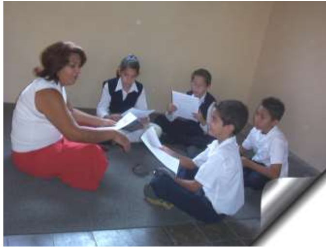
Figura 7: El mito de Aracne

Aracne era una de las mejores tejedoras de toda Grecia, sus bordados eran tan maravillosos que la gente comentaba que sus habilidades le habían sido concedidas por Atenea, diosa de la sabiduría y patrona de los artesanos. Pero Aracne tenía un gran defecto, era una muchacha muy vanidosa y decía, continuamente, que ella era la mejor tejedora del mundo.