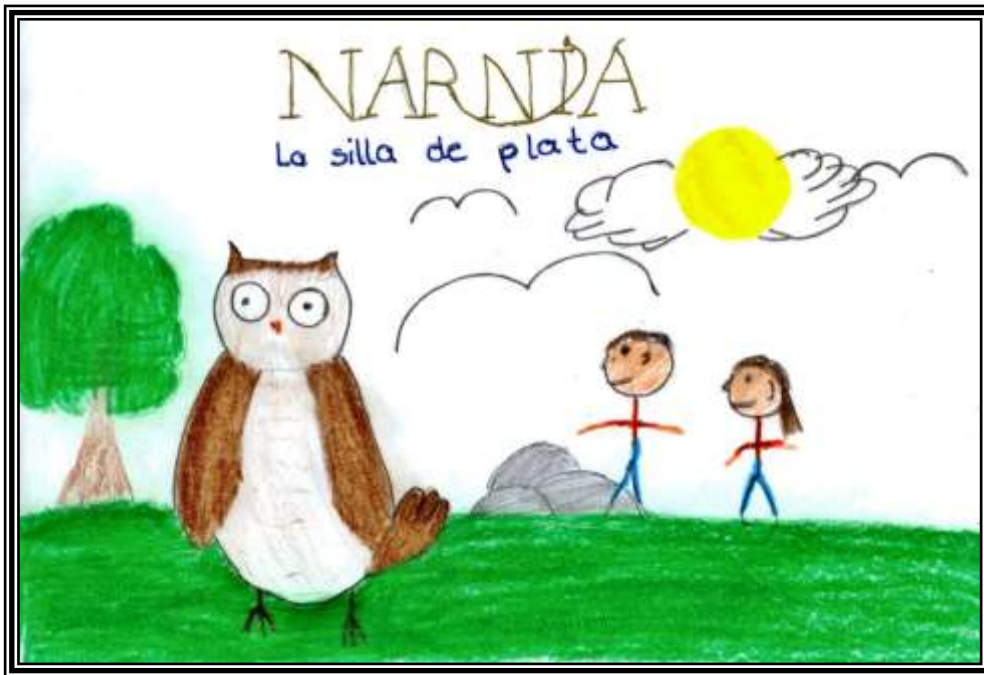
Figura 9: La silla de plata