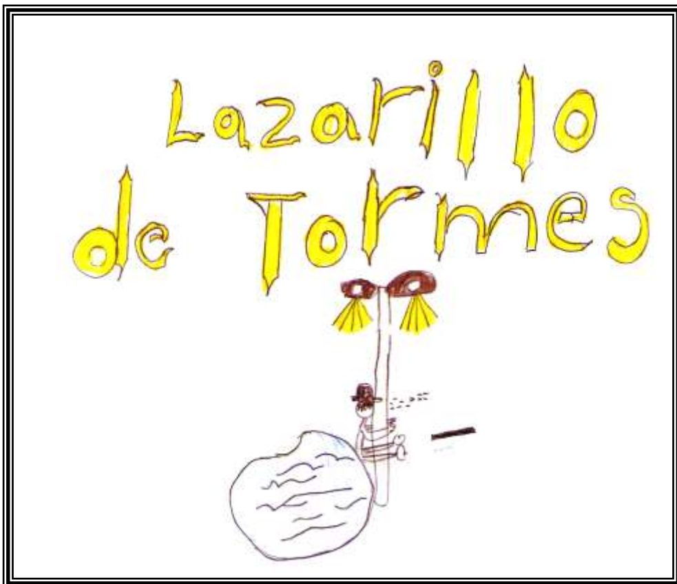
Figura 5: Escuchemos un cuento