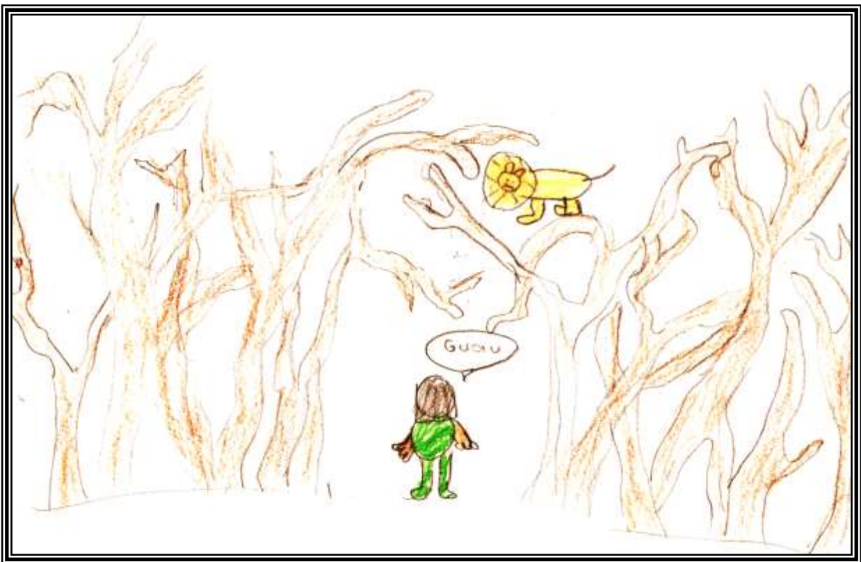
Figura 8: Príncipe Caspian

Al final, el príncipe Caspian logra ser ayudado por los hermanitos y acabar con el malvado rey Thelmar que quería terminar con la fantasía de Narnia. También les ayuda Aslan, a él no lo habían visto desde hace mucho, y cuando lo encuentran, les ayuda para acabar con el rey malo.