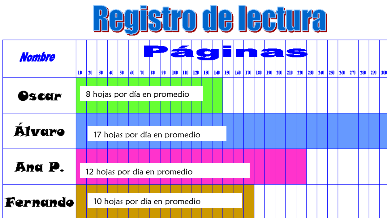
Figura 10: Registro de lectura

Para que el gusto por la lectura sea más efectivo, es necesario mantener el interés de los niños en la lectura y que no haya presión alguna para su realización, esto implicó interesarme verdaderamente en los libros que los niños eligieron para la actividad final. No resultó tan difícil, en primer lugar por ser un grupo tan reducido, y otra por que todos escogieron su libro de la colección 'Las crónicas de Narnia'. Para que cada uno fuera viendo sus avances en relación a sus demás compañeros, realicé una tabla (cómo se muestra a continuación), con la finalidad de que los niños observarían sus avances al ir coloreando las barras de lectura. Si un niño leía en casa 5 páginas, desprendía la hoja de registro de lectura del pizarrón, platicaba a sus compañeros lo leído y entonces coloreaba su avance en la hoja de registro de lectura.