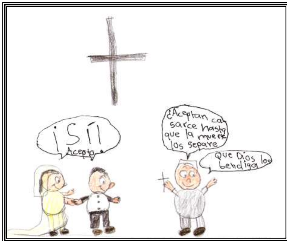
Figura 6: La boda