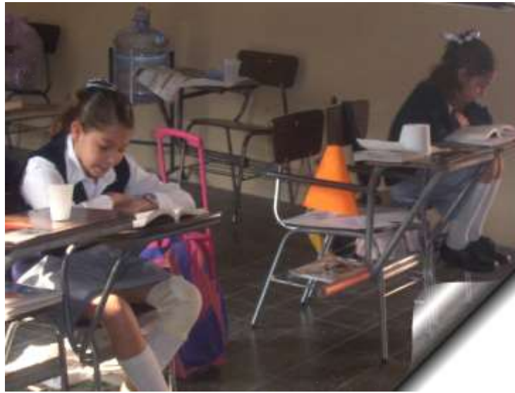
Figura15: Tiempo de leer.

Sin duda todos somos únicos e irrepetibles, así que cada profesor dará sin duda, su particular forma de aplicar esta propuesta ya que nada es definitivo, y todo dependerá de la creatividad e iniciativa de cada uno.