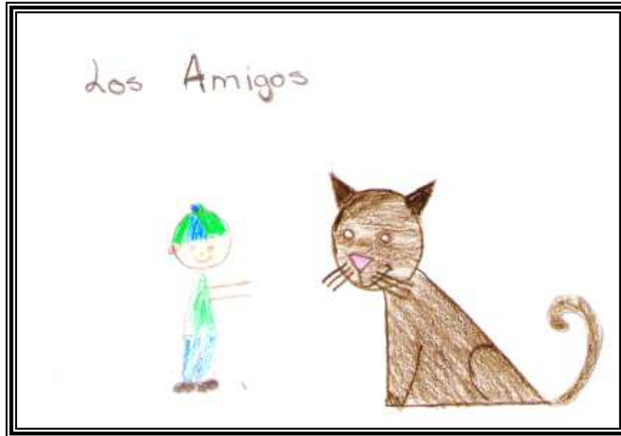
Figura 4: Los amigos

H abía una vez, en un lugar de la selva, un niño que se hizo amigo de una pantera. Un día el niño se fue de la selva y la pantera se quedó sola. Los dos se extrañaban pero el niño ya no podía regresar porque se había ido a la ciudad y ya no sabía cómo regresar y la pantera tampoco sabía dónde estaba el niño.