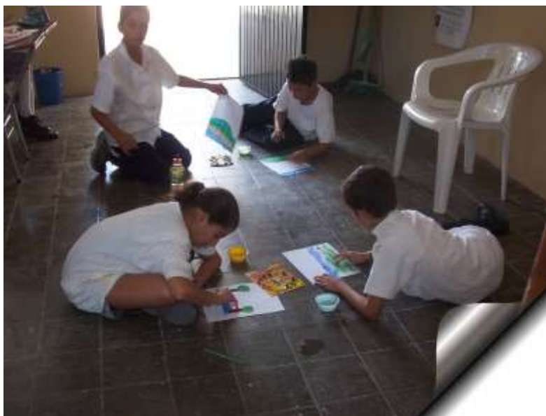
Figura 12: Dibujando las aventuras de Lazarillo de Tormes.

Sin dejar de aprovechar el interés que mostraban, les sugerí que dentro de la lista que se encuentra al final del libro, escogieran el que más llamara su atención para conseguirlo, y que lo leyeran. Cada uno escogió el título del libro que querían, y se les consiguió, teniendo la siguiente respuesta: