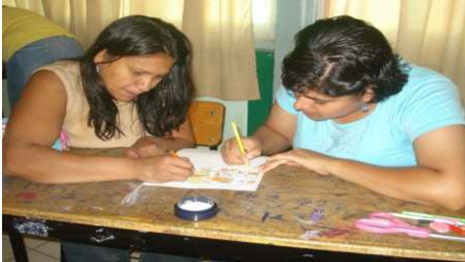
Los padres buscando la relación entre la familia y la escuela.