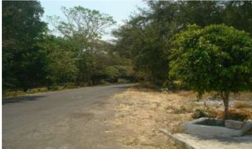
Tipo de vegetación y clima de la comunidad

Con un intendente, dos maestros de Educación Física con diferentes horas cada uno, en diferentes días de la semana. Su extensión es grande, cuenta con cancha de básquet bol, Vol.-bol, jardineras, algunos árboles de aguacate, guayabos y guayabillas; cuenta con un desayunador techado donde se dan los desayunos escolares por la mañana, su ubicación es envidiable ya que se encuentra en el mero centro de la comunidad rodeada por el jardín, la iglesia y el centro de salud, por lo que su ambiente es muy agradable gracias a la muy buena relación que llevamos todos los compañeros que laboramos en ella.