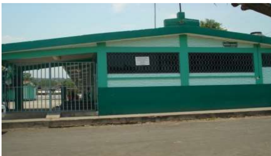
Escuela: primaria Lázaro Cárdenas

La cultura de la élite esta tan cerca de la escuela que los niños de la clase media - baja pueden adquirir, pero solo mediante un gran esfuerzo, algo que le está dado a los niños de las clases cultas (estilo, gusto, ingenio). Entre los niños menos privilegiados la influencia del medio familiar y el medio social en general, que atienden a desilusionar ambiciones vistas como excesivas y siempre algo sospechosas que sugieren un rechazo de los orígenes sociales del individuo.