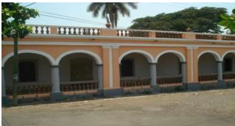
Ex hacienda de Chiapa