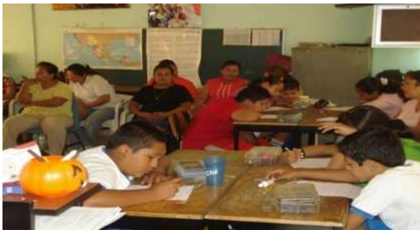
El trabajo de los niños ante sus padres.

Vamos a dar inicio mencionándolos que esta sesión era muy importantes. El tema de la sesión era “Familia y Escuela”. El propósito era reflexionar la vinculación de la escuela. Y la escuela en el esfuerzo conjunto que tiene para una mejor calidad de educación y formación integral de los alumnos.