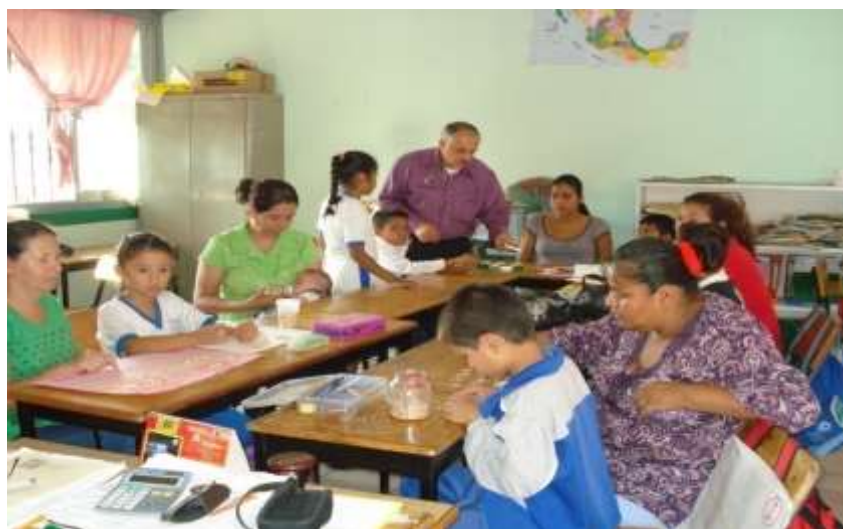
Trabajo con padres y alumnos dentro del salón.