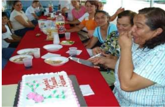
Día de las madres

Todo lo que he venido mencionando entorno a mi problema y lo considero significativo, por no existir disposición o apoyo de los padres, se lograría un mejor aprendizaje en bien de sus hijos, notándose en todas las reuniones de padres que he tenido son contados los padres que asisten, siempre son los mismos, sobresaliendo entre los que asisten las madres de familia. Mencionándoles a todos los presentes que es muy necesario que conozcan que la educación de sus hijos requiere de la participación y colaboración de ellos.