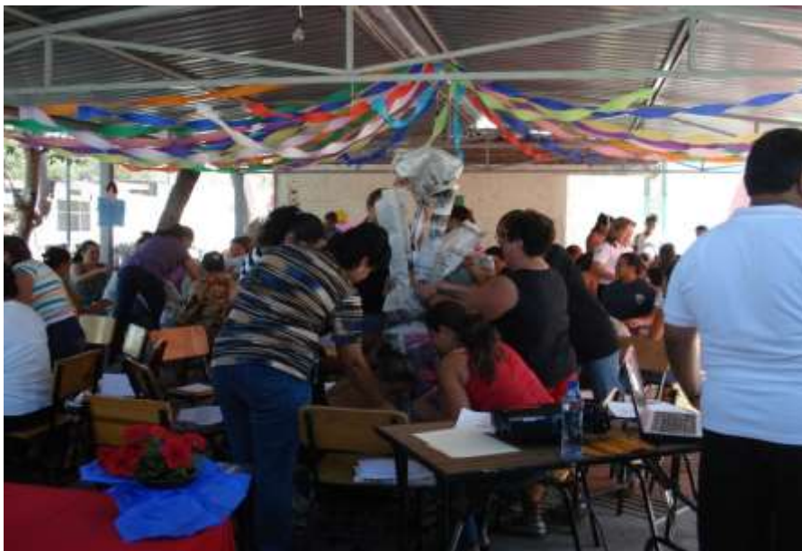
Actividades que los padres realizan. Para entender a sus hijos.