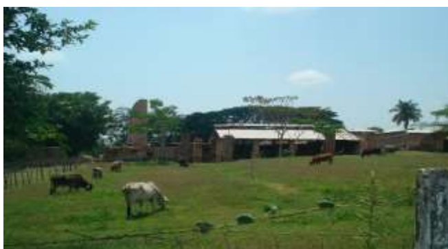
Aspecto físico de la comunidad.

Se admira al transitar por sus caminos saca cosechas las continuas lomas, cerros, con sus pastizales, con frondosos árboles formando estos fabulosos paisajes con sus sombras dignos de apreciarse, donde la misma naturaleza nos obliga hacer paseos recreativos y estos todavía más por el clima que se tiene, ya que si miramos a lo alto descubrimos hermosas montañas con una enorme vegetación. Además de este atractivo ecológico podemos escuchar los cantos de los cenizales, cardenales, mirlas, chachalacas, jilgueros y si somos observadores en los parejos lomas y montañas podemos ver las codornices, güilotas, palomas, torcazas, águila, queleles, gavilanes, tecolotes, corre caminos, grullas, zopilotes, gaviotas, chuparrosas, bobos, guitarritas, pericos, cotorras, golondrinas, calandrias.