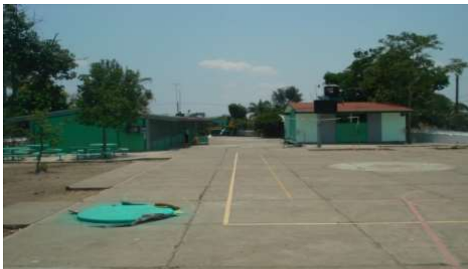
Área de la escuela

Con un intendente, dos maestros de Educación Física con diferentes horas cada uno, en diferentes días de la semana. Su extensión es grande, cuenta con cancha de básquet bol, Vol.-bol, jardineras, algunos árboles de aguacate, guayabos y guayabillas; cuenta con un desayunador techado donde se dan los desayunos escolares por la mañana, su ubicación es envidiable ya que se encuentra en el mero centro de la comunidad rodeada por el jardín, la iglesia y el centro de salud, por lo que su ambiente es muy agradable gracias a la muy buena relación que llevamos todos los compañeros que laboramos en ella.