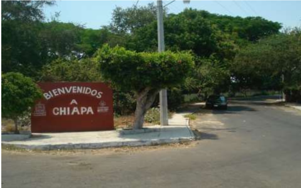
Entrada a la comunidad

tortilla y quesos es una población con problemas en cuanto a su cultura ya que en su mayoría es gente que ha tenido como egreso la primaria y otros que no la terminaron por irse de braceros a los Estados Unidos de Norte América ya que también producen enviando remesas en dólares en su mayoría la gente trabaja en el campo y algunos acuden a trabajar y a seguir sus estudios a la capital que es Colima y Cuauhtémoc que es su municipio.