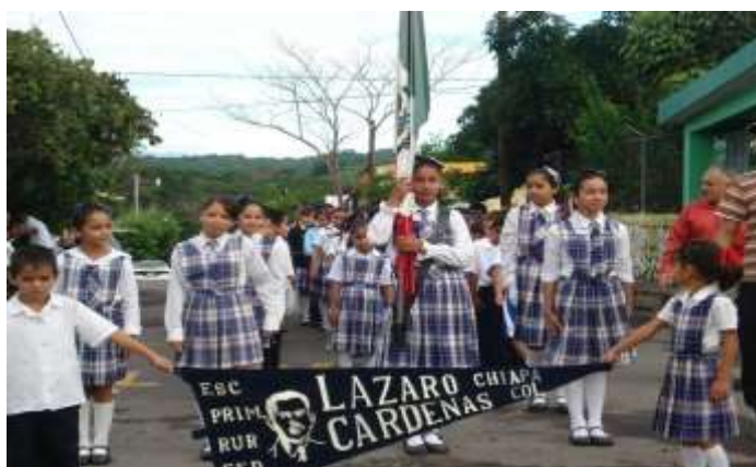
Desfile conmemorativo del 16 de Septiembre

En la siguiente imagen se muestra un panorama de lo que acontece a uno de los días festivos de la comunidad.