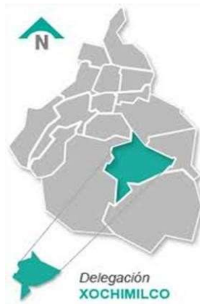
Mapa de la Alcaldía de Xochimilco en la Ciudad de México

De tal manera que la investigación se llevará a cabo dentro de esta demarcación en el Pueblo de Santa Cruz Acalpixca en la Colonia Ahualapa donde se realizará este trabajo de investigación.