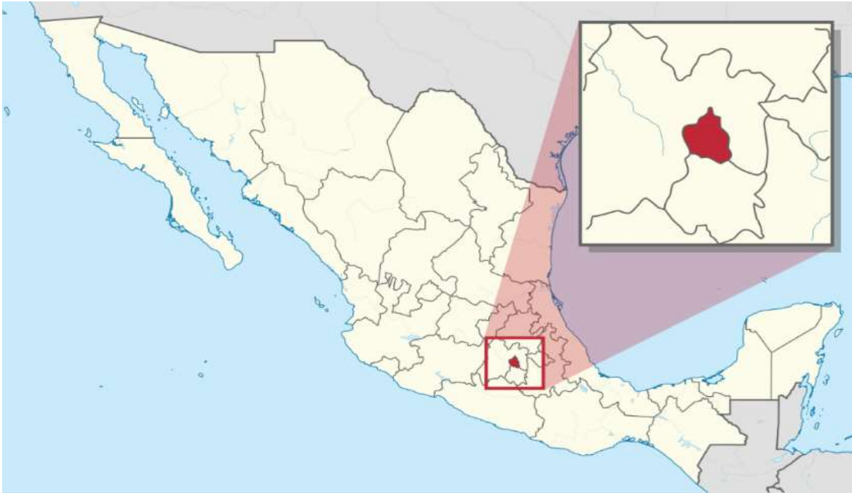
Imagen. - República Mexicana 1

Tláhuac es una de las 16 Alcaldías de la Ciudad de México. Su término comprende más de 83 Km 2 y se localiza en el Sureste de la Capital Mexicana, enmarcado por la Sierra de Santa Catarina al Norte y el Teuhtli al Sur. El Centro corresponde a los vasos lacustres de Xochimilco y Chalco. De estos lagos se conservan sólo los canales de la zona chinampera y los humedales. En Tláhuac existen siete Pueblos originarios.