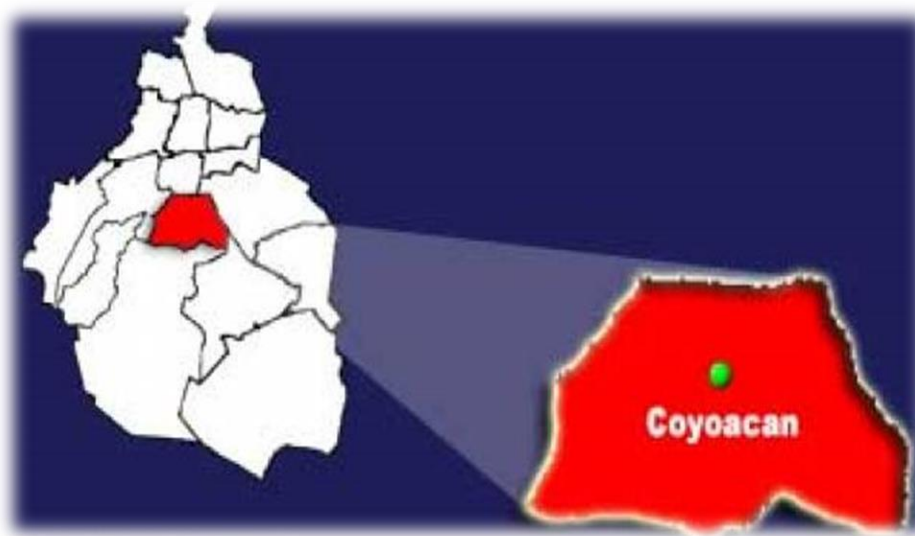
Mapa de la Alcaldía Coyoacán 2