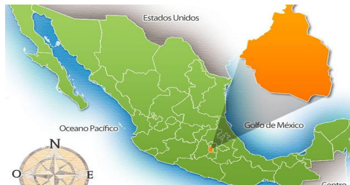
Mapa de la República Mexicana 1