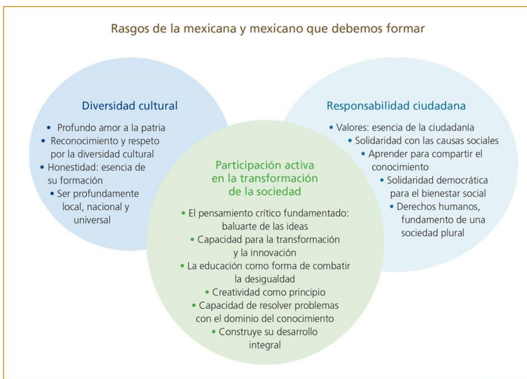
Imagen. - Rasgos de mexicana y el mexicano que debemos formar

Es necesario reconocer el esfuerzo de las autoridades para responder a las necesidades contextuales del país y del mundo global donde se destaca que los cambios sociales cada vez son más rápidos y con mayores exigencias para integrarse a la movilidad global.