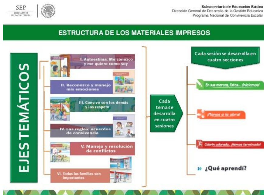
Imagen. -Ejes temáticos PNCE 51

Como muestra la imagen anterior los ejes formativos planteados en el PNCE