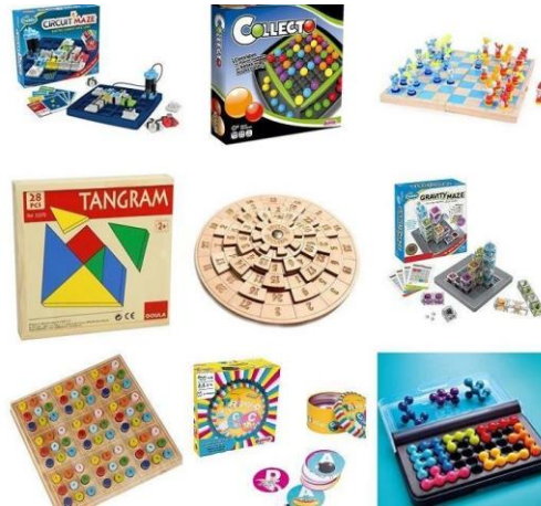
Imagen. - Diferentes juegos de mesa 67

Para la aplicación de los juegos de mesa como estrategia didáctica, se tomó en cuenta las diferentes necesidades infantiles del contexto escolar antes investigado en las cuales los niños y las niñas, participen activamente en su fabricación y ejecución de los diferentes juegos.