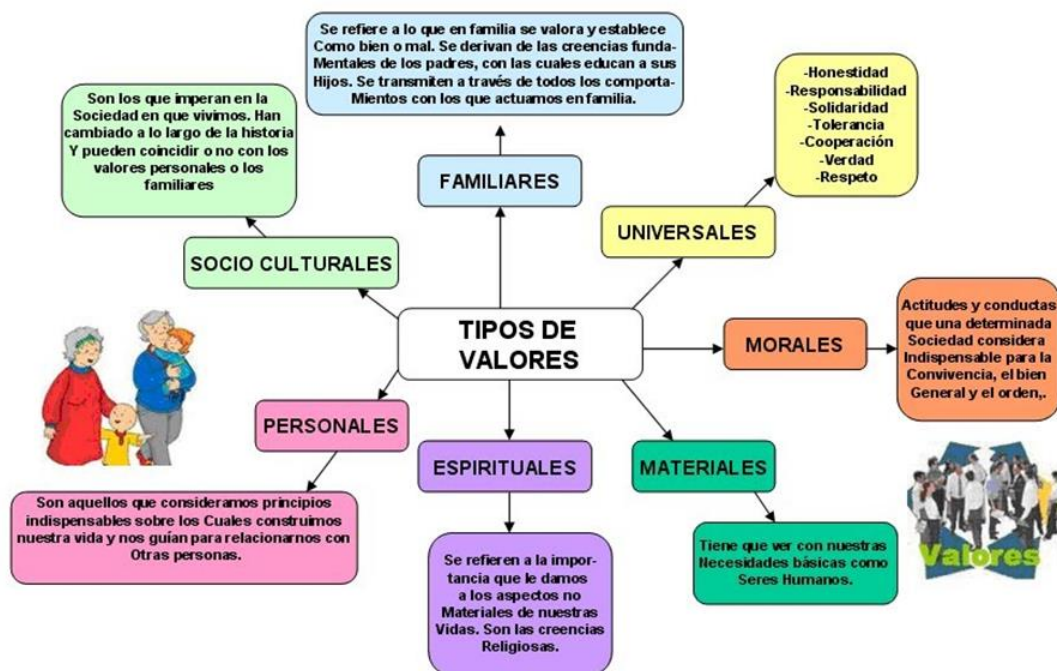
Imagen. - Tipos de valores 23

Como se hace notar en la imagen anterior dentro de los diferentes tipos de valores como son los familiares, socio culturales, morales, espirituales, materiales, personales y universales dentro de esta investigación se busca formar a los alumnos con valores que les den herramienta socioemocional, para mejorar la convivencia escolar, pero que también les den un impacto social en el mundo en el que se desarrollan.