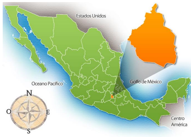
MAPA DE LA REPÚBLICA MEXICANA 1