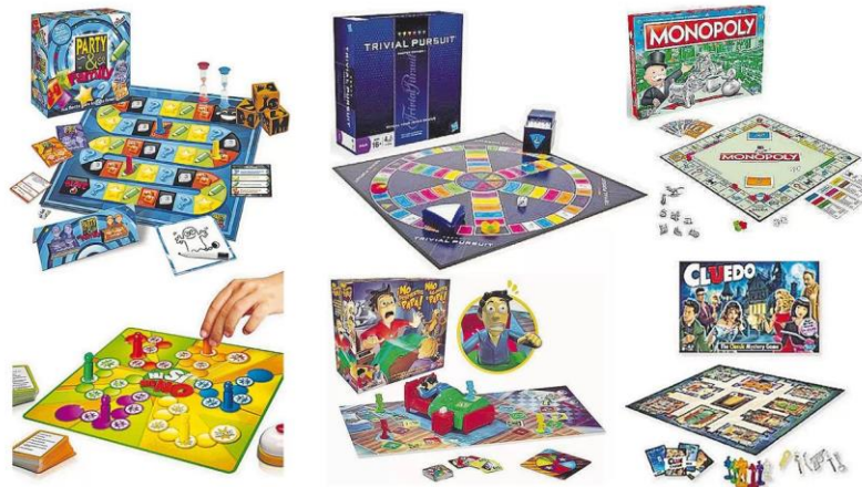
Imagen. - Tipos de juegos de mesa 68

Para la aplicación de los juegos de mesa como estrategia didáctica, se tomó en cuenta las diferentes necesidades infantiles del contexto escolar antes investigado en las cuales los niños y las niñas, participen activamente en su fabricación y ejecución de los diferentes juegos.