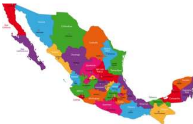
Mapa de la República Mexicana. 1

Dicha investigación se lleva a cabo en el Colegio Makarenko, Escuela Privada, ubicada en Avenida Plazas de Aragón S/N, Col. Plazas de Aragón. 1