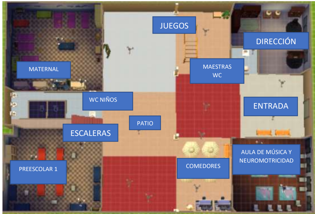
Nivel 1 (Planta baja) (13/01/2017)