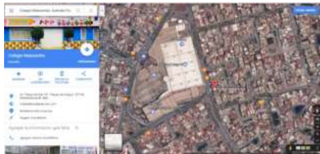
Fotografía vista aérea de la ubicación del Colegio 20

La escuela se encuentra ubicada en Avenida Plazas de Aragón S/N Col. Plazas de Aragón, C.P. 57139 en el Municipio de Nezahualcóyotl, Estado de México.