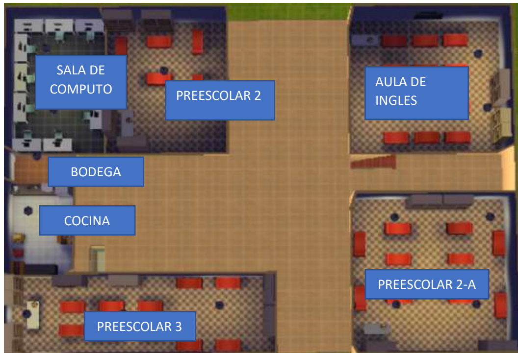
Nivel 2 (Planta alta) (13/01/2017)