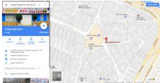
Mapa de la ubicación del Colegio 19