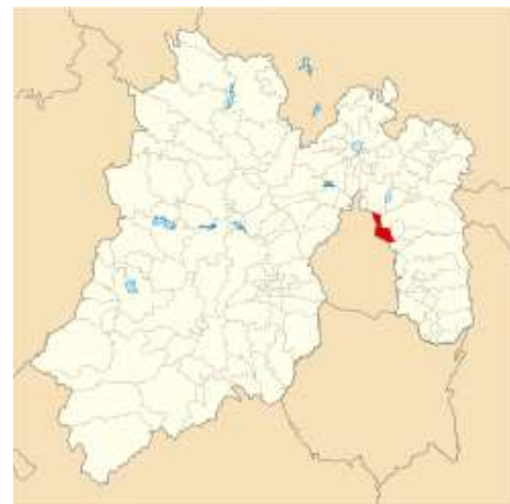
Municipio de Nezahualcóyotl marcado con rojo. 8