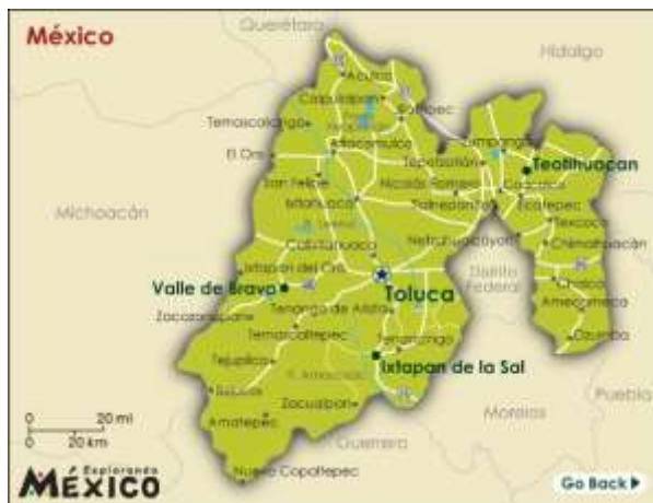
Mapa del estado de México. 7

El Municipio fue creado en 1963, con terrenos que pertenecían al Municipio de Texcoco y Chimalhuacán, ocupando superficie de las aguas del antiguo Lago de Texcoco. Es uno de los municipios con mayor densidad poblacional de su país y del propio estado al que pertenece. Considerado una ciudad dormitorio por su carácter mayoritariamente residencial, en las últimas décadas ha repuntado en su capacidad económica, producción de empleos y de impacto socioeconómico a los municipios adyacentes. A la par, enfrenta problemáticas de pobreza, inseguridad pública y carencia de servicios públicos, entre otros.