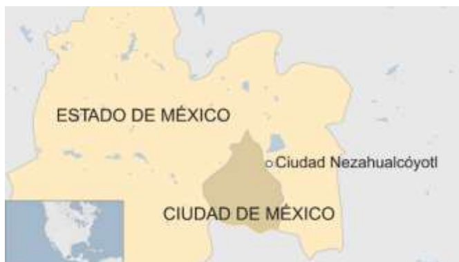
Mapa del Municipio, Nezahualcóyotl. 2