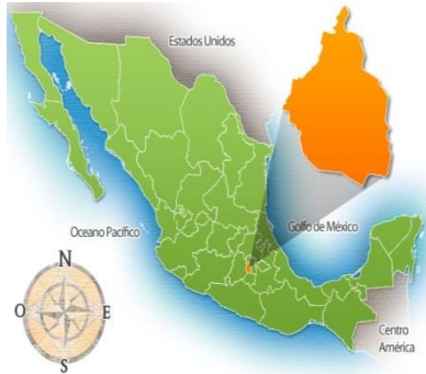
Imagen. - Mapa de la República Mexicana 8