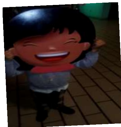
Son máscaras de madera de aproximadamente 50 cm. de diámetro