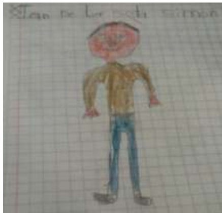
Autorretrato de un alumno que tiene definido su imagen corporal.

Al final lograron realizar su autorretrato completo, dos de los niños solo hicieron dibujos con palitos y una bola. Sus autorretratos fueron pegados en la pared, haciendo una pequeña exposición donde pudieron observar y decir si se parecían al dibujo con el niño, por obvias razones los dos que hicieron el dibujo con palitos, los otros niños opinan que no se parecían; porque ellos no tenían el cuerpo tan flaco.