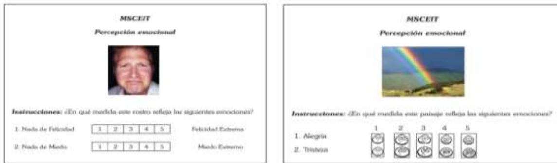
Fig.2. Ejemplos de ítems de percepción emocional del MSCEIT

Recuperado de Pablo Fernández Berrocal y Natalio Extremera Pacheco (2005) La Inteligencia Emocional y la educación de las emociones desde el Modelo de Mayer y Salovey , pp. 77-78.