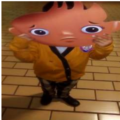
Esta es la máscara que identificaron con la emoción de tristeza.

Al contarles la historia se fue ligando con situaciones diarias a las que se enfrentan los alumnos se les hizo las preguntas las respuestas se escriben en el pizarrón ¿Qué sientes cuando no te prestan el juguete? Dicen se sienten tristes y que les pedirían de favor a sus amigos que se los presten, como amigo ¿se lo prestarías? Dijeron que si pero que cuando el traiga un juguete también lo preste, porque cuando el trae ni siquiera quiere jugar con él.