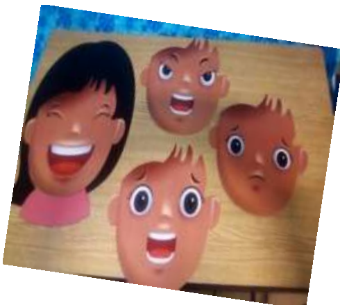
Cuatro de las mascararas que identificaron los niños con facilidad.

Con las respuestas de los alumnos observare y escuchare el motivo porque creen que los quieran o porque quieren ellos a esas personas, y para ellos que es importante para que sientan que los quieran. Reflexionaremos sus respuestas, y les hice las preguntas ¿Si no te compran algo, entonces no te quieren? ¿Si no te llevan a los juegos, no te quieren? ¿Quieres a tu mamá? ¿Por qué, tu si le compras cosas? ¿La llevas a los juegos? Te quieren porque eres su hijo, su sobrino, se dieron cuenta que no es por lo material si no por lo que viven con las personas cercanas a ellos.