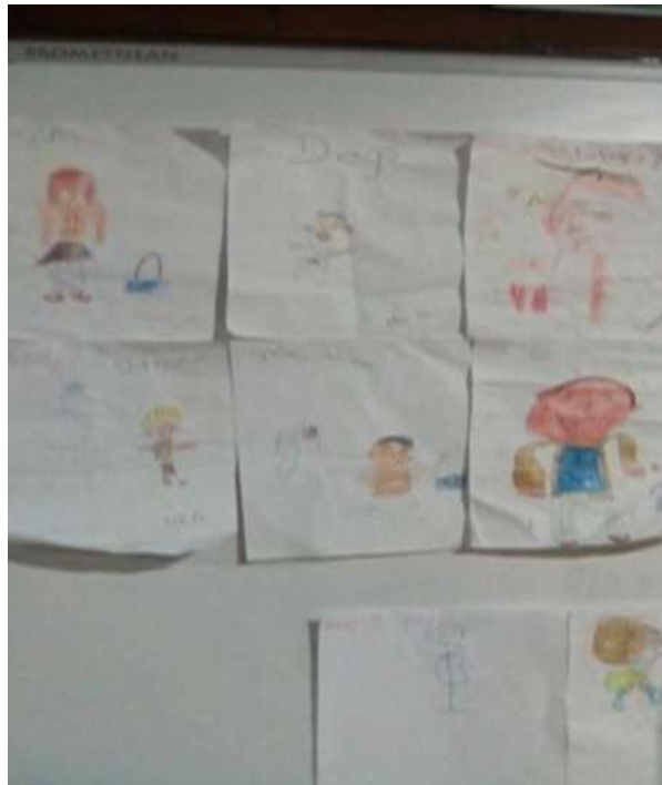
Las diferentes caras donde decían que estaban “emocionados” que no sabían explicar, pero si las plasmaron.

Reconocieron con facilidad tres de las cuatro mascararas, la ultima que era de miedo o temor es una emoción caracterizada por una intensa sensación desagradable provocada por la percepción de un peligro, real o supuesto, presente, futuro o incluso pasado. Ambos, el real y neurótico, fueron términos definidos por Sigmund Freud en su teoría del miedo, hubo controversia, se les fue confusa uno decía que era de sorpresa, otro de nervios ( porque esa cara es la que hace su mamá cuando se le hace tarde, y dice: -ya es muy tarde, mi jefe me va a regañar- ), uno dice que es la cara que ve cuando su papa está emocionado, (no supo explicar que es emocionado) al recogerla así le parece que ve su cara.