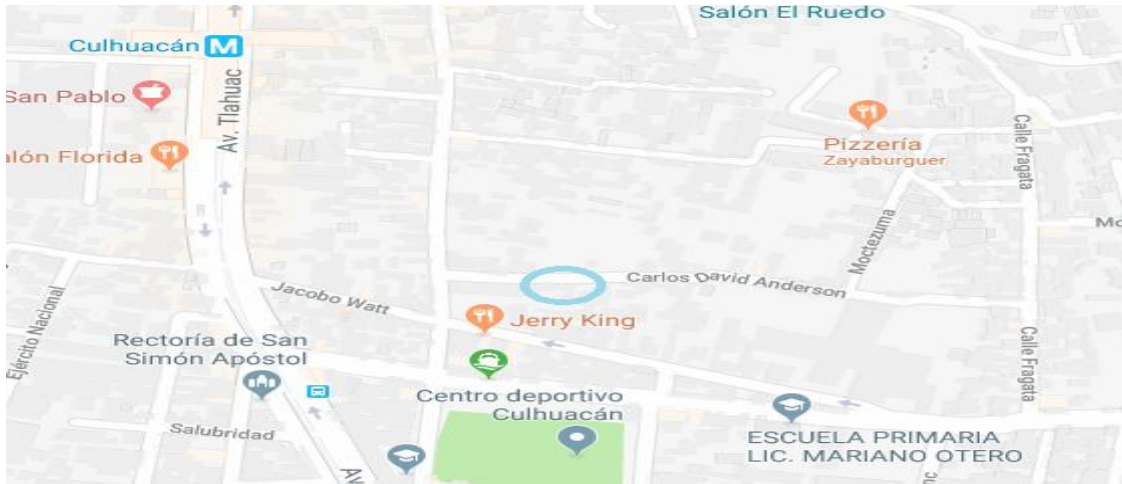
Ilustración 2 Ubicación del Colegio Instituto Culhuacán