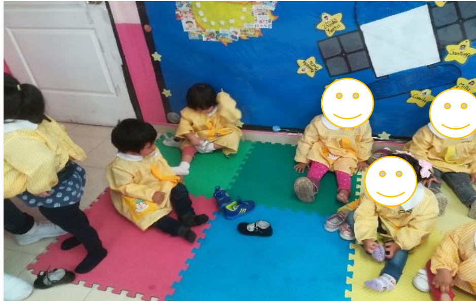
Quitando y poniéndose los zapatos