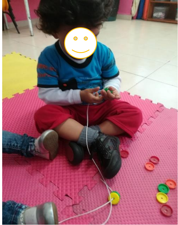
Ensartando objetos pequeños