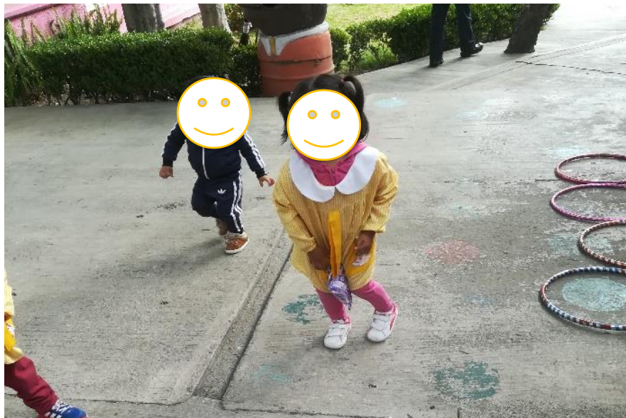
Caminando con un costalito manteniendo el equilibrio