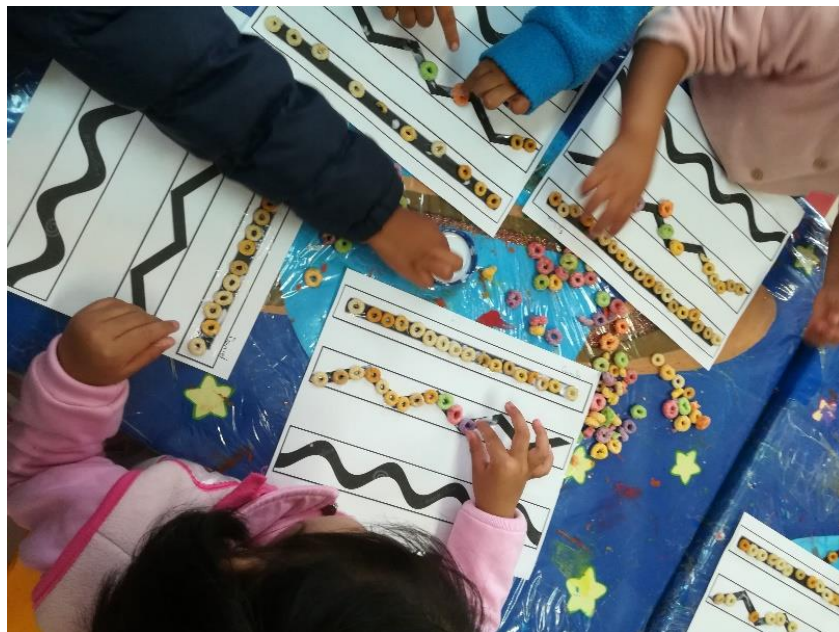
Siguiendo las líneas, pegando cereal