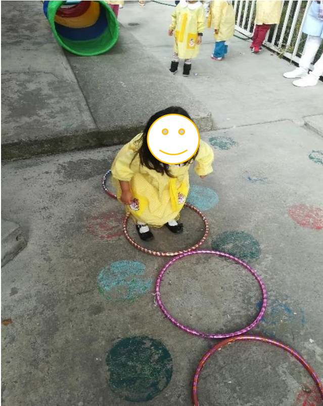
Saltando con ambos pies sobre los aros