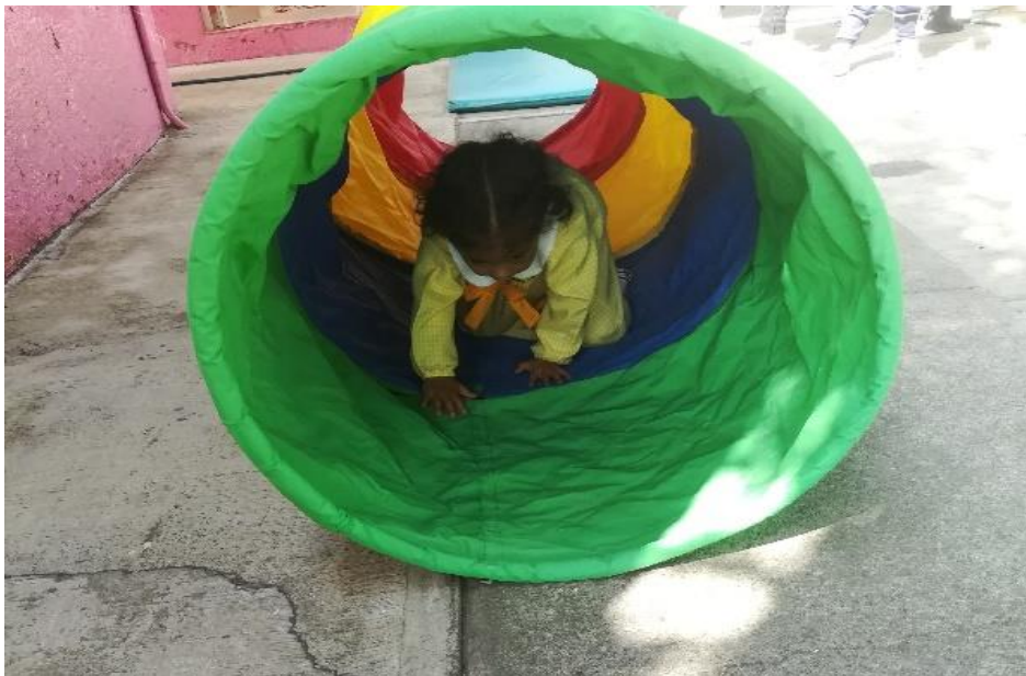
Gateando a través de un túnel