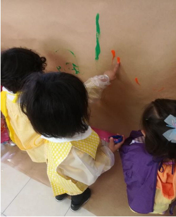
Pintando con los dedos