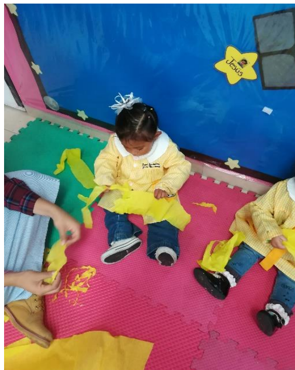
Rasgando de papel