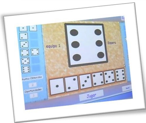
Imagen 1: Diapositiva elaborada por la educadora en donde los niños tendrán que seleccionar o escribir el número según los puntos que tenga cada cara del dado.