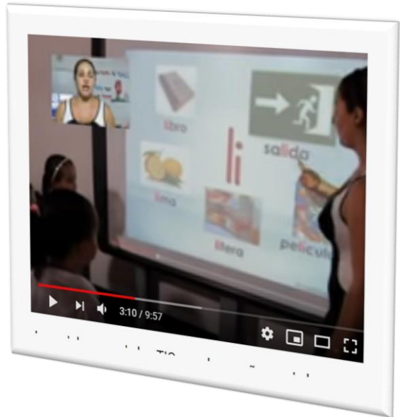
Imagen 1 y 2: Se muestra como la docente está reforzando el contenido del video, mostrándoles algunas palabras en donde encontramos a la letra l.