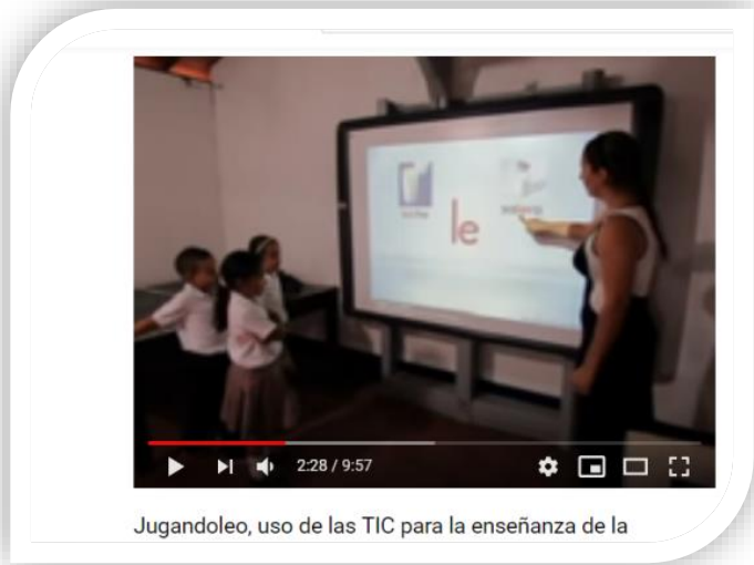
Jugandoleo, uso de las TIC para la enseñanza de la