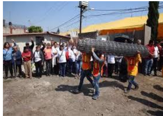
Imagen 8. Trabajos en equipo para mejorar la colonia después de los eventos del 19 de septiembre del 2017.