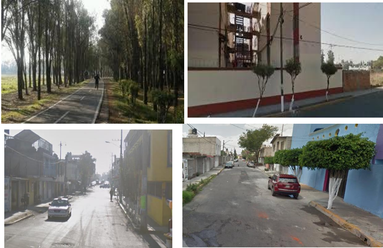
Imagen 7 medio ambiente

ejemplo podemos enseñar a cambiar malos hábitos, y las escuelas hacemos nuestro trabajo para mantenerlo así y que los alumnos sean ejemplo de futuras generaciones. En la imagen 2 se observa las avenidas reconstruidas y parques arreglados en la actualidad.