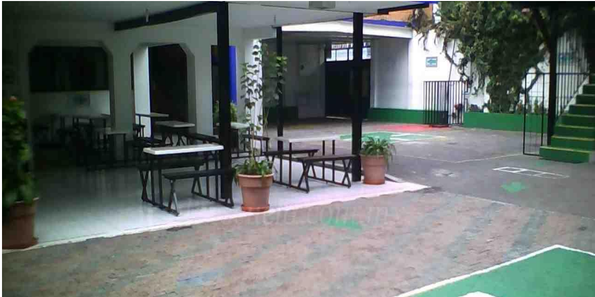
Imagen 4 Patio