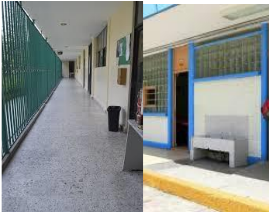
Imagen 3 Pasillos y baños

El instituto al ser privado ofrece sus servicios a toda la comunidad y otorga becas al 100 % a estudiantes de bajos recursos que demuestren buenas calificaciones. Se trabaja con el plan de estudios 2011, y se está capacitando a los profesores para la nueva escuela mexicana. Se mide las habilidades y conocimientos académicos de las asignaturas de español, matemáticas, y formación Cívica y ética.