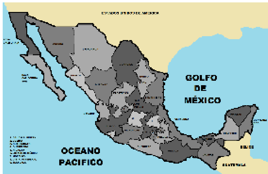
Figura 9 Mapa escolar

Los mapas de la republica que las escuelas tienen (algunas), también son materiales didácticos muy importantes para conocer las zonas climáticas de nuestro país o de nuestro planeta o de continentes según el que estemos trabajando. Los materiales didácticos con los que podemos trabajar son diversos y se aplican según el tema a estudiar para la facilitación del aprendizaje. Es muy importante que didactas vamos a utilizar para sensibilizar al estudiante.