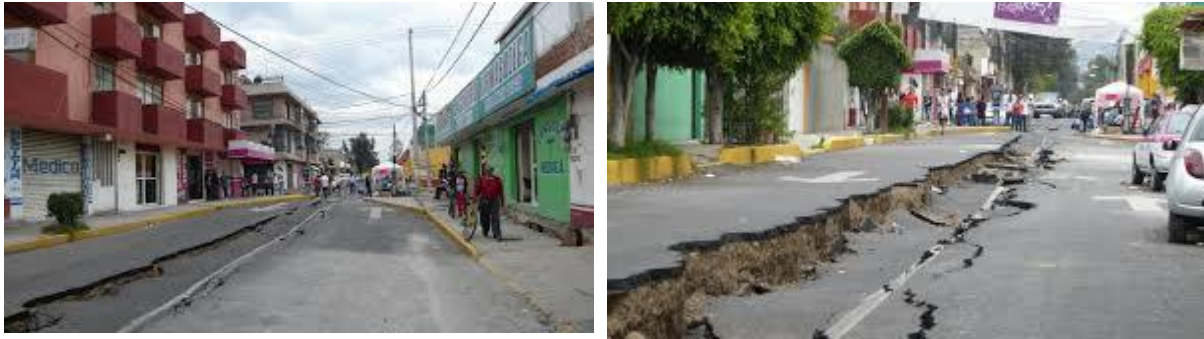
Imagen 6 medio ambiente. Fuente propia

o si alguien no tiene agua en su casa. Esa actitud cambia, así que los sucesos cambian las actitudes sociales como bien dicen los autores.