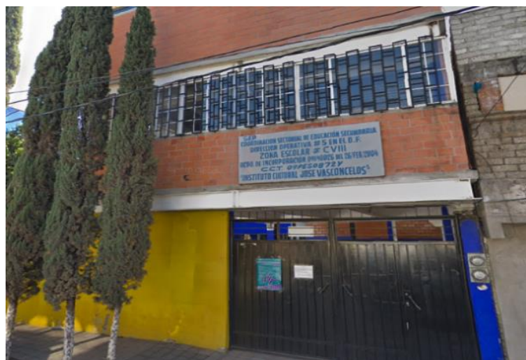
Imagen 2 (entrada a la secundaria José Vasconcelos)

A dos cuadras se encuentra el mercado de la colonia que cuenta con los más elemental de ventas de frutas y verduras, carnes, enseres menores, papelería. A una cuadra esta la primaria oficial julio de la fuente. El instituto cultural José Vasconcelos está ubicado en lugar de fácil acceso, se puede llegar por automóvil particular, transporte escolar, y transporte público. El centro educativo se encuentra en una ubicación geográfica segura fuera de derrumbes, inundaciones, así como situaciones alarmantes que afectan el entorno escolar, tales como inseguridad, vandalismo o drogadicción.