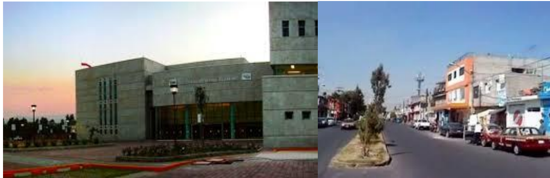
Imagen 1, hospital de Tláhuac y avenida la turba

Es una alcaldía que cuenta con zona de hospitales regionales, parque, bosques centro de entretenimiento familiares, campos de gocha, centros deportivos, ciclo vías y espacios para correr.