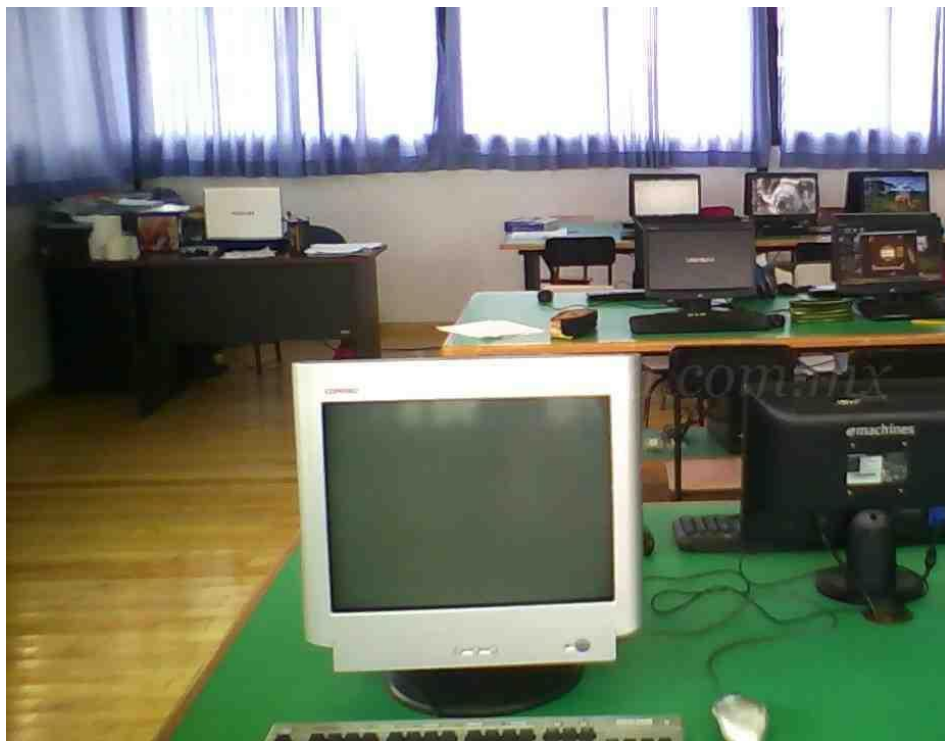
Imagen 5 Aula de cómputo