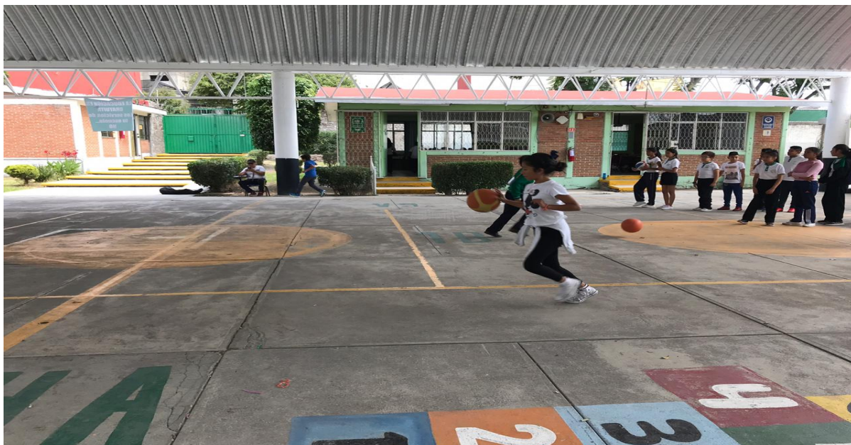
Imagen 5. Alumnos realizando actividad en patio cívico

Al finalizar se dieron impresiones y se realizaron cuestionamientos. Se respondieron dudas y se pudo ver una reflexión por parte de los alumnos. Un servidor registro los avances y el desempeño que mostraron.