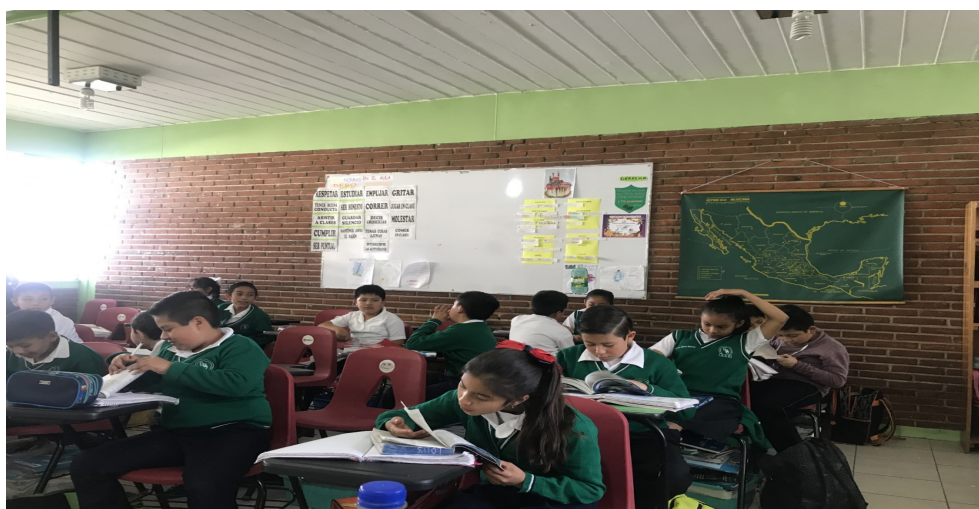
Imagen 4. Salón de cuarto año grupo “B”

El grupo que yo atiendo es 4° B y trabajo con 36 alumnos en total, 16 niñas y 20 niños que oscilan en un rango de edad de 8 y 9 años (Imagen 4). En el diagnóstico inicial mis alumnos mostraron tener parcial dominio de contenidos (tomando en cuenta sus saberes previos) así como un 70% de lectura y escritura (prueba SISAT 2 ), por medio de la aplicación de una prueba de estilos de aprendizaje 28 resultaron ser visuales, 6 auditivos y 2 kinestésicos (Anexo 1).