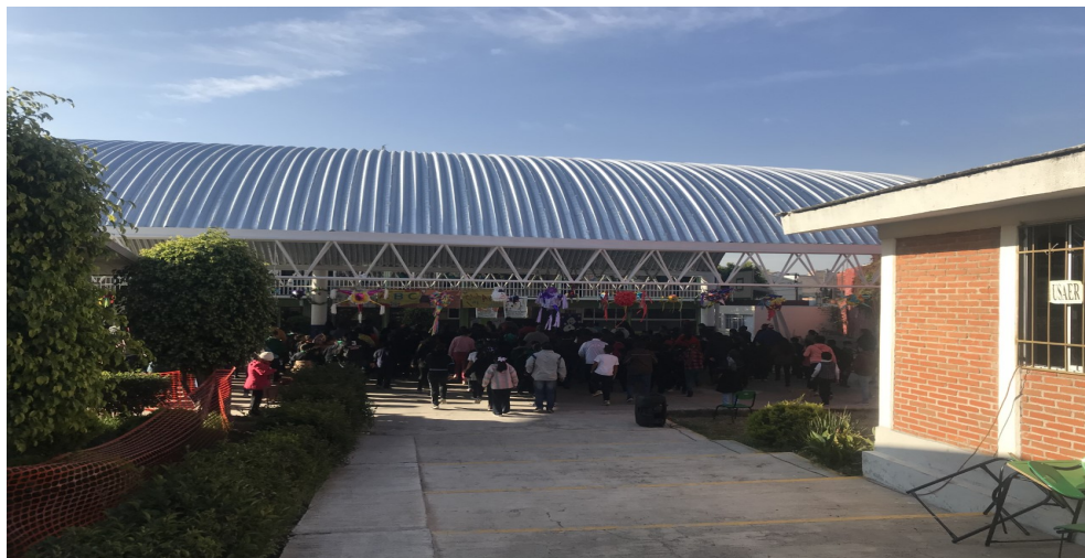
Imagen 3. Pasillo de entrada a la escuela “Guillermo Borja Osorno”

Así mismo destacan sanitarios para niños y niñas, sanitarios para docentes un patio cívico con domo que al mismo tiempo funje como canchas deportivas adecuadas con dos canastillas para basquetbol y en la parte posterior a un edificio se encuentra una cancha de pasto sintético y gradas para futbol (Imagen 3, 3.1).