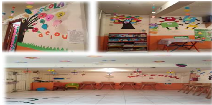
Imagen No.8 Unidad didáctica 3: Lo que más me gusta de mi escuela es...

En esta actividad los alumnos se mostraron interesados y participativos en algunos momentos; algunos solo veían lo que tenían a su alrededor y aunque deseaban mantener una conversación y esporádicamente preguntaban, pero eran confusas sus expresiones porque tenían dificultad para pronunciar lo que observaban, su lenguaje fue poco claro debido a que aún falta estimulación para desarrollarlo de manera satisfactoria. La actividad resultó interesante porque es importante que conozcan el lugar en donde todos los días pasan 8 horas e identifiquen algunos posibles riesgos.