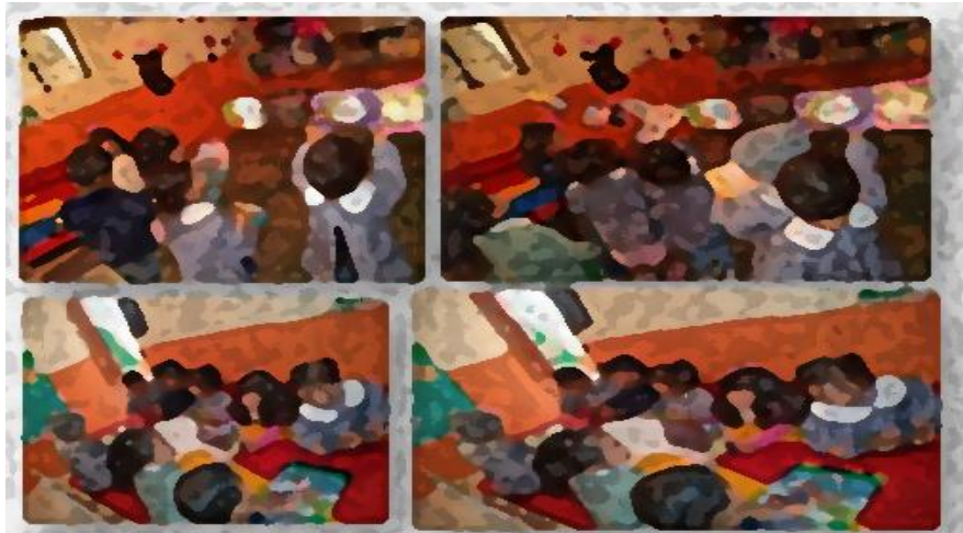
Imagen No.11 Unidad didáctica 6: el tendedero de los cuentos

Durante la realización de la actividad “El tendedero de los cuentos”, los niños reaccionaron de manera favorable ya que observé gran interés cuando realizamos este tipo de actividades; los cuentos les gustan mucho y son muy atentos, aunque no todos logran el mismo proceso de aprendizaje, noto gran interés de quienes les resulta un poco más complejo lograrlo (Ver imagen No. 11).