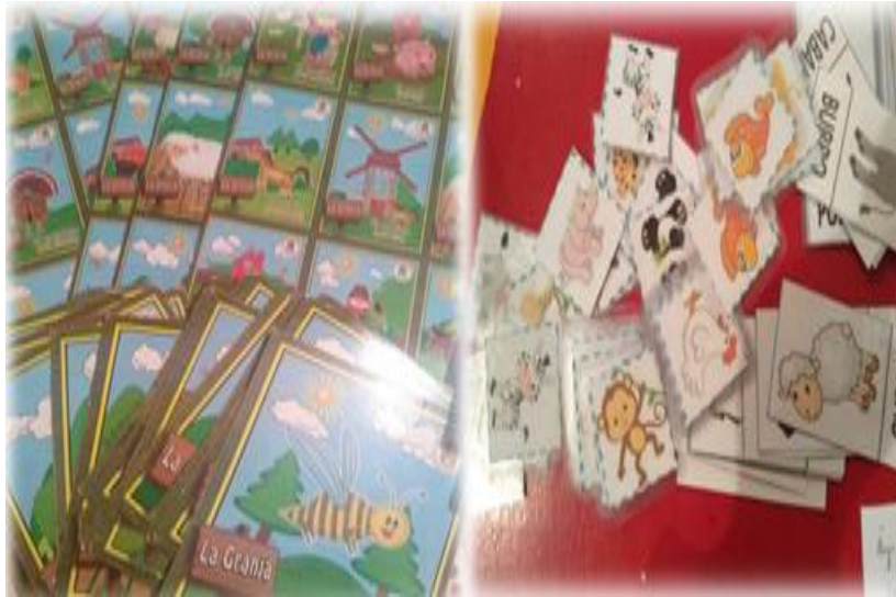
Imagen No.9. Unidad didáctica 4 Lotería de la granja