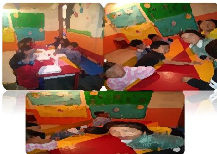
Imagen No. 10. Unidad didáctica 5: Clasificación de animales

Considero de suma importancia que los alumnos conozcan las características de los animales; que al expresarlas ayudó en la estimulación del lenguaje; ya que al clasificarlos deben entablar un diálogo y al tratar de imitar el sonido que emiten los animales, también resultó favorable para el desarrollo de lenguaje; es satisfactorio ver que les interesa realizar las actividades.