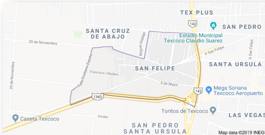
Mapa N° 1: Ubicación del pueblo de San Felipe, Texcoco