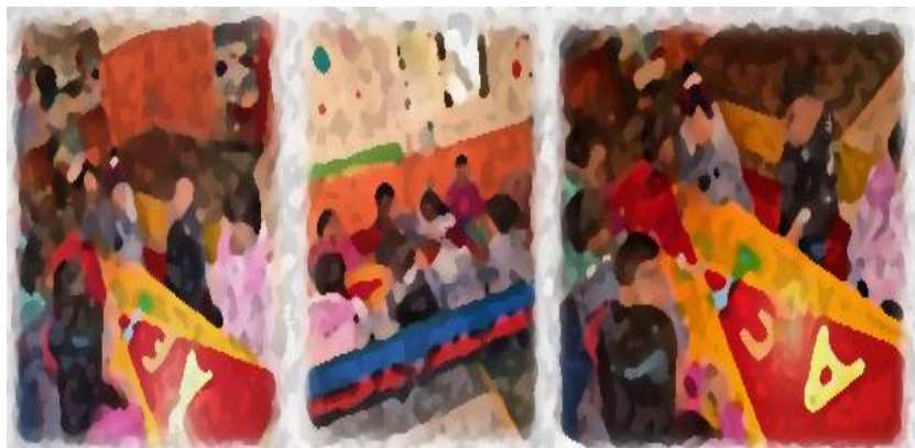
Imagen No.7 Unidad didáctica 1: Juguemos con las vocales

Noto gran interés cuando realizamos este tipo de actividades lo cual me hace sentir bien y me motiva para seguir trabajando en la estimulación de mis alumnos no solo para desarrollar un lenguaje claro si no también que desarrollen otras habilidades. Como muestra del interés y satisfacción que siento al realizar mi labor docente presento las siguientes imágenes en donde se puede observar la motivación y desempeño que cada uno de mis alumnos tiene por aprender y estimular su lenguaje (Ver imagen No 7).