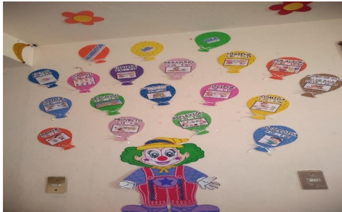
Imagen N° 4: Momentos del día

Así es como se distribuyen las actividades del día, es importante mencionar que actualmente solo se cuenta con un amparo para seguir laborando debido a la desaparición de SEDESOL por consecuencia del programa debido a eso se implementaron nuevas actividades.