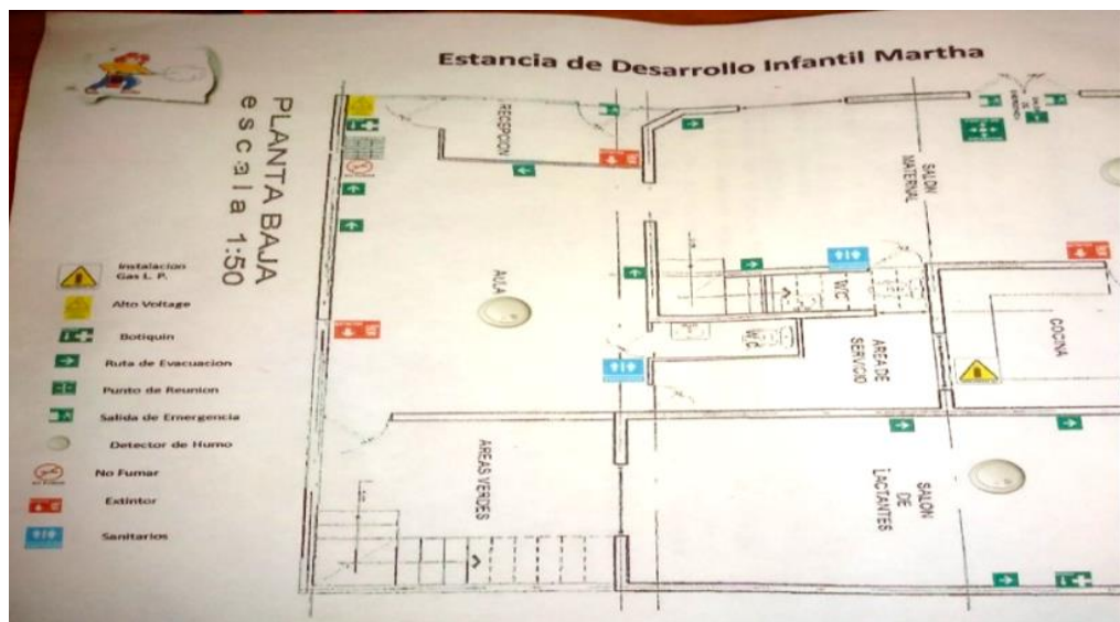
Imagen No. 1: Croquis de la Estancia Infantil Martha

La Estancia Infantil “Martha” no cuenta con una misión y visión ya que el programa no se los exigía de tal modo que nunca se planteó uno, esto según la responsable. Considero que de acuerdo a la lectura es muy importante tener una misión y visión en cualquier centro que brinde servicio en educación a los niños.