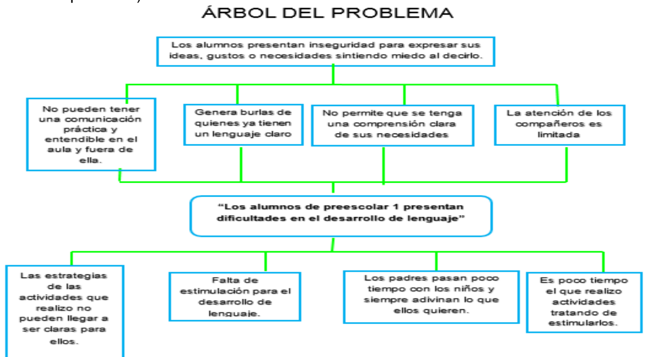
Imagen No.5. Árbol del problema Elaboración propia

A continuación, se muestra el árbol del problema estructurado; una vez que se identificó el problema central; se tomó como referencia cada uno de los pasos o partes que se requiere para poder crear un árbol del problema y las observaciones que he hecho a lo largo de mi práctica docente en mi grupo. (Ver imagen No.5. Árbol del problema).