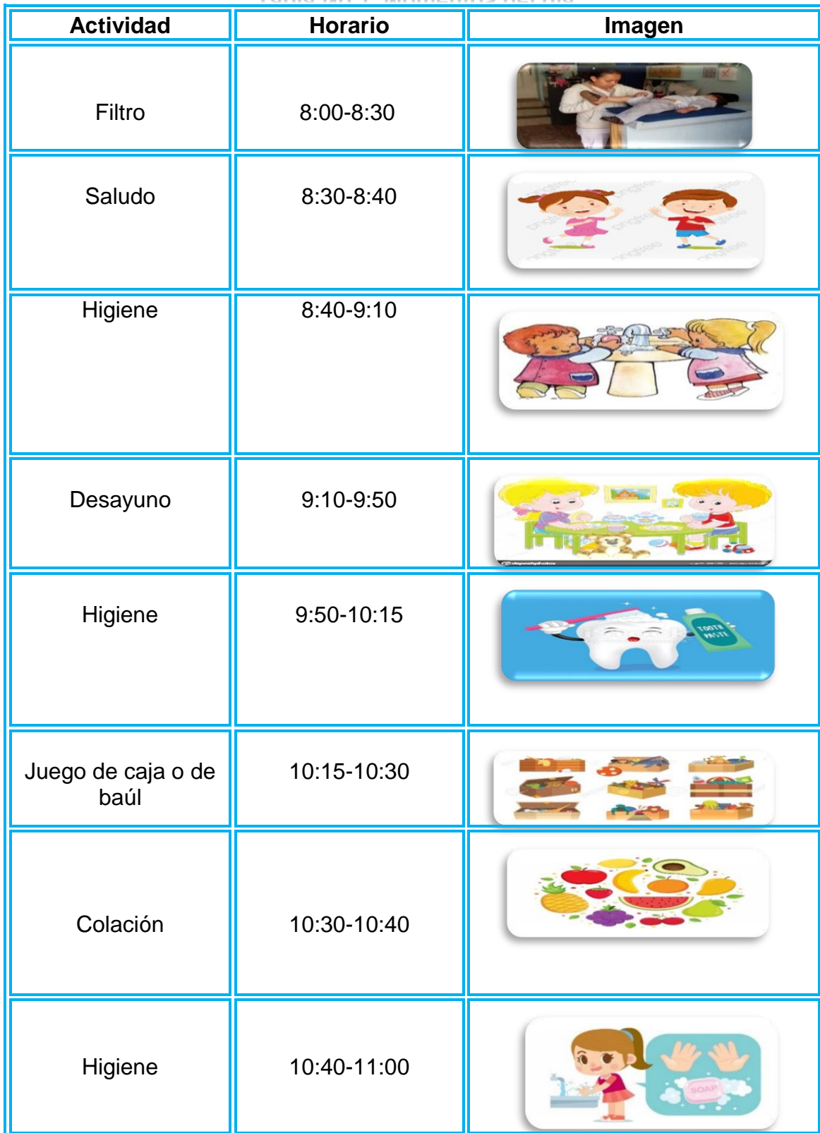
Tabla No.1. Momentos del día