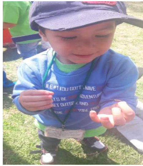
Elaboración propia, 2019