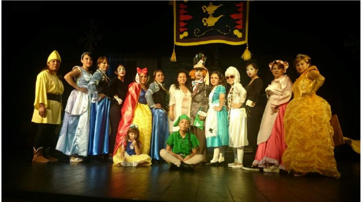
Elaboración propia, 2019

En el parque 2000, se presentan actividades recreativas, culturales como, la mini olimpiada, en donde los niños realizan competencias de diferentes deportes en los cuales desarrollan la motricidad fina, gruesa, el área social, apoyados de sus padres como espectadores.