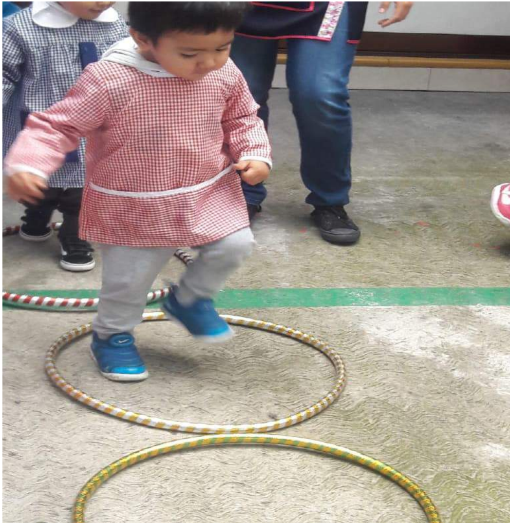
Elaboración propia, 2019

Los niños salieron al patio a jugar con el aro, formaron dos equipos, cada equipo se colocó en línea frente al otro equipo, se tomarán de la mano, esperaron la indicación de la docente, para empezar a pasar el aro por su cuerpo sin soltarse de la mano, cuando llegue con el último niño de la fila, tendrán que regresar el aro hasta llegar con el niño que se encuentra al inicio. Cada equipo realizará cuatro rondas, ganará, quien logre pasar el aro lo más rápido posible manteniendo la coordinación, fuerza y equilibrio