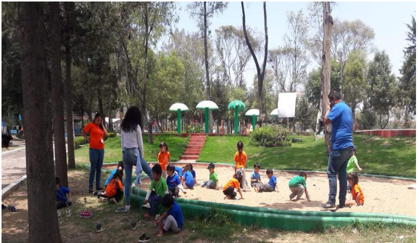
Elaboración propia, 2019