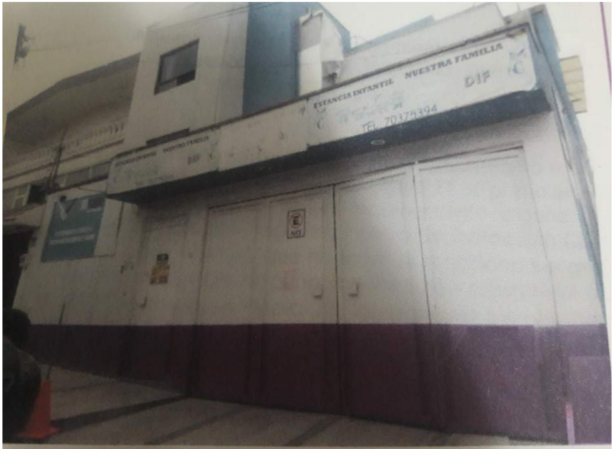
Fotografía 4. Fachada de la Estancia Infantil “Nuestra Familia”

La estancia está cimentada en concreto armado, muros de tabique, losas de tipo reticular, acero reforzado, contables en concreto, armado rigidizado, columnas en concreto armado y pisos firmes de concreto.