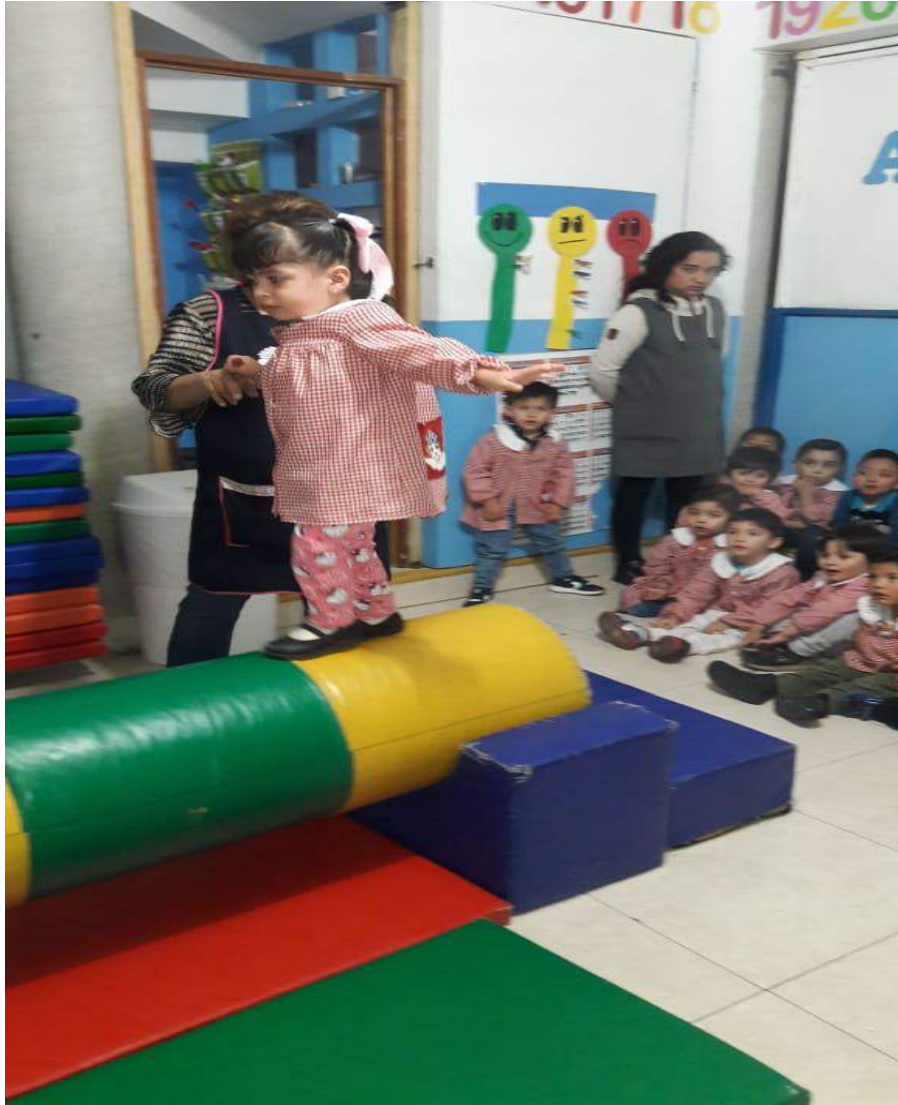
Elaboración propia, 2019

En este juego los niños estaban muy atentos, observando a sus compañeros cómo realizaban la actividad, se escuchaba el murmullo de ¡se va a caer! ellos esperaban con mucho entusiasmo su turno, en especial Mathias que cuando mencione su nombre volteo a ver a sus compañeros y les