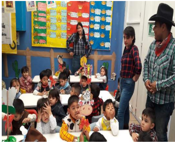
Elaboración propia, 2019