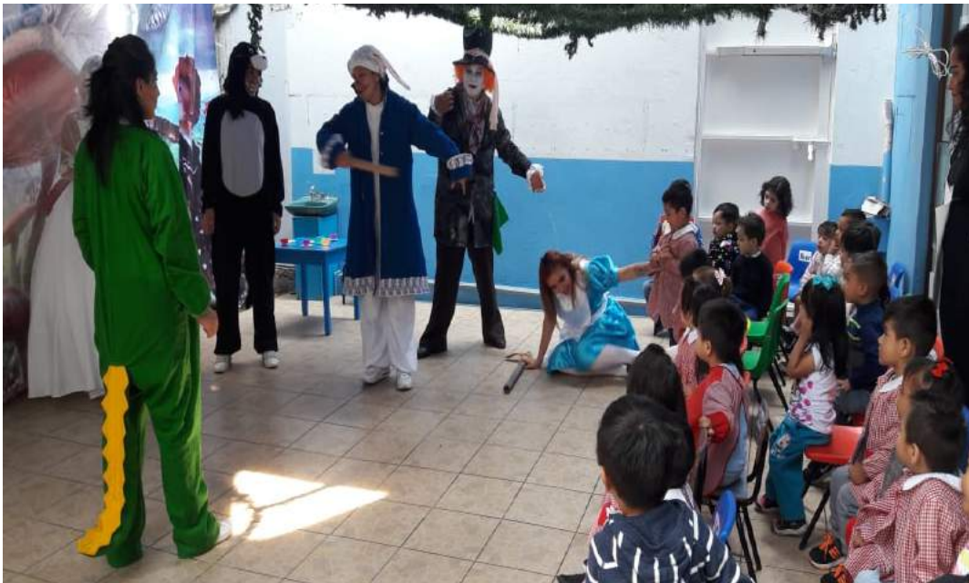
Elaboración propia, 2019