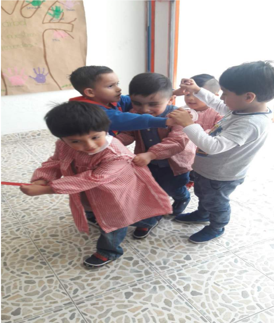
Elaboración propia, 2019