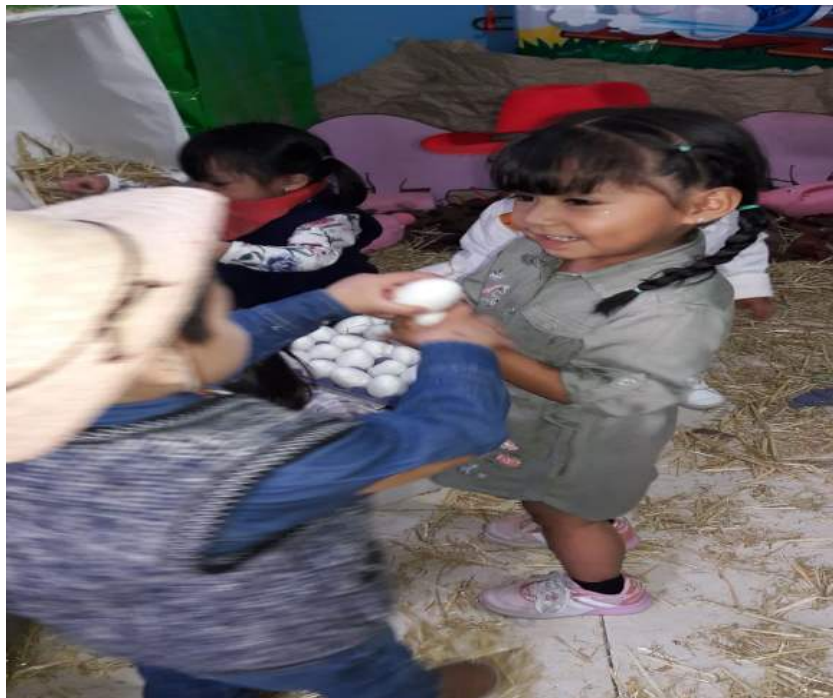
Elaboración propia, 2019