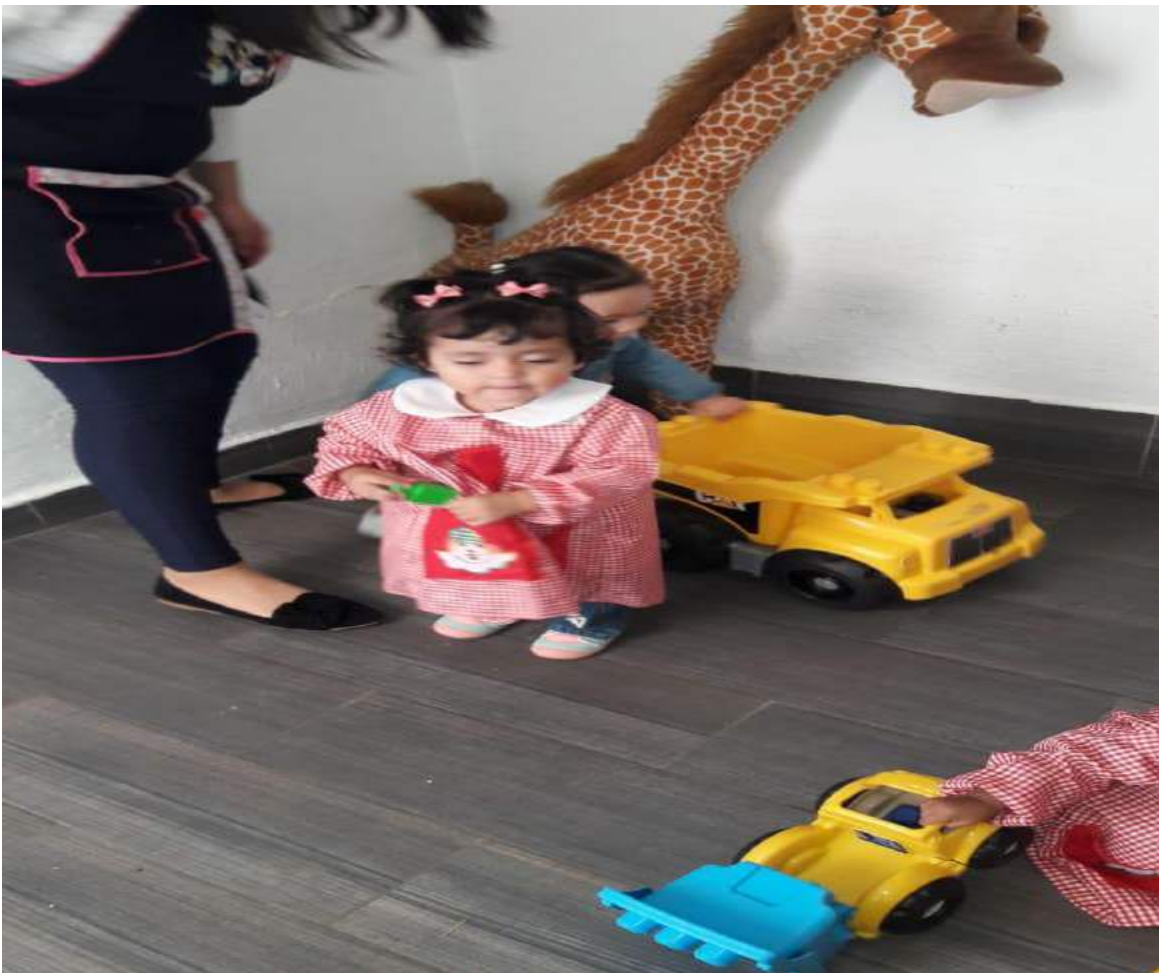
Elaboración propia, 2019

Esta actividad la tuvimos que repetir varias veces ya que se realizaba en el patio los ensayos de bailables de diferentes grupos para el diez de mayo, por lo cual, salíamos e íbamos a la mitad de las carreritas y teníamos que regresar al salón, hasta que un día faltó la maestra del grupo de pre primaria y pudimos ocupar su tiempo y el que nos corresponde, se logró terminar la actividad y cumplir con el propósito.