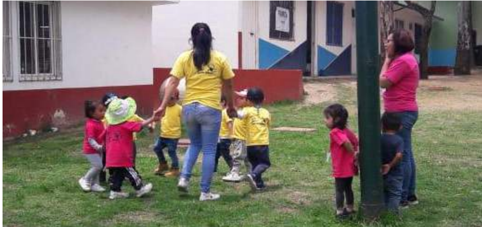
Elaboración propia, 2019

Cabe aclarar que estos centros culturales no se encuentran dentro de la colonia, sin embargo son lugares que por su cercanía con la comunidad, le permiten a ésta, participar en sus actividades.