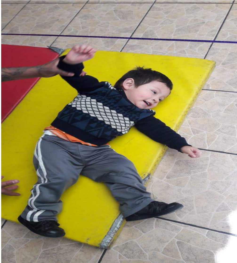
Elaboración propia, 2019

Los niños salieron al patio, en donde encontraron un pequeño circuito formado con colchonetas de diferentes tamaños por donde rodaron como troncos, respetaron el turno para poder pasar uno por uno; controlando su cuerpo en movimientos en diferentes direcciones y posiciones, cada niño realizó cinco rondas, al finalizar, mencionaremos que con la práctica mejorarían sus habilidades.