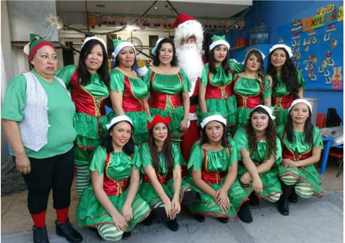
Elaboración propia, 2019

Las principales actividades culturales se realizan en el Teatro Santa Fe, como son las interpretaciones de diferentes obras de teatro, en las cuales participan los niños y niñas destacando sus habilidades de actuación y de baile, así como los docentes.