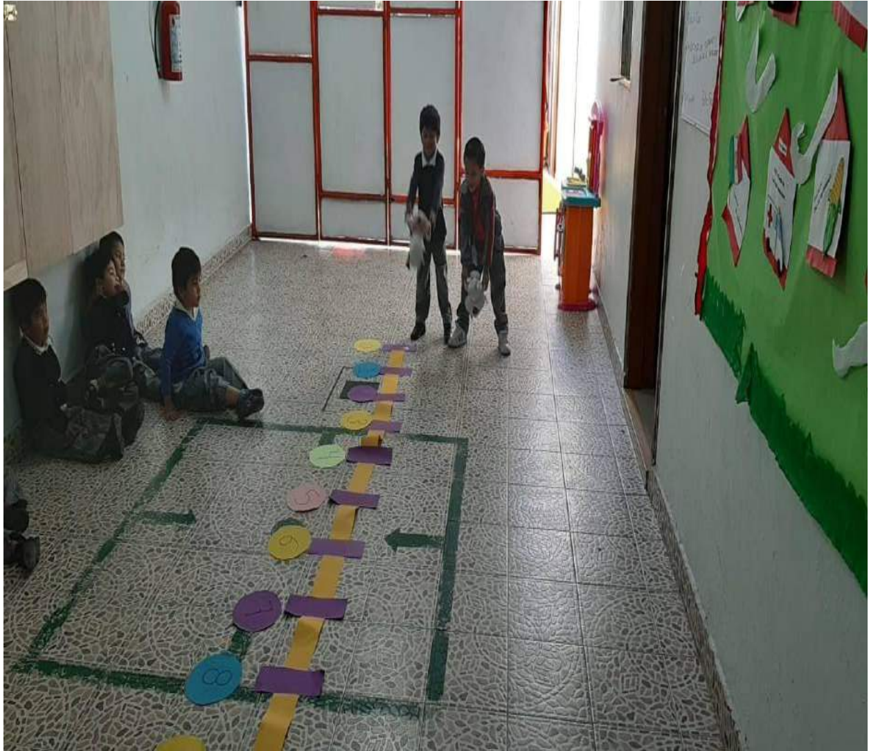
Elaboración propia, 2019

Los niños salieron al patio motivados para divertirse, observaron lo que se encontraba en el piso, varios intercambiaron miradas de asombro y algún que otro muecas y pequeñas risa de diversión. Inmediatamente Karim afirmó ¡mencionó las reglas de la actividad Miss! solo asumió con la cabeza e inmediatamente se fueron a sentar para observar a sus compañeros realizar el juego, ellos observaban en silencio, esperaban con gran emoción su turno.