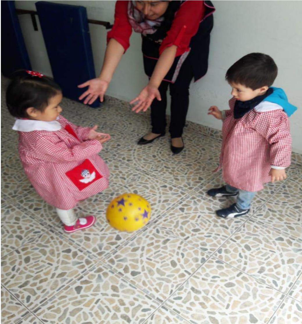
Fotografía, 22. Encestar la pelota