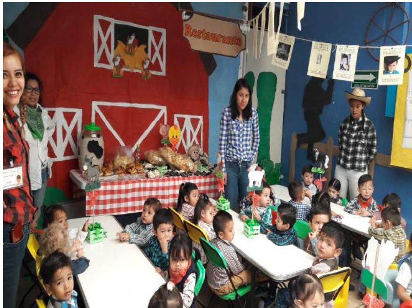
Elaboración propia, 2019