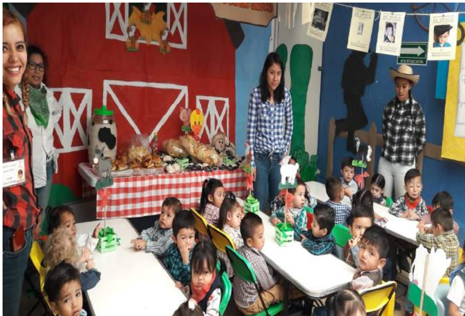
Elaboración propia, 2019