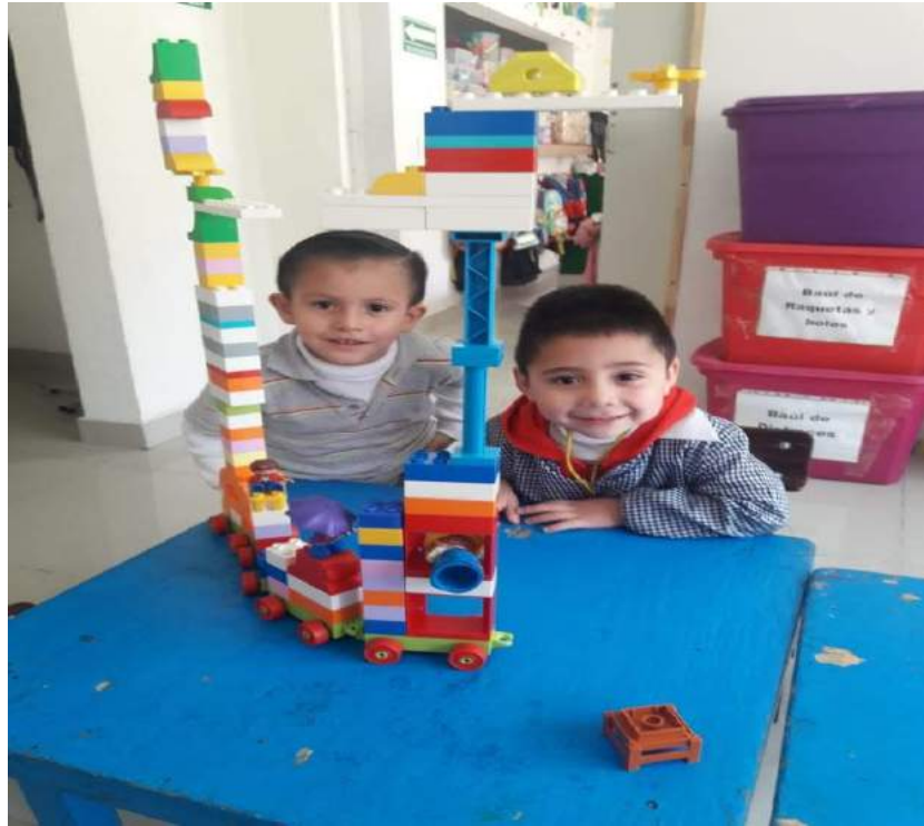
Elaboración propia, 2019

Esta actividad se llevó a cabo en el aula, cada niño se sentó en su silla para que se le proporcionará el material de LEGO en cada mesa, algunos decidieron estar juntos y crear algo diferente, este material les agrada mucho ya que les permite crear, y desarrollar su imaginación, pero lo más preciado para mí, es cuando explican lo que realizaron y me llena el alma de docente cuando los niños mencionan cómo se pusieron de acuerdo, qué hicieron, y hasta nombre tiene su creación, observe el avance y logro de cada uno de los alumnos, me siento agradecida con ellos, porque sin saber la intención que tiene la docente para desarrollar los juegos, ellos se divirtieron y cumplieron con el objetivo que pretendía.