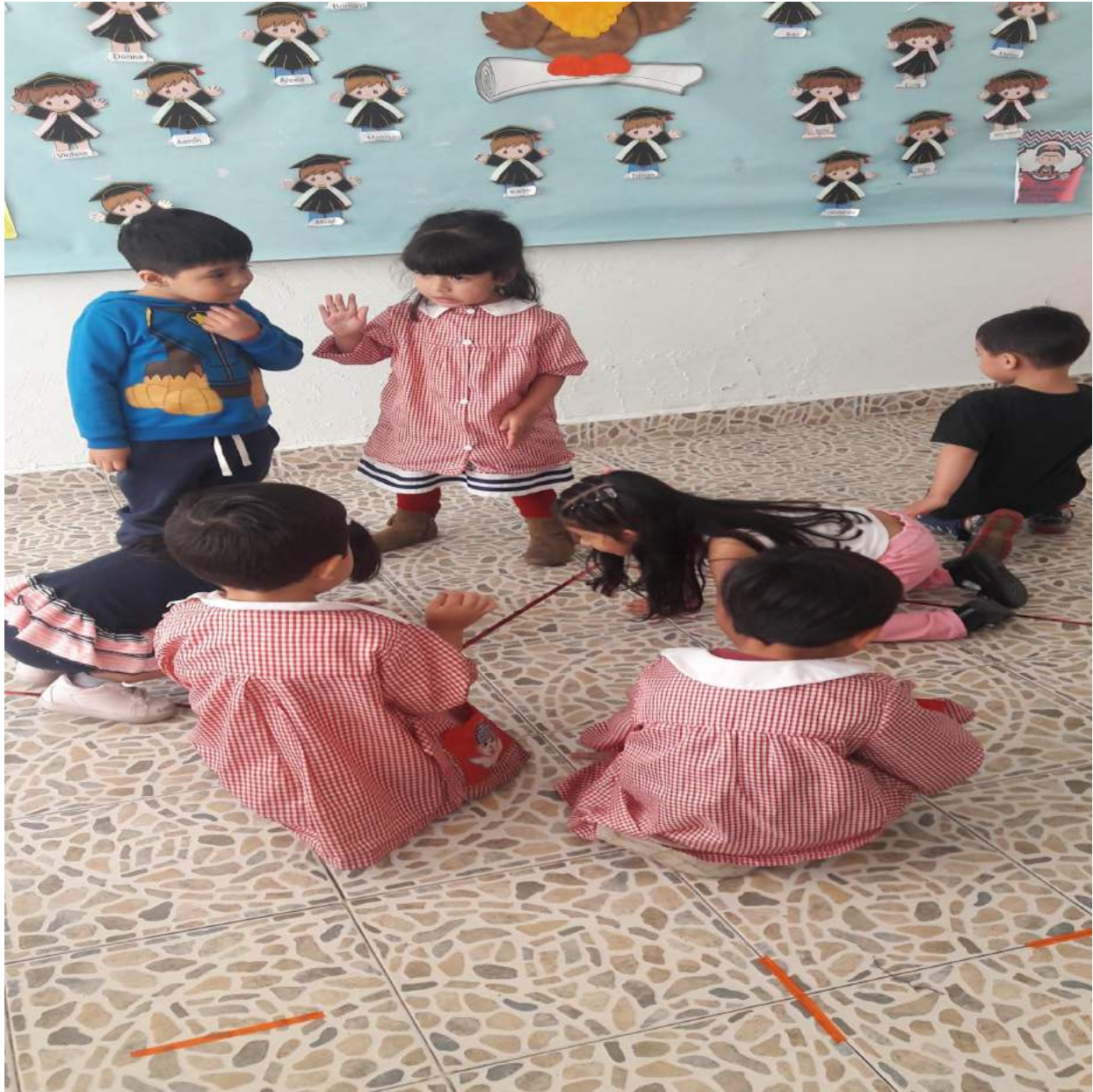
Fotografía 14. Pato, pato, ganso