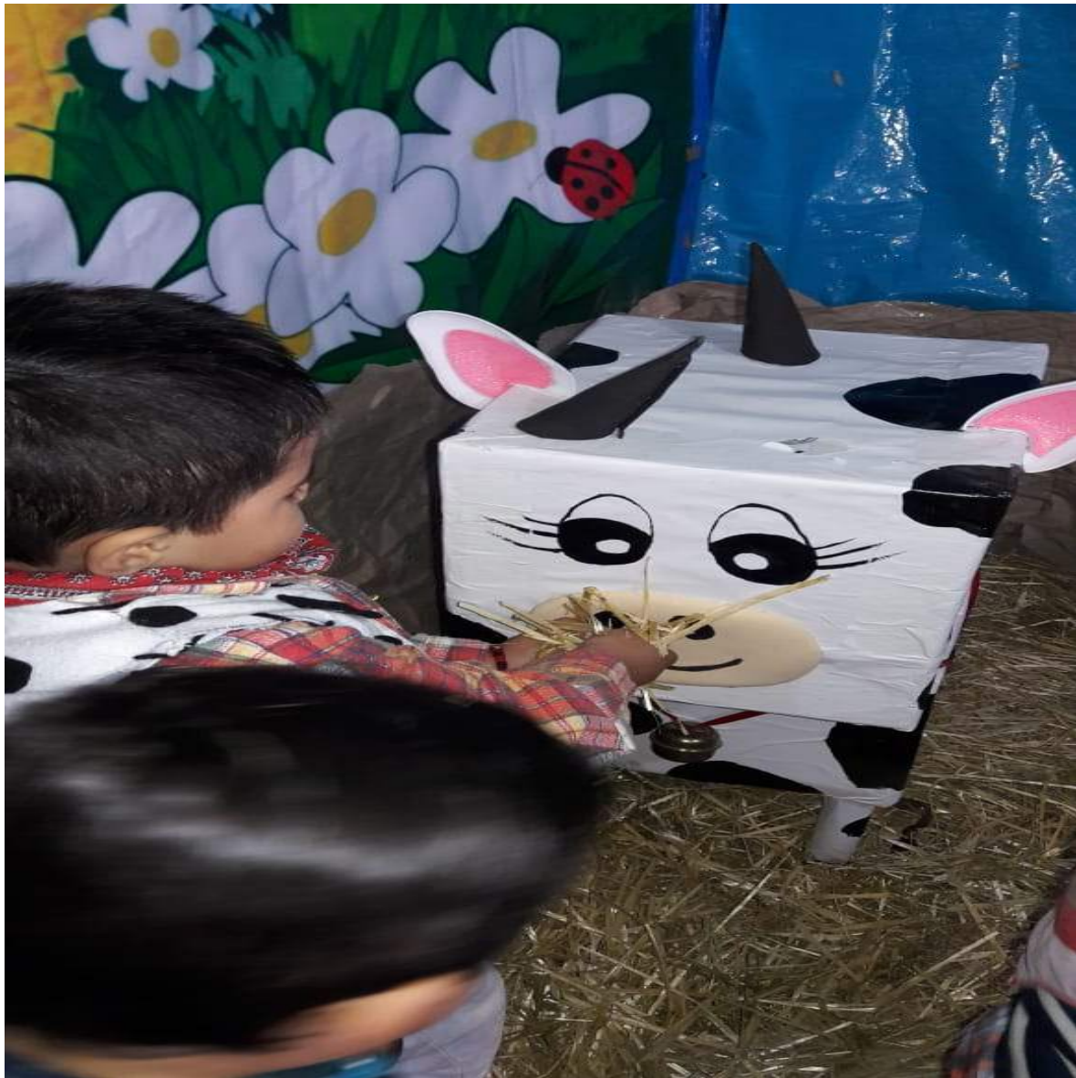
Elaboración propia, 2019