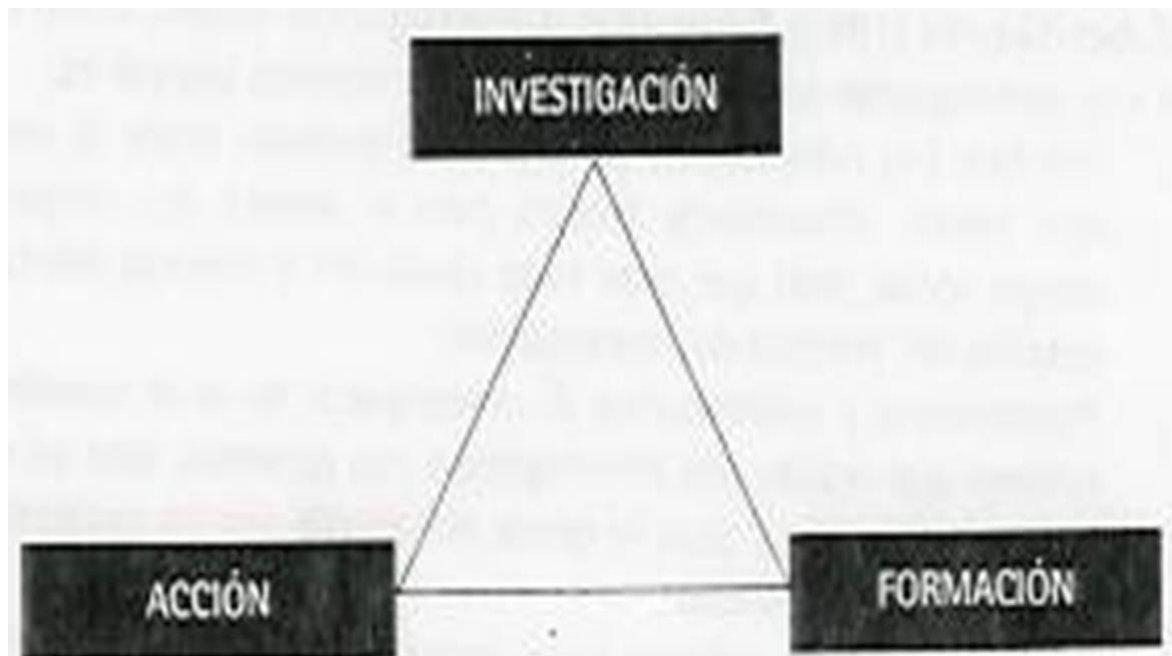
Ilustración 9 Esquema del Triángulo de Lewin

Es significativo el triángulo de Lewin que contempla la necesidad de la investigación, de la acción y de la formación como tres elementos esenciales para el desarrollo profesional. Los tres vértices del ángulo deben permanecer unidos en beneficio de sus tres componentes. La interacción entre las tres dimensiones del proceso reflexivo puede representarse bajo el esquema del triángulo." (Lewin, 1946, pág. 34-36)