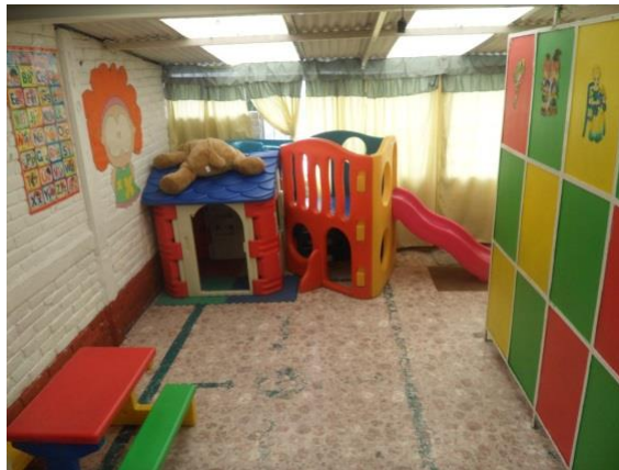
Ilustración 6 Patio del "Jardín de Niños Del Bosque"

al grupo de 2do, otra de 4 metros por 4 metros la cual corresponde al grupo de 1ro, una dirección de 2 metros por 3 metros la cual a su vez sirve como bodega de material de higiene y material didáctico. Un baño con 4 inodoros los cuales 2 son destinados para niñas y 2 para niños y un mingitorio, 2 lava manos individuales y un lavamanos común con 5 llaves para uso individual el patio es un espacio de 6 metros por 3 metros con juegos de plástico como resbaladilla, casita, mesa de juegos, caballito montable y un baúl de juguetes diversos, los cuales sirven para que los niños realicen juegos simbólicos durante el receso, un recibidor de 5 metros por 3 metros en la cual se encuentra una mini biblioteca y área de juegos de azar y habilidades. La distribución de la escuela beneficia a la población ya que se cuenta con los medios y espacios suficientes para atender las demandas de la población estudiantil.