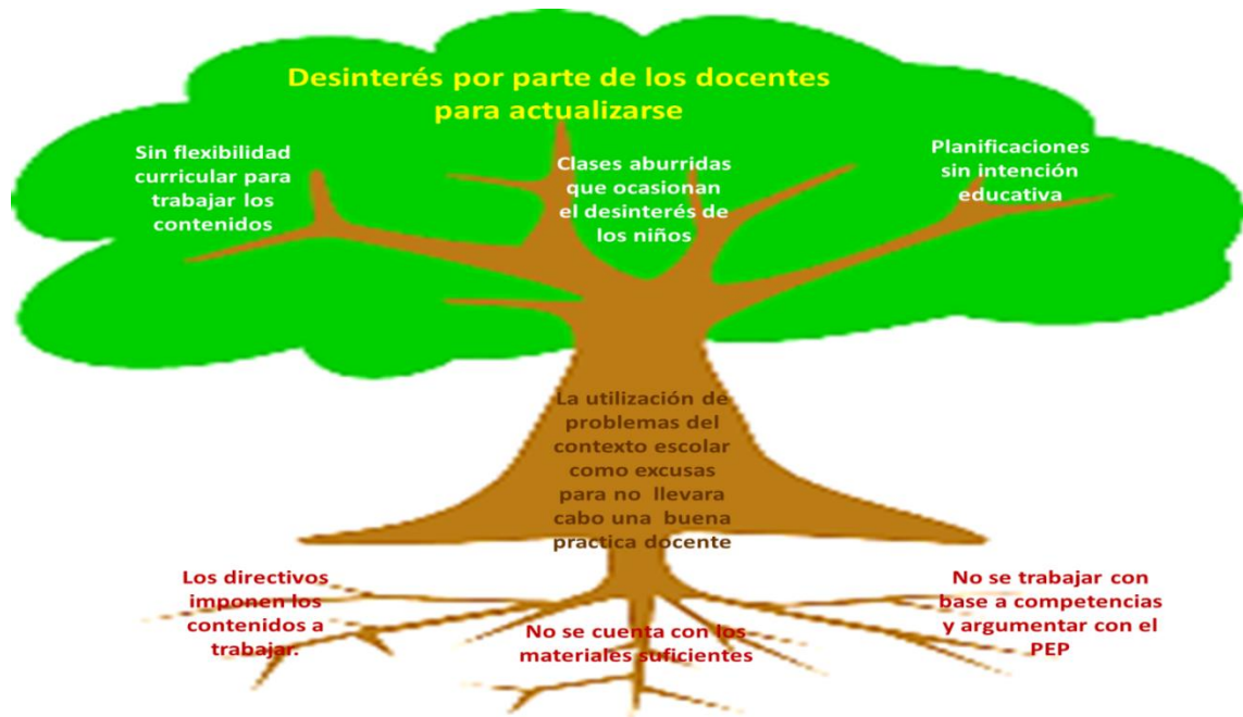
Ilustración 11 Árbol del Problema