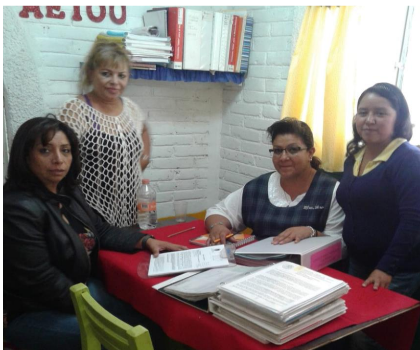
Ilustración 16 Reunión con supervisora de zona

Con ello comenzó diciendo que estaba muy orgullosa de nosotras por querer cambiar y le daba gusto ver que nos estábamos preocupando por actualizarnos y retroalimentarnos, sobre todo que le daba gusto que lo que estábamos aprendiendo en la universidad lo estábamos llevando acabo y aplicando.