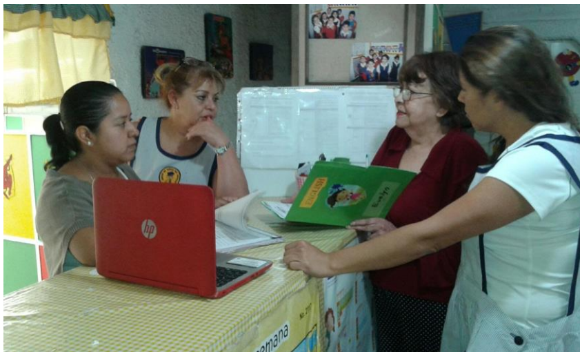
Ilustración 13 Profesoras del Jardín de Niños en reunión

Durante mi platica con la directora pude percatarme que aunque sabe mucho aun no le queda claro cómo llevar a la práctica algunos de sus conocimientos y eso me servirá mucho más adelante, ya que al exponerlos entre mis compañeras nos permitirá ofrecer distintas perspectivas para poder buscar la estrategia de implementación más correcta para poder aplicar esas estrategias que la directora quiere implementar pero que no puede aterrizar y es que bien dicen: “piensan mejor dos cabezas que una”