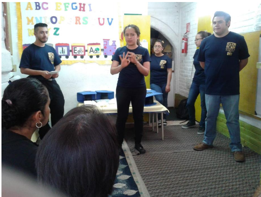
Ilustración 17 Pasantes de pedagogía de la UNAM