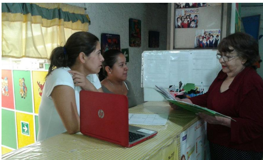
Ilustración 14 Retroalimentación con la primer dueña del Jardín de Niños

El poder exponerle a la directora los problemas o las áreas de oportunidad que tenemos que trabajar como escuela nos permitió valorar las consecuencias que podemos tener. El Jardín de Niños "Del Bosque" es una escuela muy pequeña la cual este año tuvo una matrícula de 15 alumnos lo cual nos ha obligado a poner las cartas sobre la mesa para poder valorar en que estamos fallando y nos percatamos que entre las causas esta la falta de desinterés por actualizarnos o buscar estrategias que nos permitan ofrecer una educación de calidad, estamos dejando de lado aspectos de gran relevancia que nos permiten desarrollar al niño integralmente para un mejor desarrollo personal y académico.