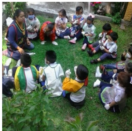
Ilustración 8 jardín interior del Jardín de Niños Del Bosque

Parte importante en este gran sistema son los padres de familia los cuales son los encargados de sembrar valores y educación a sus hijos ya que de ellos depende el comportamiento y sus formas de actuar en la sociedad, si ellos no cuentan con bases firmes en la familia el niño lo demostrara en el aula a la hora de interactuar con sus compañeros y no podrán convivir evitando lograr relaciones socio-afectivas entre compañeros incluso con los docentes. Aparte que los padres de familia son quienes inyectan el capital económico a la escuela sin su aportación económica la escuela no contaría con docentes frente a grupo y la escuela no tendría el capital para poder llevar acabo las funciones educativas. Sin ellos en pocas palabras el jardín de niños "Del Bosque" no existiría.