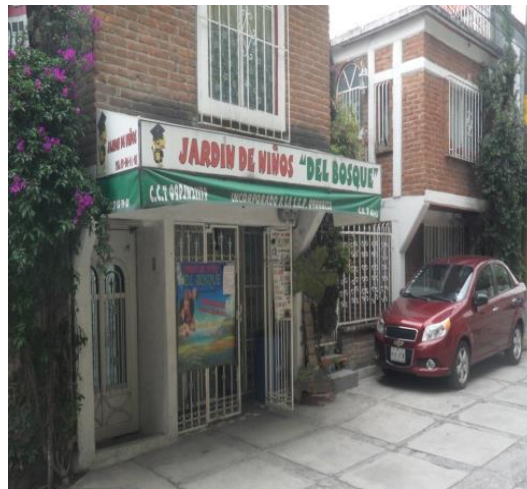
Ilustración 5 fachada del "Jardín de Niños del Bosque"

El jardín de niños "Del bosque" es una escuela que está situado en la calle de Chiconautla en la colonia Santa Isabel Tola. Una escuela es: "El término escuela deriva del latín schola y se refiere al espacio al que los seres humanos asisten para aprender " (Diccionario Virtual). Su función es alfabetizar a la sociedad y atender a niños para desarrollar habilidades, conocimientos y actitudes. Con una superficie de 100 metros en los cuales se encuentran 3 aulas; una de 5 metros por 3 metros la cual corresponde al grupo 3ro de preescolar, una de 3 metros por 3 metros la cual corresponde