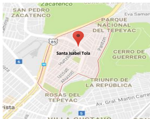
Ilustración 1 ubicación de la colonia "Santa Isabel Tola"

El centro escolar en el que laboro actualmente, en la Ciudad de México, delegación Gustavo A. Madero, colonia Santa Isabel Tola ubicada al norte de la cuenca de México. Santa Isabel Tola es una colonia urbana; "la cual tiene 4 funciones básicas: residencial, comercial, administrativa, industrial." (Dickinson, 1961)