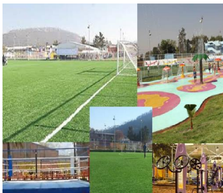
Ilustración 3 deportivo de la colonia

4.-Función industrial: “se relaciona con la economía de la ciudad y por la creación de empleos y de producción de bienes manufacturados” Dentro de la colonia existen diversas empresas que se dedican a la elaboración de Resistol, metales, chocolates, botanas, colchones, llantas, refacciones automotrices, por mencionar algunas. Sin embargo solo algunas cubren sus funciones con personal de la misma colonia, lo cual hace que la población salga a buscar otros medios de trabajo a colonias aledañas. Pese a esto actualmente la comunidad goza de un nivel socioeconómico de medio a medio alto. Permitiendo que la colonia prospere y se desarrolle por con autonomía, adaptándose a los tiempos y épocas así como a los medios con los que cuenta.