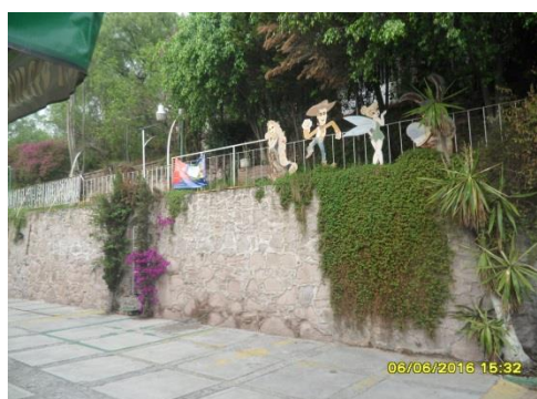
Ilustración 7 Vista del Parque Nacional del Tepeyac

cuales 3 son niñas y 1 niño. La población ha bajado debido a varios factores entre ellos el acceso a esta, los docentes que han laborado ahí, la incorrecta administración, así como la ausencia de festivales en fechas conmemorativas.