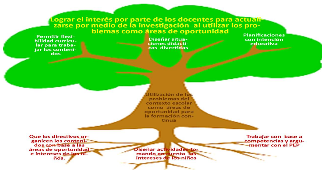
Ilustración 12 Árbol de objetivos