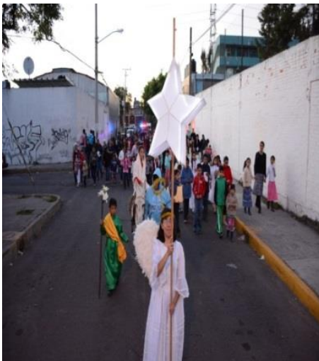
Ilustración 4 procesión de navidad tradición de la colonia

matrimonios al ser aún una comunidad con sus tradiciones muy arraigadas, Sin embargo con el paso del tiempo y con estos cambios constantes también hay madres y padres solteros y divorciados. Hay 3 iglesias; siendo la principal, la iglesia en honor a la Reina de Santa Isabel de Portugal y 3 templos cristianos a los cuales asisten más personas externas a la comunidad. Se llevan a cabo actualmente 2 festividades; que son la fiesta patronal de la iglesia de Santa Isabel de Portugal y un carnaval el cual celebra la apertura de la semana santa; en ella los hombres se visten del tradicional Huehuenche y las mujeres de morras. Y se llevan a cabo las tradicionales procesiones religiosas de semana santa. Como el viacrucis, la procesión delas palmas, del silencio.