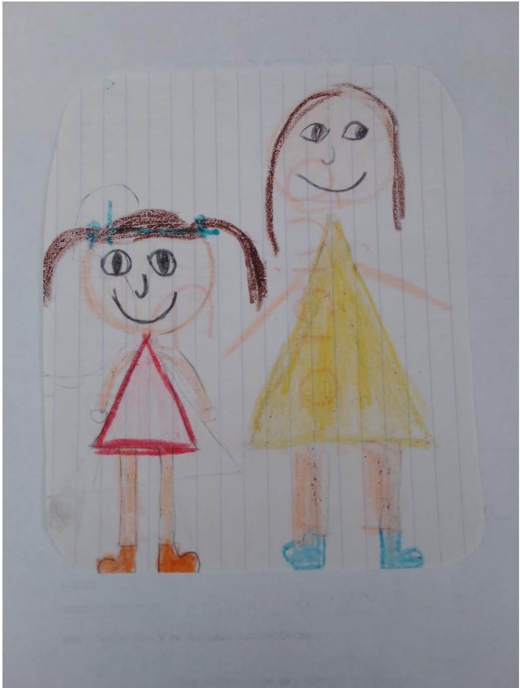
Ilustración 18 Dibujo elaborado por alumna de Preescolar 3