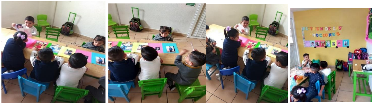
AP 12 Y 13, 14 y 15 fotografias niños preescolar 1 trabajando el tren de las emociones

Fue un caos porque discutian,gritaba,se enojaban ,todos querian que se les respetara en donde ellos decian, les dije haber quien quiere en esta pared, les señale un costado todos dijeron ¡yo! les señale la pared de enfrente, les dije en esta todos ¡yo! les dije creo que en todas quieren las pondremos en la parte de enfrente ¡ya! todos si maestra si esta bien hay , les pedi que me ayudarán a colocar el tren y les dije que todas las mañanas al llegar con las caretas y el tren diriamos y expresariamos como se sienten todos los dias colocamos el tren,dimos por terminada la actividad.