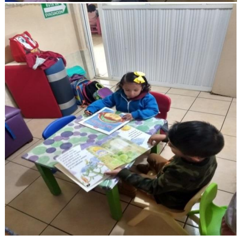
AP 16,17, 18, 19 fotografías tomadas en la biblioteca a los niños de preescolar 1 con los cuentos de las emociones