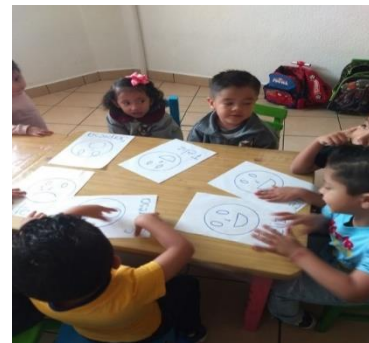
Fotografias 8 y 9 , 10 y 11 niños preescolar 1 trabajando las siluetas delas emociones