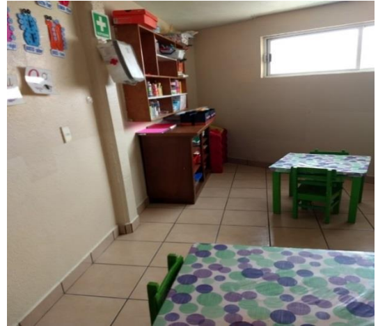
Fotografías 4, 5 AP vista lado derecho