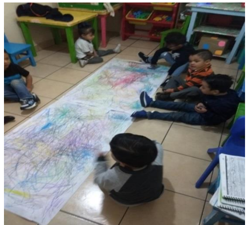
AP 22, 23, 24,25 y 26 fotografías de preescolar 1 rayado libre rasgado de papel y dar forma al monstruo