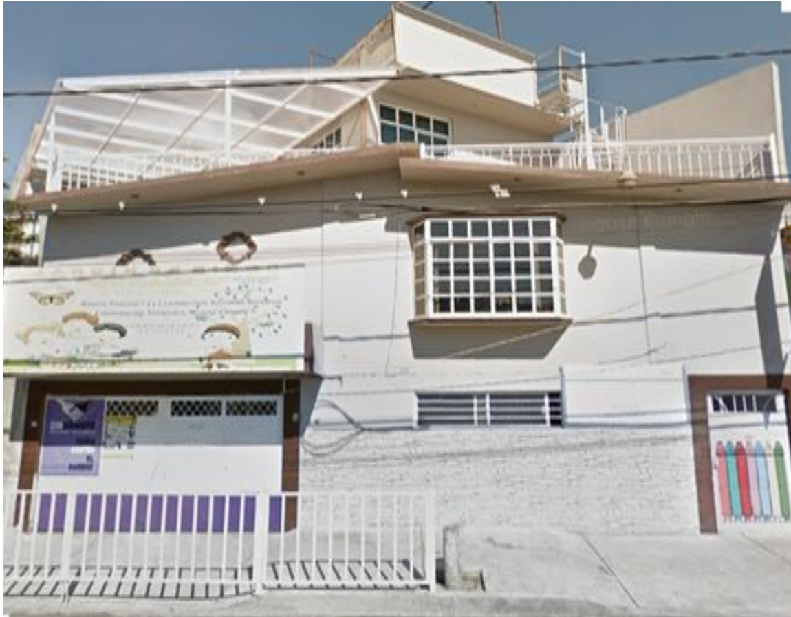
Fotografía 2-GOLGLE MAPS: Google, inc.2018 Jardín de niños Monarca

Misión. Tiene como misión guiar en su formación integral a los niños, habilitándolos para el desarrollo de sus competencias, poniéndolas en práctica dentro y fuera de la escuela. Logrando autonomía, autoestima, y responsabilidad en su trabajo. Visión Marcar la diferencia en educación formando niños felices y comprometidos en el mejoramiento de sí mismos y la conservación del mundo que los rodea.