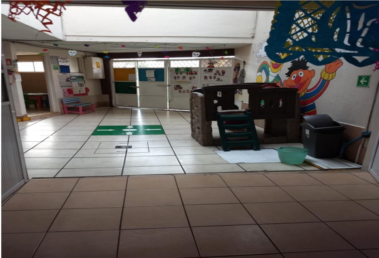
Fotografía 3-AP Patio principal punto de reunión en caso de emergencia

De frente a la biblioteca está el salón de preescolar 1 y este cuenta con una puerta blanca de madera con seguro arriba tres mesitas y 8 sillitas de madera pintadas de verde y azul, un pizarrón pequeño mueble para los materiales de la maestra y un mueble librero pegado a la pared para colocar los libros y cuadernos de los pequeños