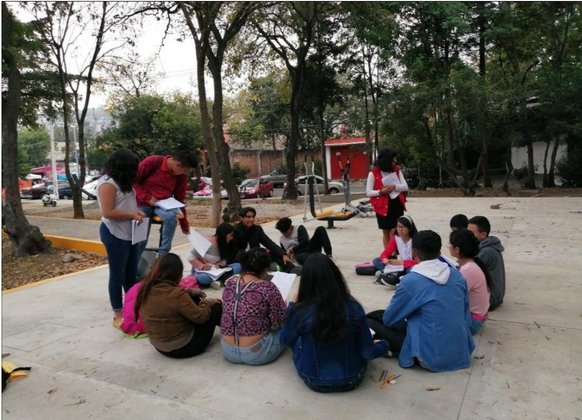
Fotografía de adolescentes en la Escuela Autónoma Red Paulo Freire

“Nadie tiene libertad para ser libre, sino que, al no ser libre lucha por conseguir su libertad”.